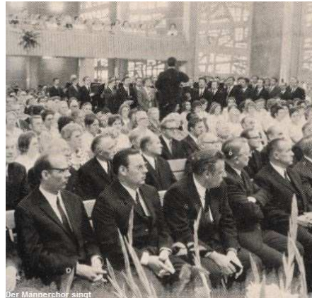
Der Männerchor singt

wahrer göttlicher Verehrungsstand. So zog er sich in die Stille seines Hauses zurück und bat den lieben Gott, ihm den rechten Weg zu zeigen. Es dauerte nicht lange, bis er mit einem unserer Brüder in Verbindung kam. Auch ich habe ihn besucht und habe ihn mit dem Wirken Gottes in der Gegenwart bekanntgemacht. In der Nacht darauf erschien ihm zum erstenmal in seinem Leben seine verstorbene Mutter im Traum. Er nahm dieses als besonderes Zeichen und er befaßte sich von da an immer mehr mit der Wirksamkeit des Heiligen Geistes im Gnaden- und Apostelamt.