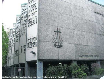
Die Kirche Hamburg-Altona kurz vor ihrer Profanierung im Juni 2012

Auf diesem Auszug begegnete dem Abraham der Gesandte Gottes in drei Männern, und auf unserem Auszug begegnen uns immer wieder die drei, der Vater, der Sohn und der Geist, in denen, die er heute zu uns sendet.