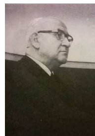
BEZIRKSAPOSTEL KARL WEINMANN, HAMBURG:

schaft mit Gott dem Vater und seinem Sohne gewiß.