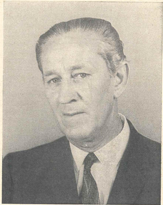
Apostel Erwin Wagner

Meine Eltern stammen aus einem kleinen Dorf in Siebenbürgen (Rumänien). Im Jahre 1926 kam mein Vater mit dem heutigen Apostel Kraus nach Kanada. Am 6. Juni 1929 wurde ich in Kitchener, Ontario (Kanada), in dem Hause gottesfürchtiger Eltern geboren. Als ich 15 Monate alt war, gaben mich meine Eltern nach Siebenbürgen zu meinen Großeltern; ich sollte dort ihre Rückkehr zu einem späteren Zeitpunkt abwarten. So lernte ich die Sprache der Landesbewohner.