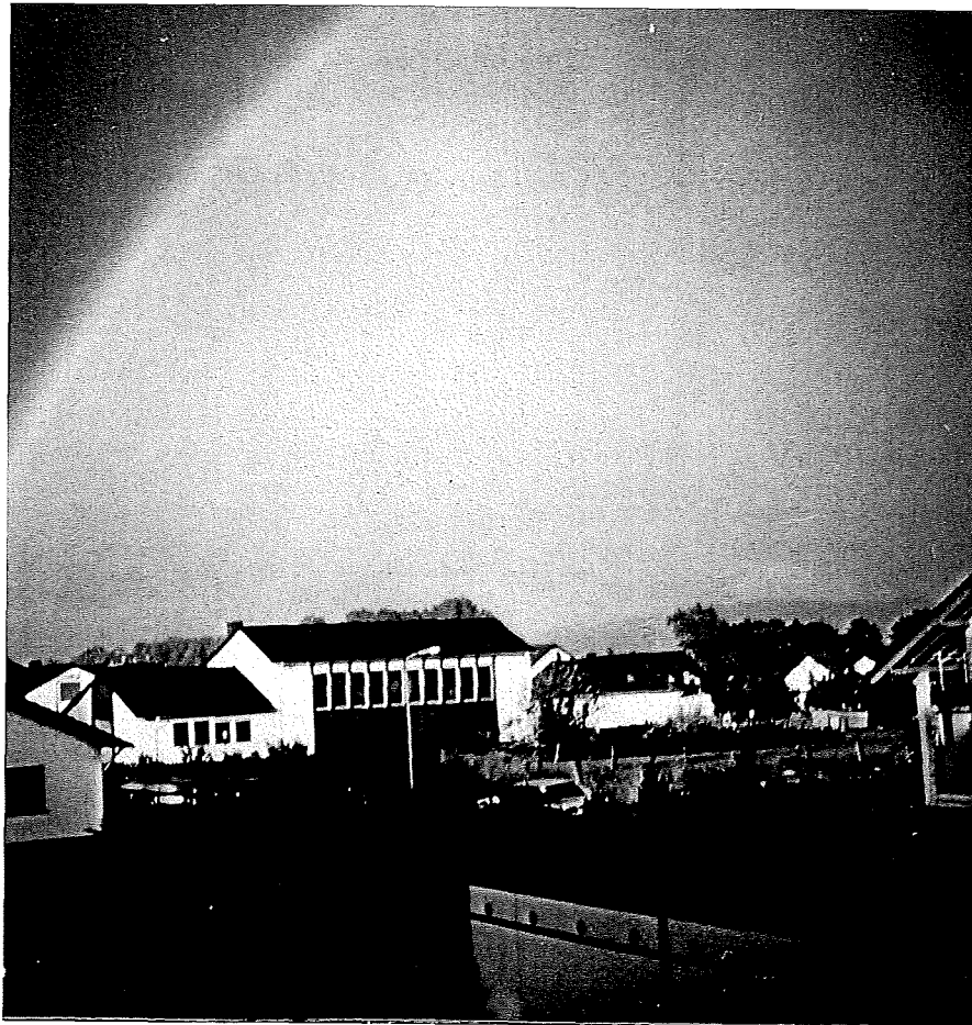
„Meinen Bogen habe ich gesetzt in die Wolken ...“ (1.Mose 9,13) - Das göttliche Zeichen des Gnadenbundes über unserer Kirche in Gießen-Wieseck, Einweihung 12.09.1976