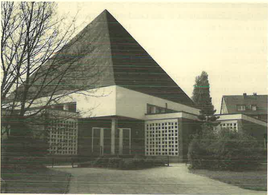
Die Kirche Essen-Mitte, in der am Sonntag, dem 11. Dezember 1994, der Gottesdienst des Stammapostels stattfindet.