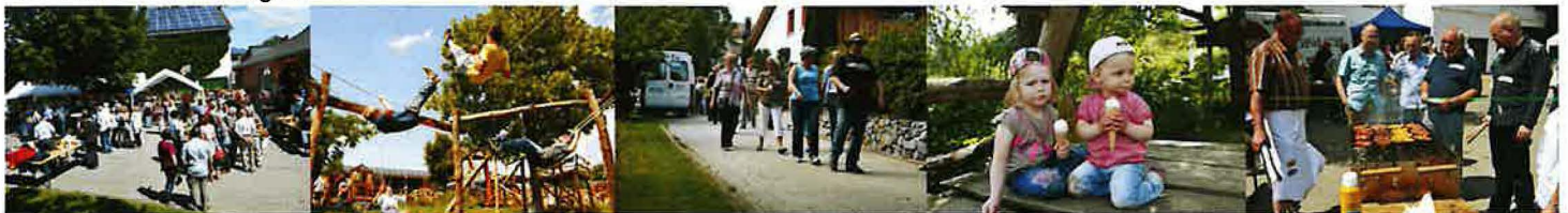
Eindrücke Bezirkstag 2011

Die Brüder und Schwestern aus dem Ennepe-Ruhr-Kreis