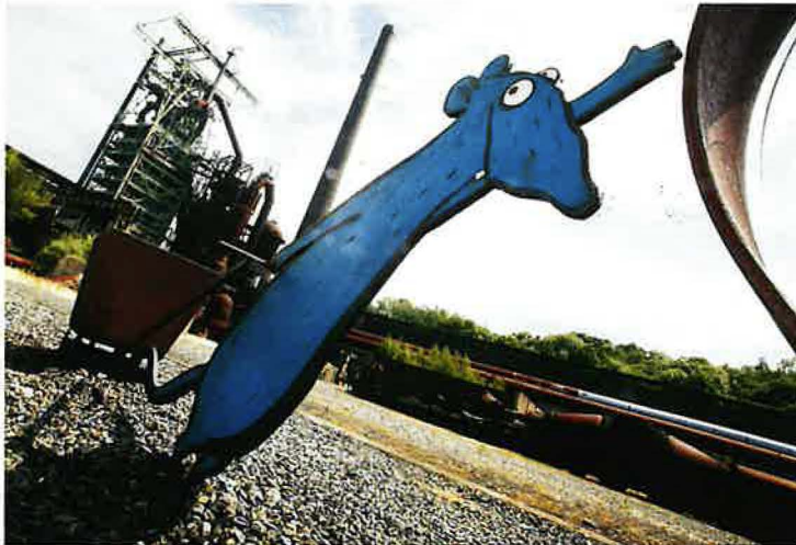
Museumsmaskottchen „Ratte“ vor dem Hochofen der Henrichshütte

Neuapostolische Kirche Nordrhein-Westfalen, Bezirk Ennepe-Ruhr