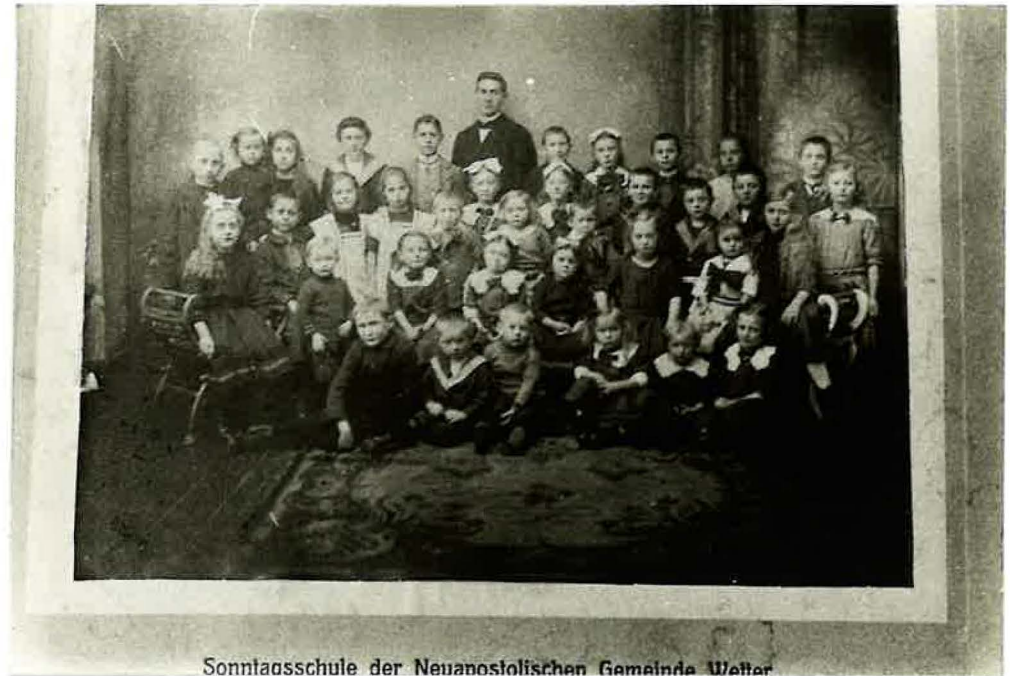
Sonntaasschule der Neuanostolischen Gemeinde Wetter

Im Jahre 1915 wird die Gemeinde dem Priester Alwin Lütgarth anvertraut. Er war am 30. Mai 1909 durch Apostel Bornemann versiegelt worden und konnte am 29. Januar 1911 ebenfalls durch Apostel Bornemann das Unterdiakonenamt empfangen. Das Priesteramt erhielt er am 19. Juli 1914 im Alter von 27 Jahren.