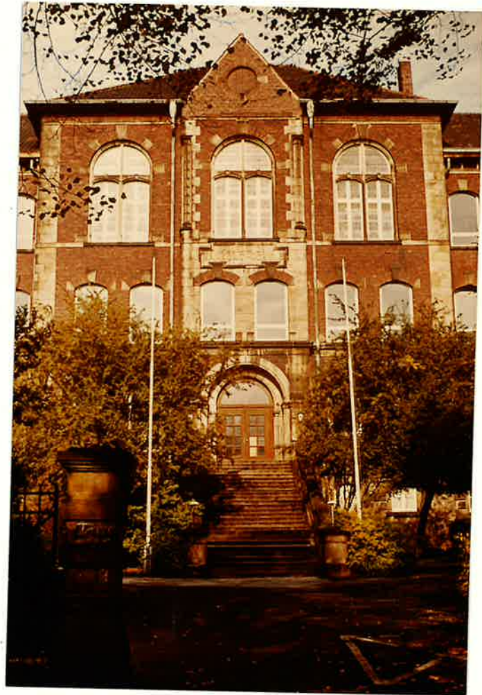
Bild 2: Eingangsseite zur Aufbauschule Herdecke, der zweiten Versammlungsstätte der Gemeinde

Geräuschbelästigungen aus der benachbarten Gastwirtschaft waren schon bald der Anlaß, einen geeigneteren Versammlungsort zu suchen. Noch im selben Jahr fand er sich in einem Klassenraum der Aufbauschule in der Harkortstraße. Bild 2 zeigt die Eingangsseite des später abgerissenen Schulgebäudes.