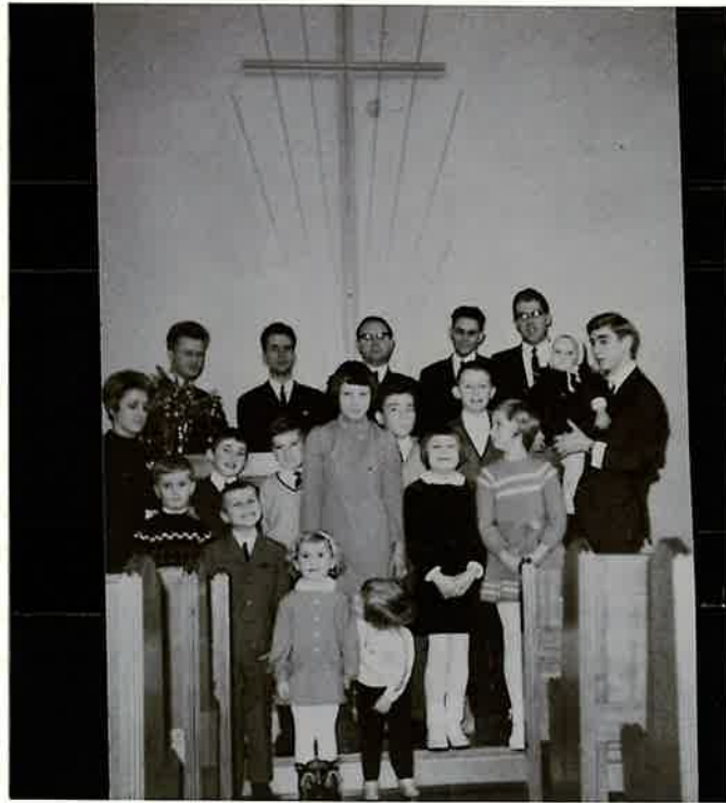
Bild 7: Sonntagschulkinder und Amtsträger der Gemeinde Herdecke im Dezember 1977

Zwei Jahre später wurde dieser Kreis vergrößert. Der Bruder Dieter Jablonka empfing das Unterdiakonenamt. In der Weihnachtszeit 1967 entstand Bild 7. Es zeigt vor dem Altar die Sonntagschulkinder mit Helfern und im Hintergrund die 5 Amtsträger der Gemeinde.