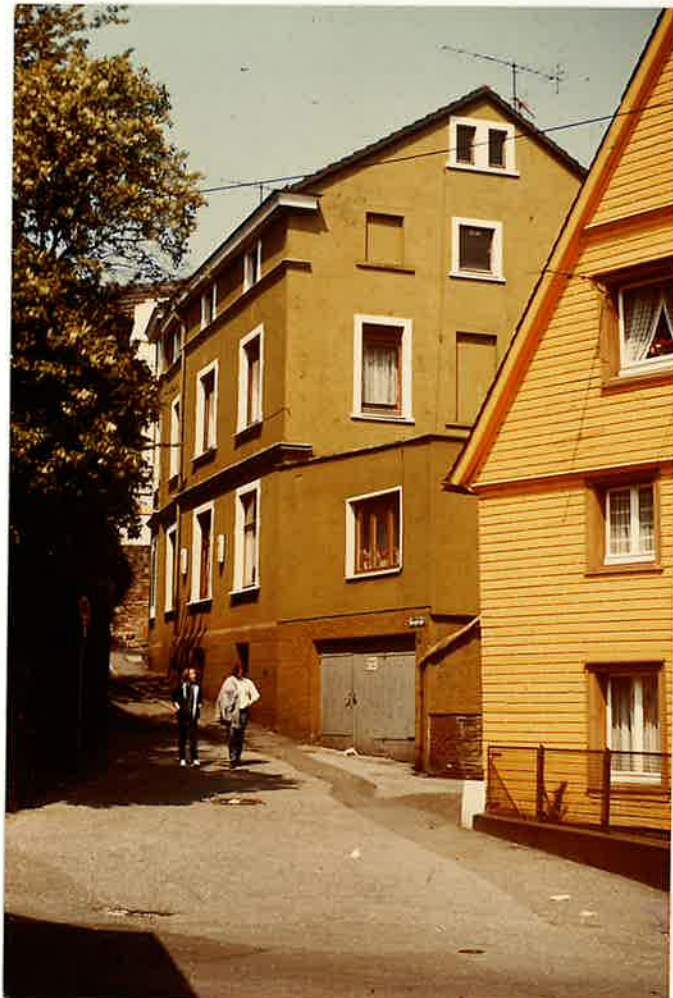
Bild 1: Eingangsseite zur ersten Versamlungsstätte der Gemeinde Herdecke in der Bergstraße