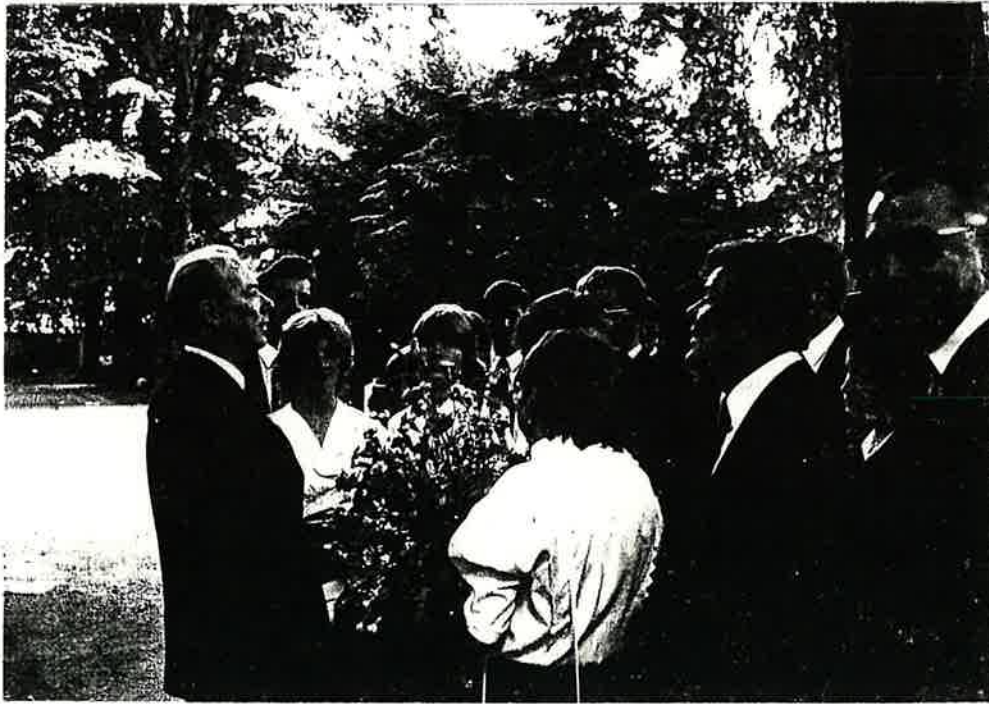
Der Bezirksevangelist mit der Jugend auf dem Westfriedhof