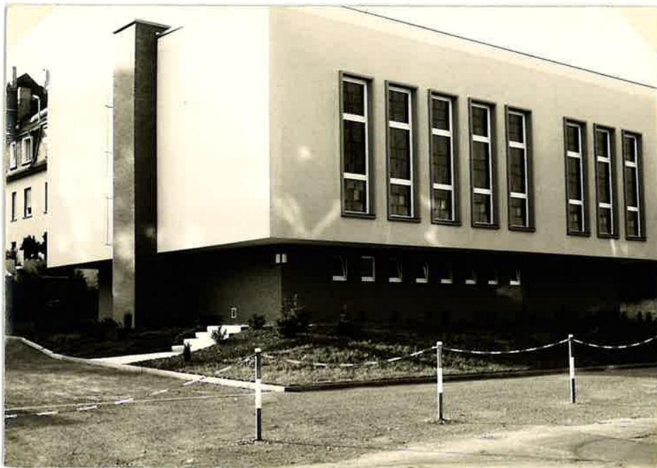
unser neues Kirchenlokal Im Hölken

Die Freude der Gemeinde war groß, hatte sie doch jetzt eine eigene Versammlungsstätte.