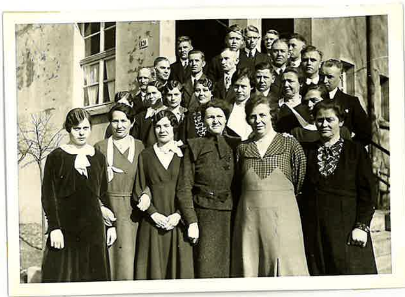
Gesangchor der Gemeinde Nächstebreck im Jahre 1931