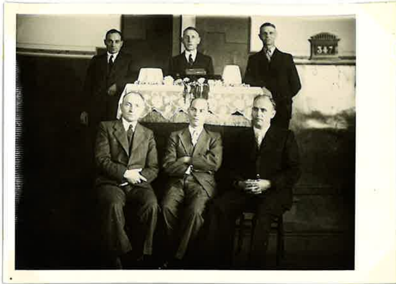
Ämterkreis im Jahre 1946