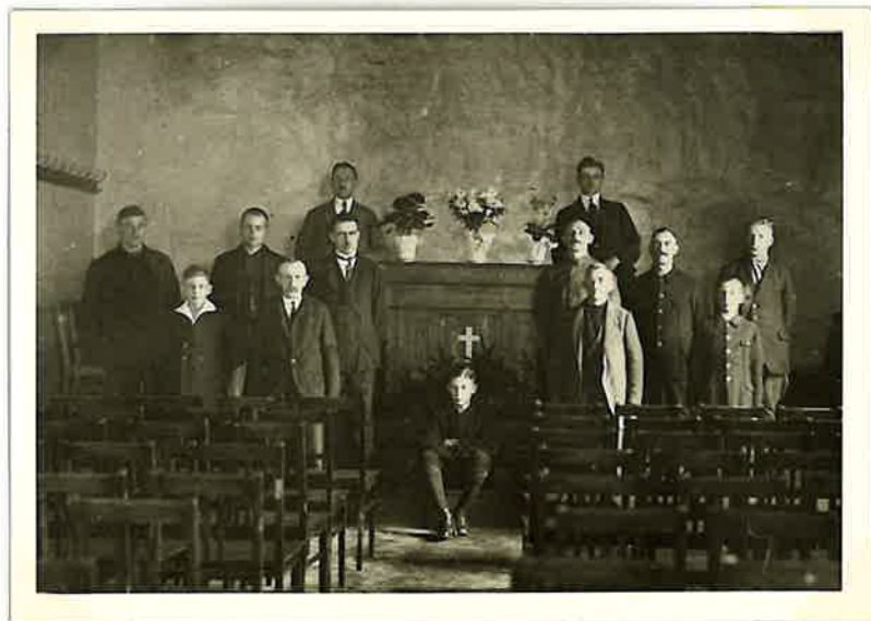
Das erste 1926 gemietete Kirchenlokal