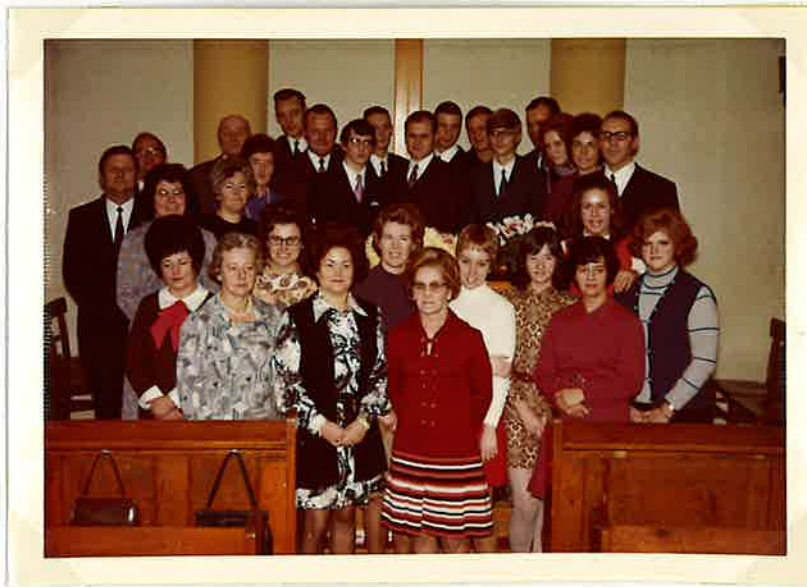
Gesangchor der Gemeinde Nächstebreck im Jahre 1970