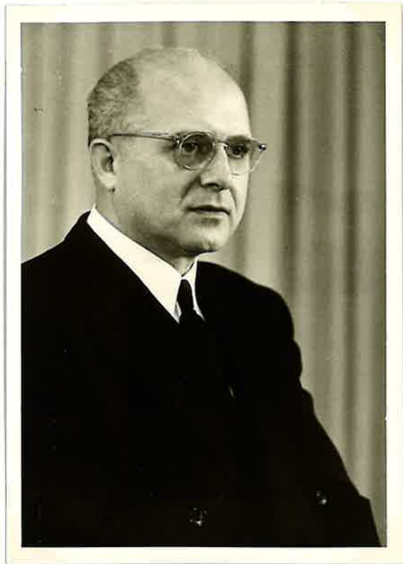
Apostel Ewald Hiby