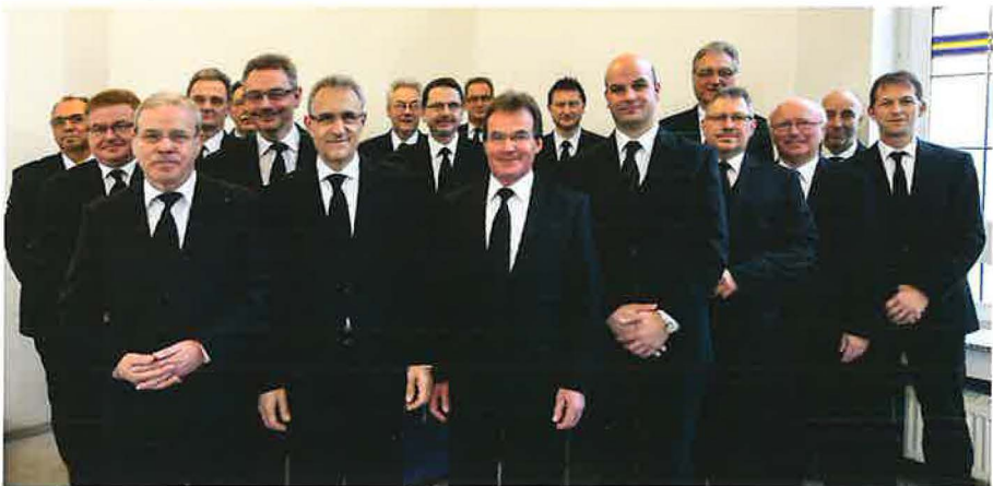
Vorsteher, Bezirksvorsteher, Bischof und Apostel des Kirchenbezirks Wuppertal