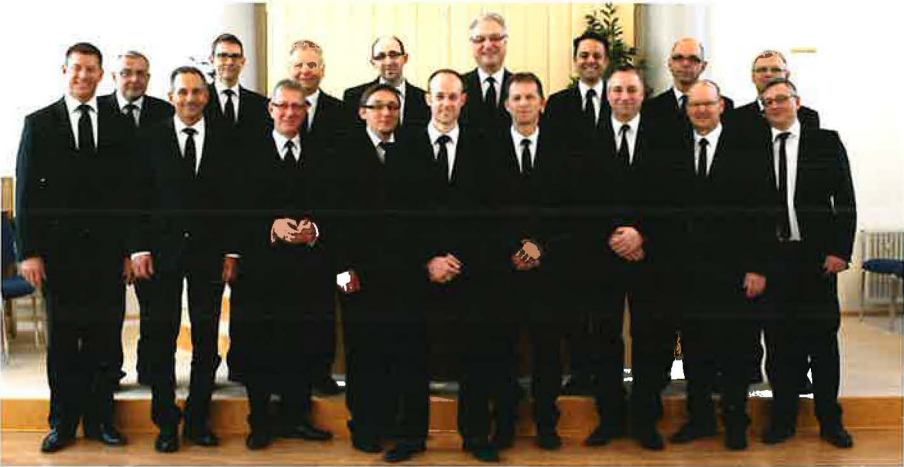
Die Amtsträger der Gemeinde Wuppertal-Elberfeld im Februar 2014

Ihm sind sieben Priester und elf Diakone zur seelsorgerischen Versorgung der etwa fünfhundert Gemeindemitglieder zur Seite gestellt. Alle Seelsorger und Funktionsträger der Gemeinde versehen ihren Dienst ehrenamtlich.