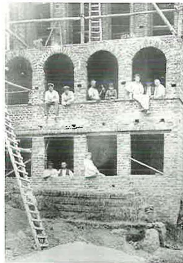
Die erste eigene Kirche 1929 (im Bau)

Während in den letzten vier Jahrzehnten 24 Gemeinden gegründet werden konnten, kam nun ab 1930 eine schwierige Zeit, die die Entwicklung hemmte. Schließlich brach der zweite Weltkrieg aus. Die Folgen waren für Wuppertal verheerend. Bomben löschten ganze Stadtgebiete aus und brachten vielen Einwohnern den Tod. Auch drei Kirchengebäude wurden zerstört: Elberfeld, Barmen und Vohwinkel. Bis zum Wiederaufbau mussten sich alle Geschwister, die nicht evakuiert waren, mit Hausandachten begnügen.