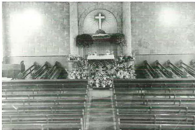
Innenansicht der neuen Kirche vor der Einweihung