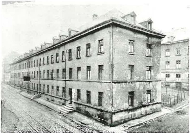
1889 versammelte sich eine kleine Schar gläubiger Christen regelmäßig zu Gebetsstunden und Hausandachten in ihren Wohnungen am Osterbaum

Auch der erste Weltkrieg konnte die Ausbreitung des Werkes Gottes nicht verhindern. Stammapostel Niehaus, der den Apostelbezirk betreute, musste zu Beginn der zwanziger Jahre eine Neuaufteilung in zwei Apostelbezirke vornehmen. Er trennte Rheinland von Westfalen. Elberfeld gehörte nun zum Rheinland unter Apostel Dach.