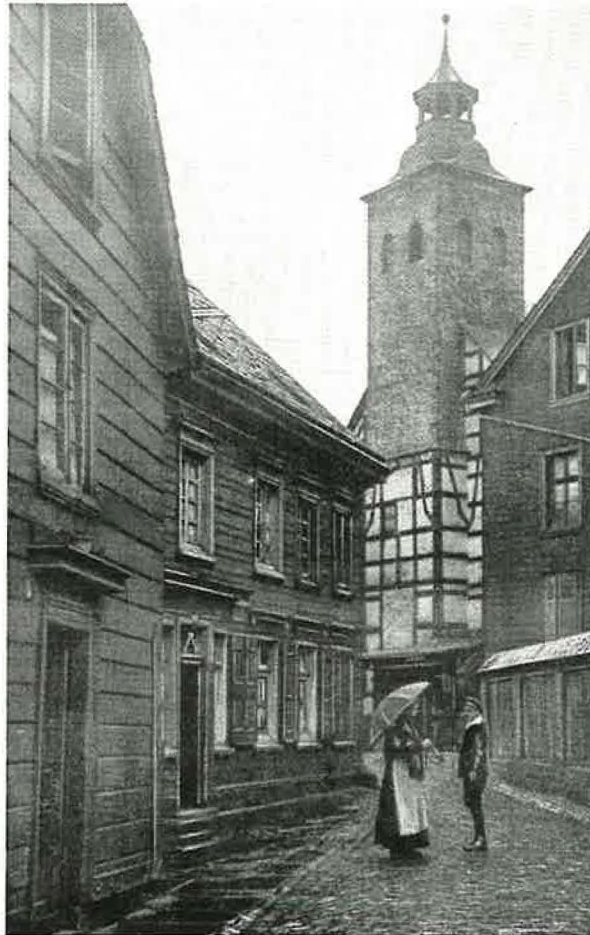
Viele Kirchengebäude in Wuppertal zeigen die tiefe Religiosität der Menschen (um 1800)