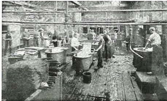
Garnfärberei um 1800