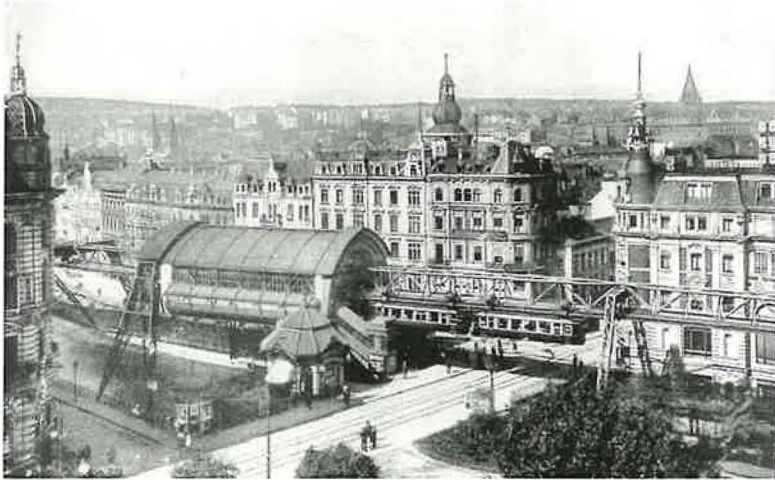
Wuppertal-Elberfeld im Jahre 1915