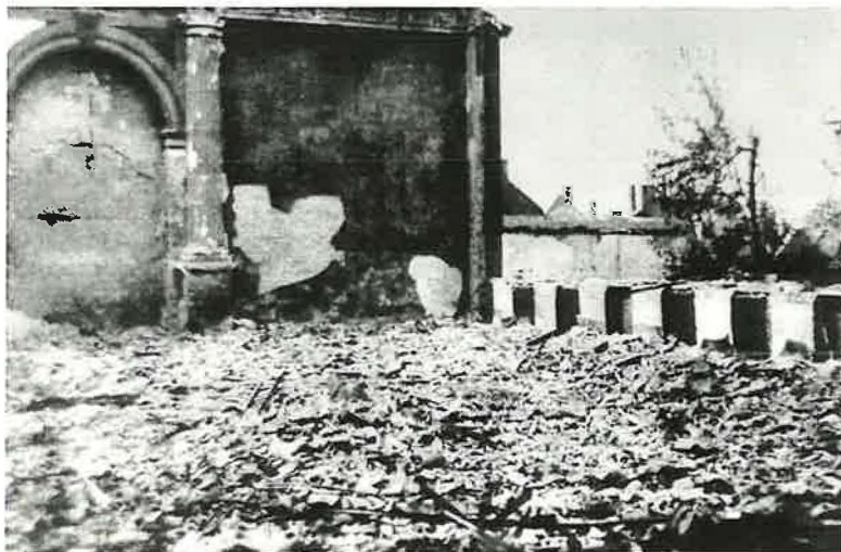
Bei Bombenangriffen auf Wuppertal im Juni 1943 wurde nach der Barmer nun auch die Elberfelder Kirche zerstört.

Am 7. August 1949, mehr als 6 Jahre nach der Zerstörung und rund 20 Jahre nach der Ersteinweihung, konnte die neu aufgebaute Kirche Hardtstraße geweiht werden.