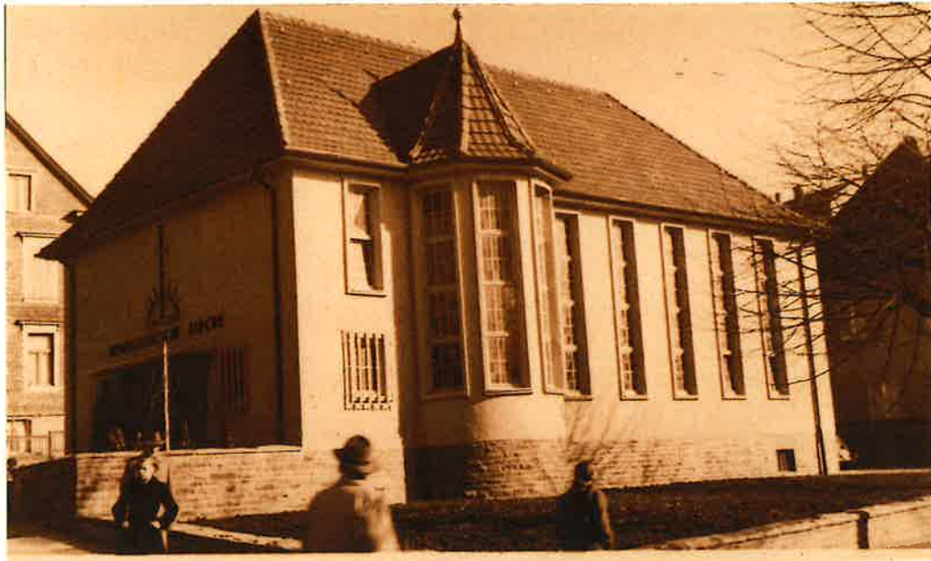
Die Kirche nach ihrer Fertigstellung im Jahre 1952.