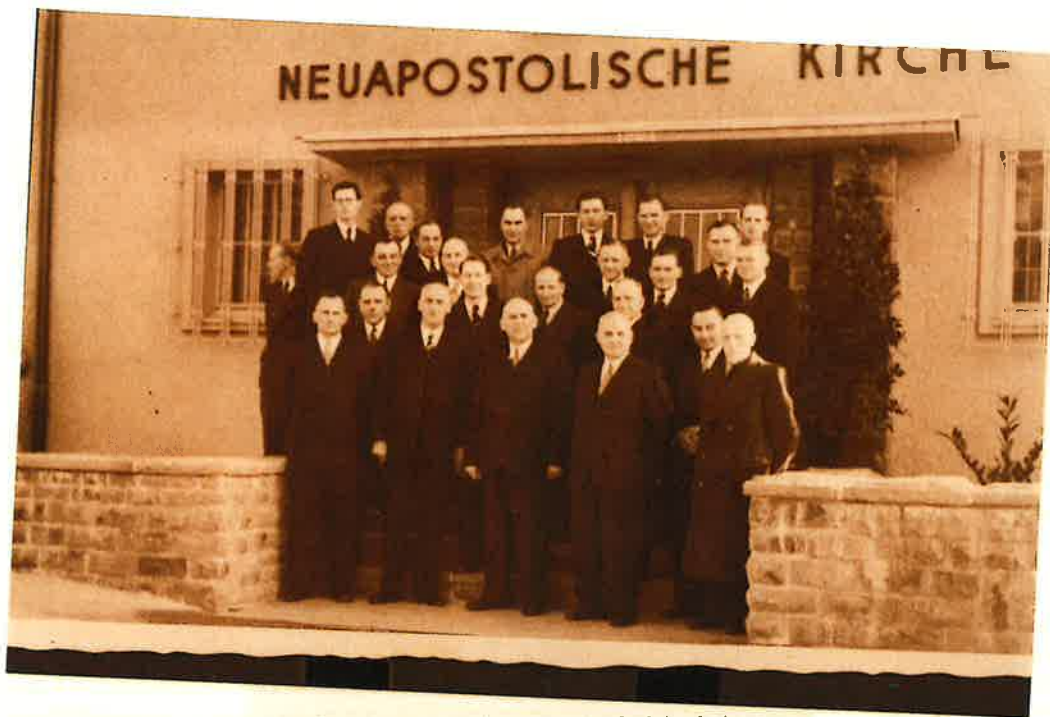
Amtsbrüder und Architekten nach dem Einweihungsgottes- dienst am 19. Oktober 1952. Erste Reihe - in der Mitte - Bischof Otto.