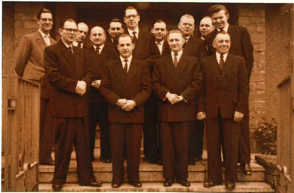
Die Amtsbrüder der Gemeinde im Jahre 1958.