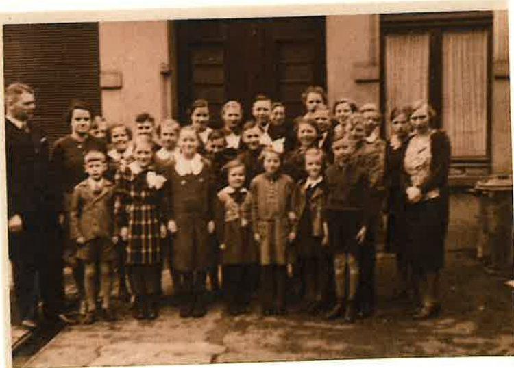
Die Sonntagschule am Tage des Konfirmations- gottesdienstes am 17. März 1940.