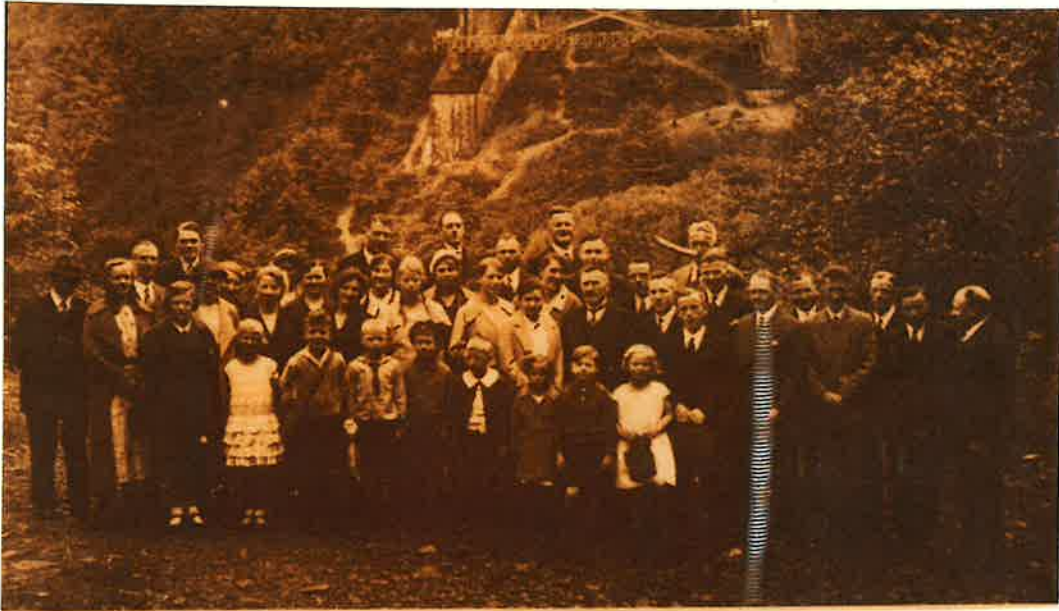
Der gemischte Chor bei einem Ausflug um 1935 an der Müngstener Brücke.