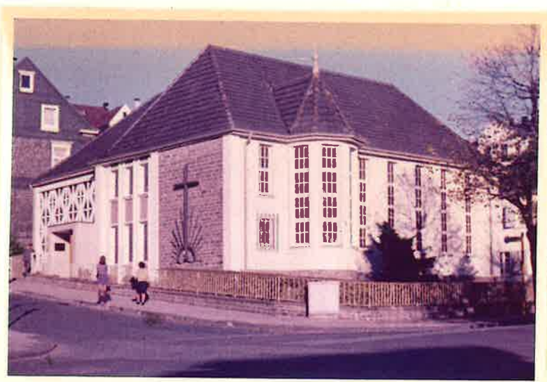
Die Kirche nach der Erweiterung im Jahre 1970/71.