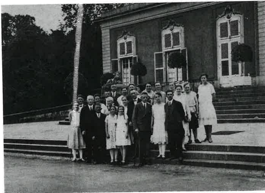
Ausflug nach Benrath