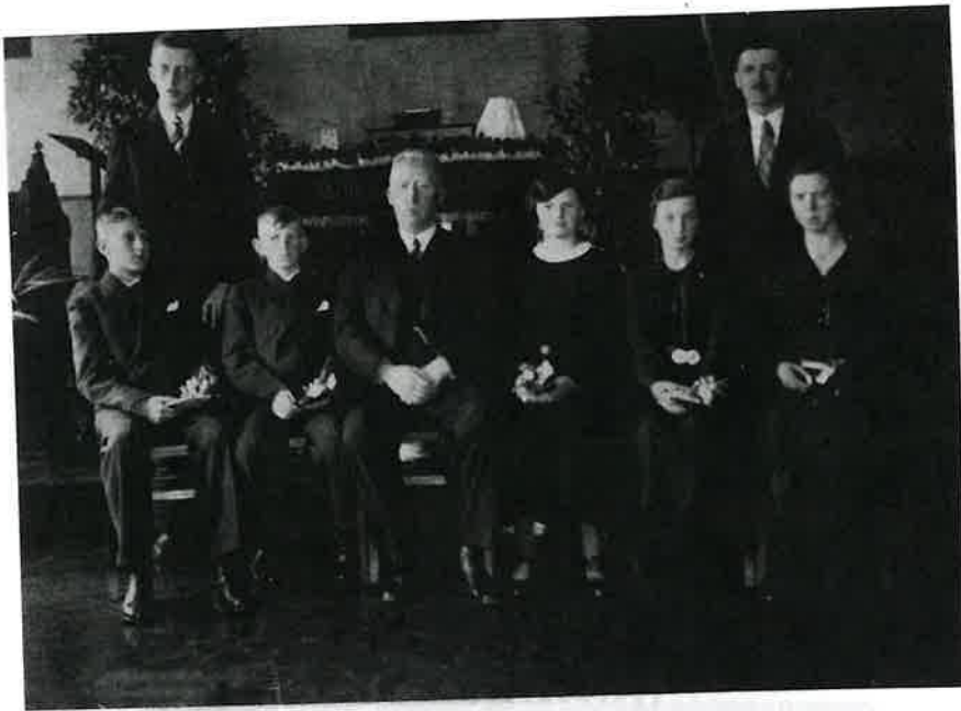
Konfirmation 1935