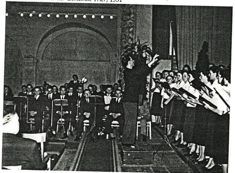
Chor und Orchester der Gemeinde Trier, 1951