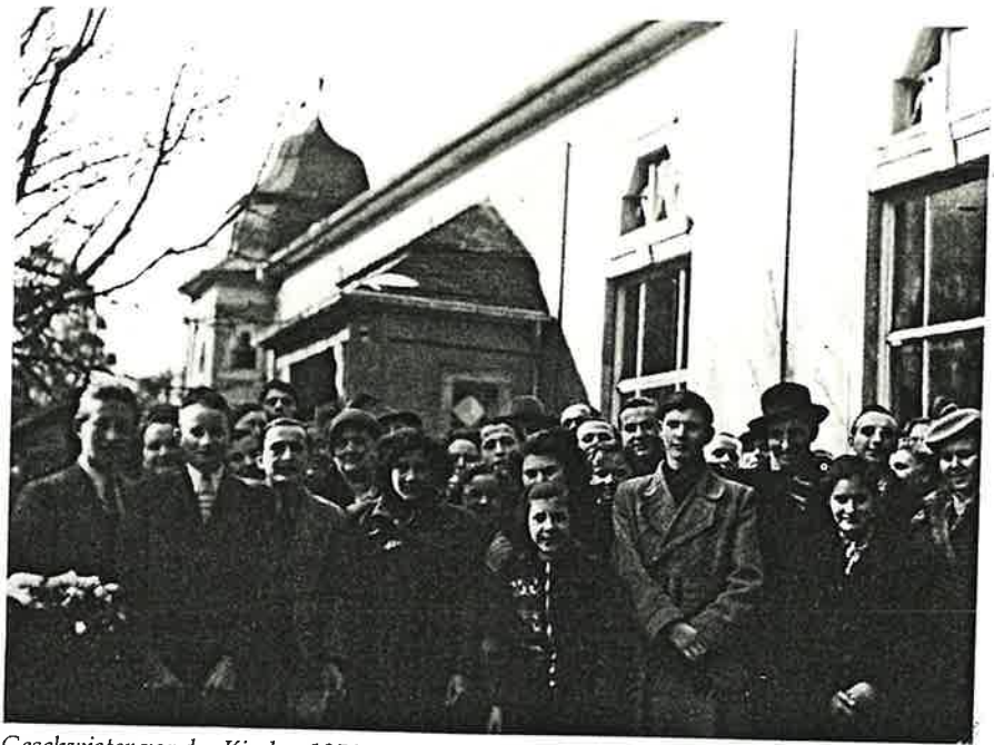
Geschwister vor der Kirche, 1951

Die Gemeinde Trier wurde 1933 an den Apostelbezirk Frankfurt angeschlossen. Sie stand kurze Zeit unter der Pflege des damaligen Stammapostels Bischoff und des Apostels Landgraf. 1934 übernahm der Apostel Buchner den Bezirk Frankfurt, bis er 1950 von Apostel Rockenfelder abgelöst wurde. Dieser diente von 1933 bis 28. Dezember 1947 als Bezirksältester und anschließend, bis zur Übernahme des Apostelbezirkes, als Bischof den Geschwistern in Trier. Ihm zur Seite stand damals schon der heutige Bezirksapostel Friedrich Bischoff, der als Bezirksevangelist und Bezirksältester die Gemeinde betreute. Am 5. August 1951 wurde Friedrich Bischoff in