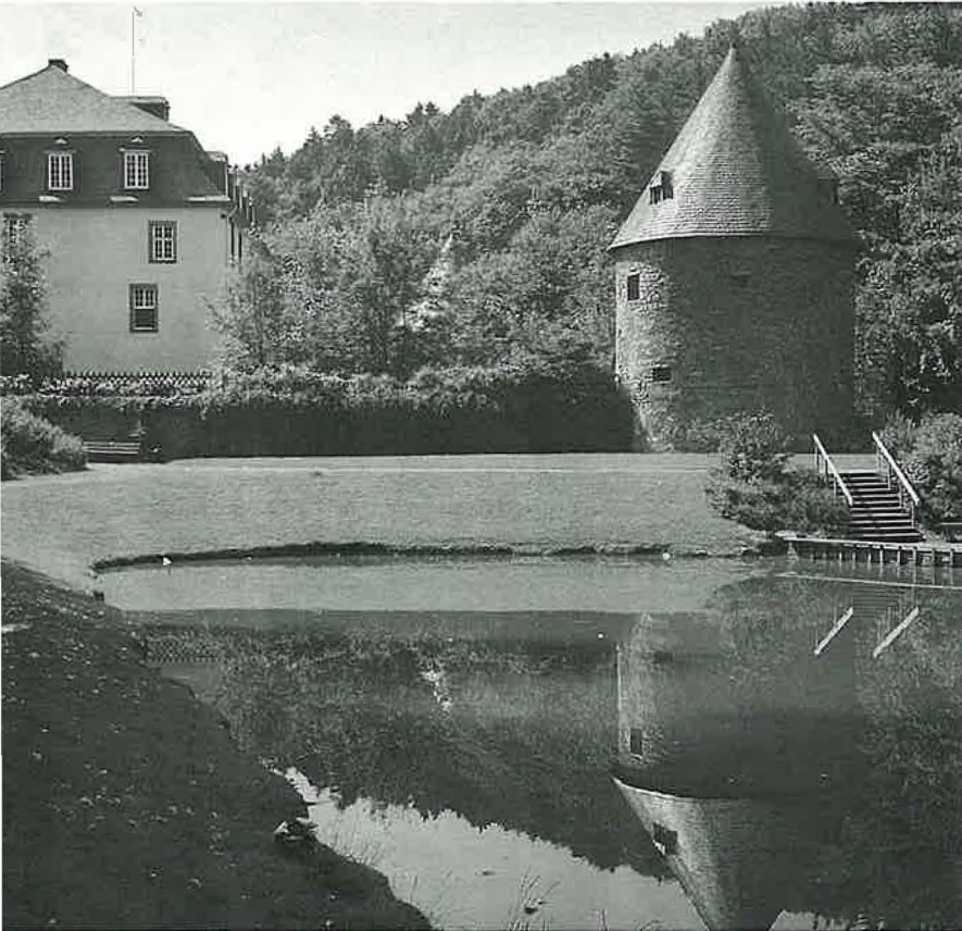
Schloß Hardenberg im Stadtteil Neviges

Schloß- und Beschlägemuseum in Velbert zeigt faszinierende Einblicke in die Welt der Schließtechnik – eine 5000-jährige Geschichte, die zeigt, wie gesellschaftliches und kulturelles Leben mitbestimmt werden durch die Möglichkeit, etwas zu öffnen oder zu verschließen.