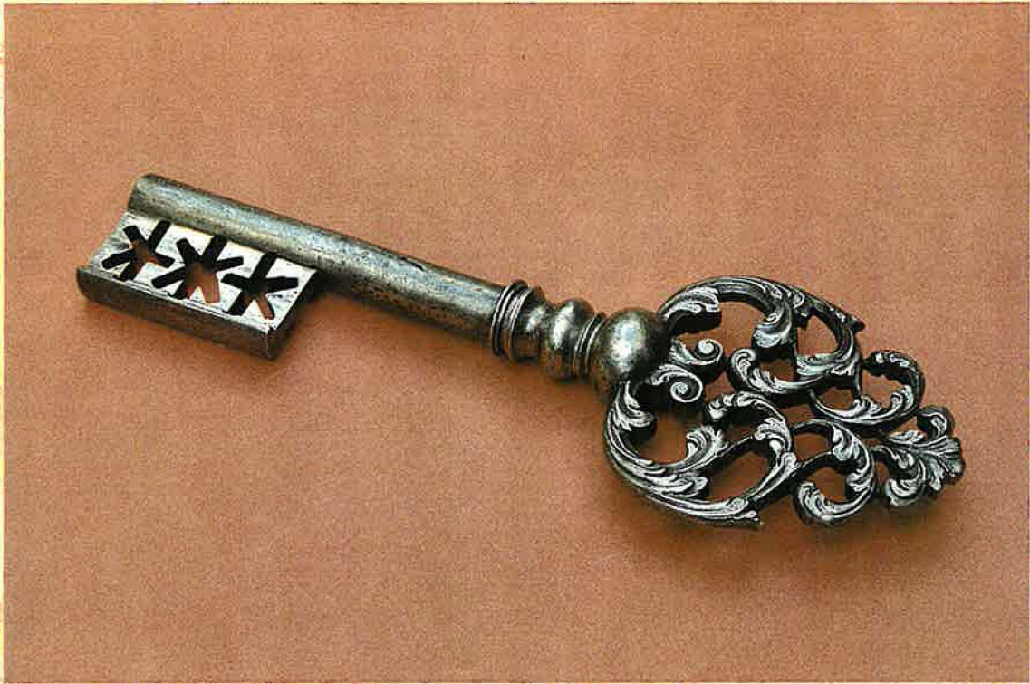
Eisenschnittschlüssel, England 18. Jahrh.