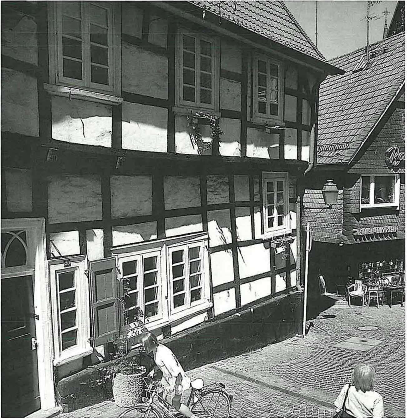
Historischer Stadtkern im Stadtteil Langenberg.