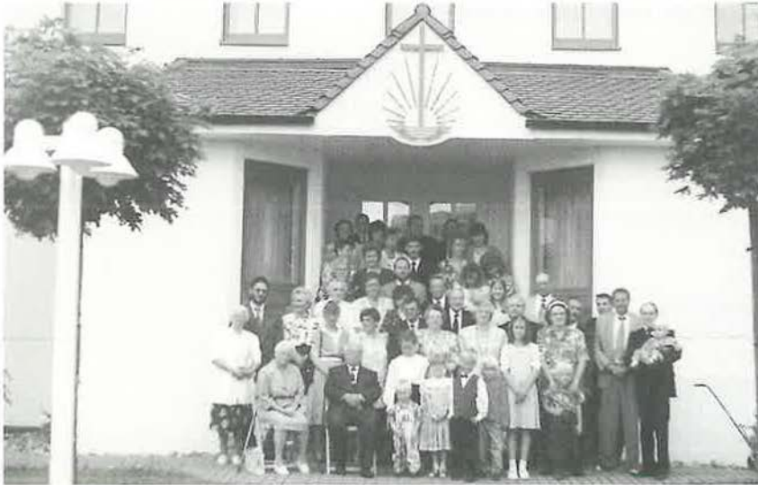
Die Gemeinde im Jahr 1996

tet, die den Empfang von Gottesdienstübertragungen aus ganz Europa und Übersee ermöglicht.