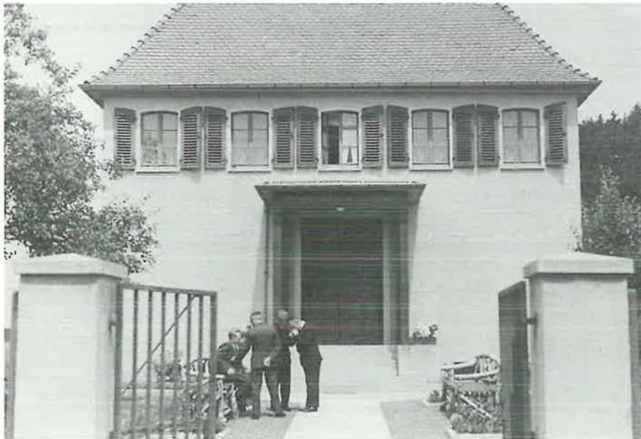
Das neue Kirchengebäude 1932

Stammapostel Bischoff regte daher 1931 den Bau einer eigenen