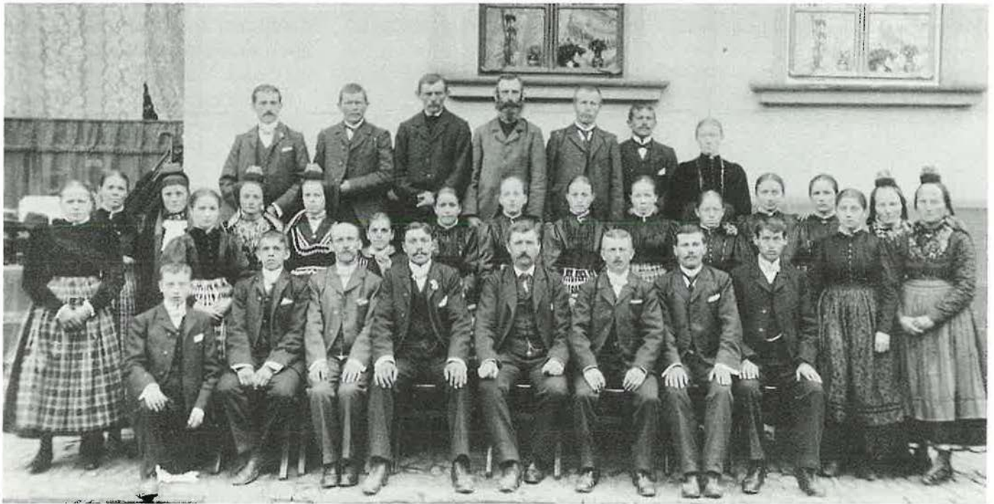
Der Gesangchor der Gemeinde im Jahre 1907

dass in Erda die ersten Gottesdienste gehalten wurden. Es muss damals eine Sensation gewesen sein, als sich die Leute erzählten, es gäbe wieder Apostel! Im Bergwerk, in der Zigarrenfa-