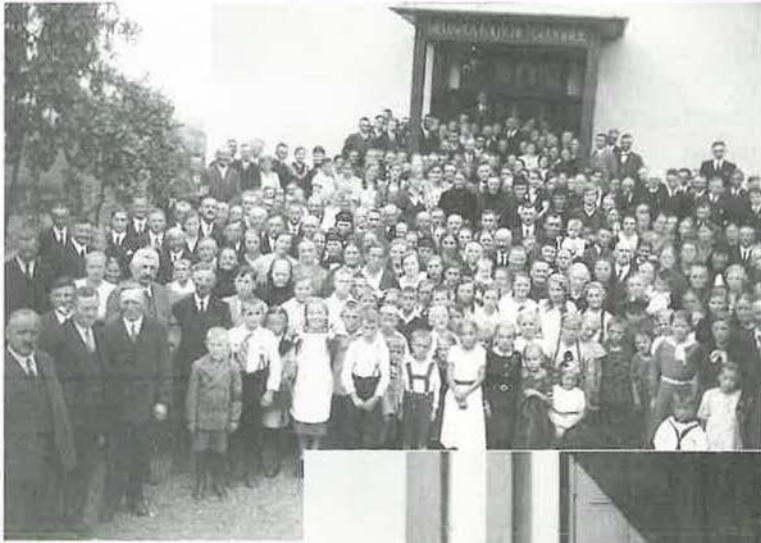
△ Einweihung 1932