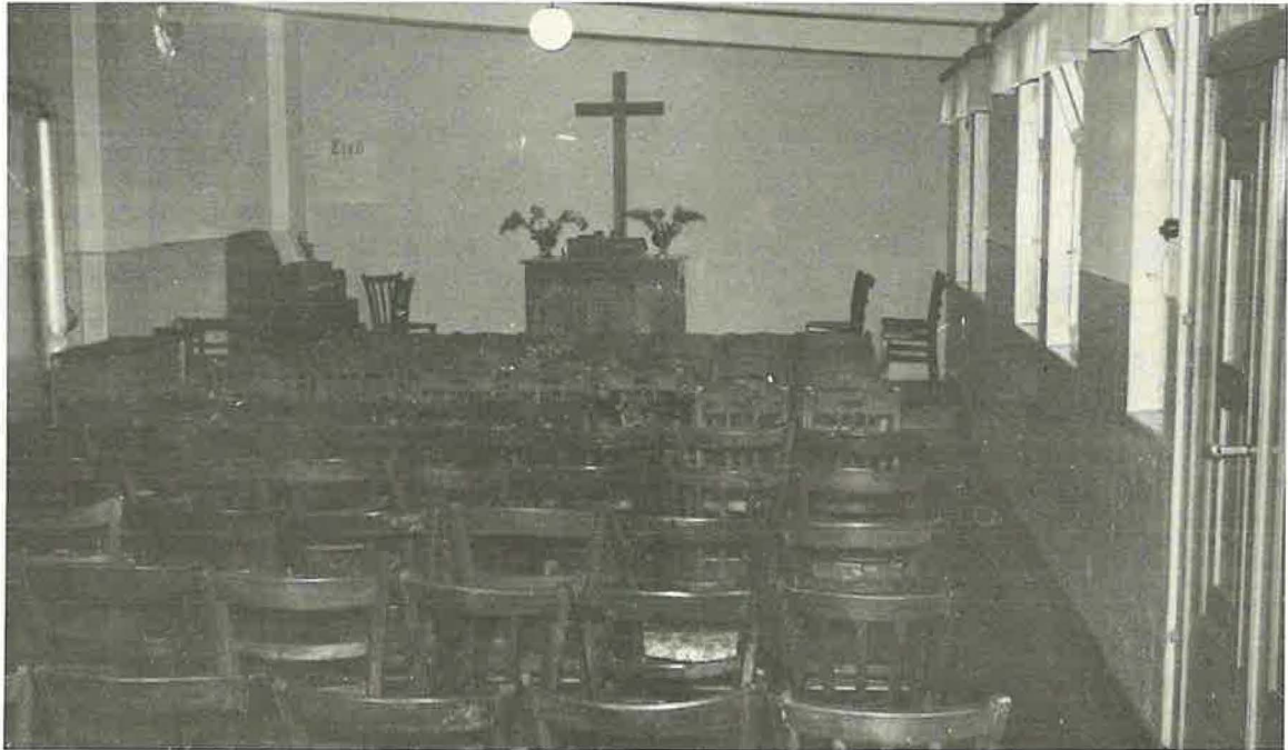
Innenansicht der Kirche Lage, Lange Straße 114