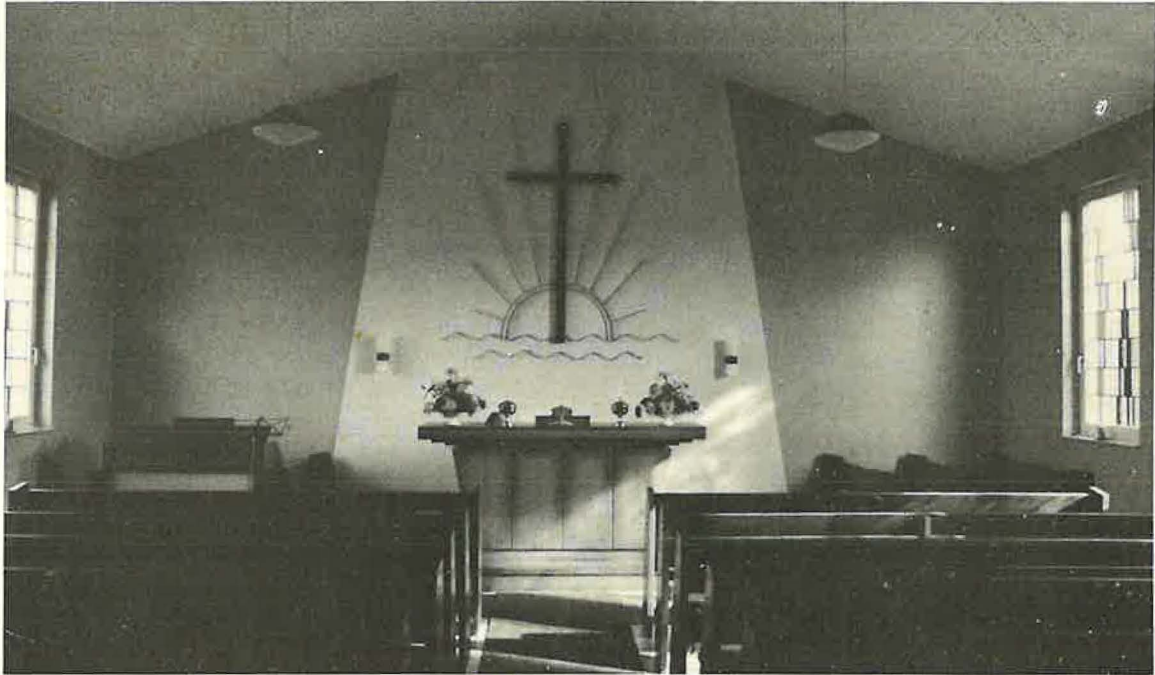
Unsere Kirche in Lage-Waddenhausen, Heerstr. 94 – Innenansicht –