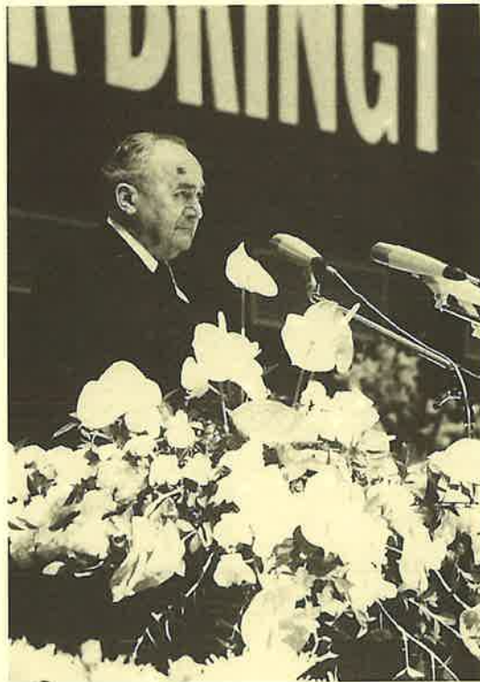
Stammapostel Ernst Streckeisen 1978 in der Ruhrlandhalle zu Bochum

such des ersten Gottesknechtes am 3. September aus. Voll gläubiger Erwartung blickt die Gemeinde auf das große Ereignis und den göttlichen Segen, den der Stammapostel und seine Begleiter bringen werden.