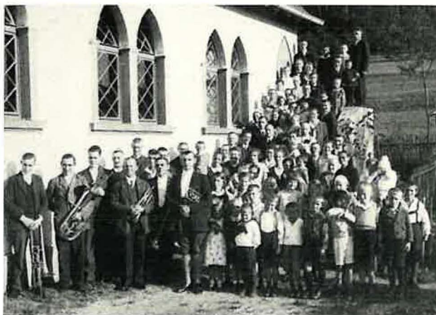
Kirche Mölschbach mit Gemeinde