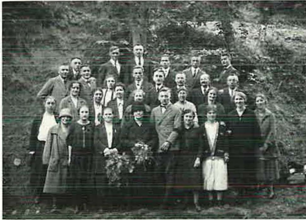
Gemischter Chor (1926)

Apostel konnte jedes Jahr eine stattliche Schar durch die heilige Versiegelung hinzufügen. 1920 waren es 36, 1921 39, 1922 sogar 64 Seelen. Gewiß, die Menschen waren damals nach dem verlorenen Krieg sehr arm. Es herrschte in manchen Familien bittere Not, und die Last der Besatzungszeit lag drückend auf allen Einwohnern. Da mögen wohl manche Menschen nach einer Stätte gesucht haben, in der sie Hilfe und Frieden finden konnten. Die kleine Gemeinde sang damals oft das Lied „Ein Herz und eine Seele war der ersten Christen Menge“. Das kam innig aus allen Herzen, denn sie fühlten sich eng verbunden mit allen Gotteskindern in dieser ernsten, schweren Zeit, genauso wie die Geschwister am Anfang des Erlösungswerks. Jeder einzelne war bemüht, im kindlichen Glauben und im Glaubensgehorsam offenbar zu werden. Sowohl das Wort eines