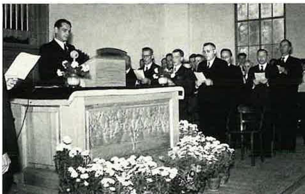
Einweihung der neuen Kirche durch Apostel Hahn

Oft mußten viele draußen stehen bleiben. Deshalb entschloß sich Apostel Hartmann, für die Gemeinde eine neue Kirche zu bauen. Bei Durchführung dieses Planes kamen ihm die Behörden sehr entgegen. Im Rahmen des Aufbauprogramms der zerstörten Stadt wurde uns ein großer, schöner Platz zur Verfügung gestellt. Nach verschiedenen Vorentwürfen wurde der Plan des jungen Architekten W. Heil angenommen, nach dem dann die heutige Kirche gebaut wurde. Sie war einer der ersten größeren Repräsentationsbauten, die nach dem Krieg in Kaiserslautern erstellt wurden, und fügt sich gut in das Stadtbild ein. Im Frühjahr 1950 wurde zunächst der kleine Saal bezugsfertig, so daß dort schon Gottesdienste gehalten werden konnten, wenn auch die Geschwister dicht zusammengedrängt sitzen mußten. Zu dieser Zeit kamen auch eine ganze Anzahl treuer Geschwister aus den abgetrennten Ostgebieten unseres Vaterlandes hinzu, um in Kaiserslautern eine neue Heimat zu finden. Darunter waren auch altbewährte Amtsbrüder, die durch den Apostel bestätigt, in der Gemeinde segensreich wirken konnten. Apostel Hartmann, der diesen schönen, großen Kirchenbau durch sein weitsichtiges Vorausschauen errichten ließ, war es leider nicht vergönnt, die Einweihung selbst zu erleben und durchzuführen. Denn er starb plötzlich und unerwartet im Sommer 1950 in der Schweiz. Die Beisetzung fand in Karlsruhe statt. Im ganzen Apostelbezirk herrschte große