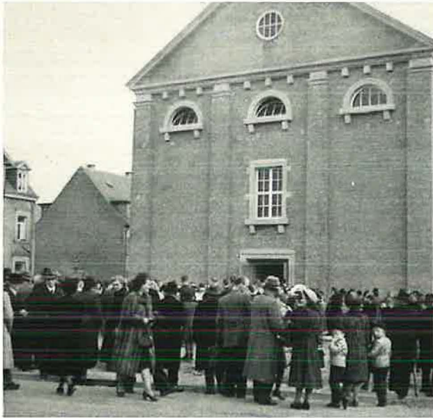
Vor der Kirche

nen Teil zur Einweihung beitragen. Zusammen mit Apostel Hahn kam auch der Bläserchor der Gemeinde Pforzheim. Er umrahmte die eindrucksvolle Einweihungsfeier durch sein Spiel und erfreute nach dem Gottesdienst vor der Kirche nicht nur die Geschwister, sondern auch alle, die vorübergingen und stehenblieben. Die Einweihung wurde auch in der Tagespresse in Bild und Wort entsprechend gewürdigt. Noch im gleichen Jahr kam Stammapostel Bischoff nach Kaiserslautern und diente in der neuen Kirche. Mehr als 1500 Geschwister waren anwesend. In den ersten Nachkriegsjahren war es