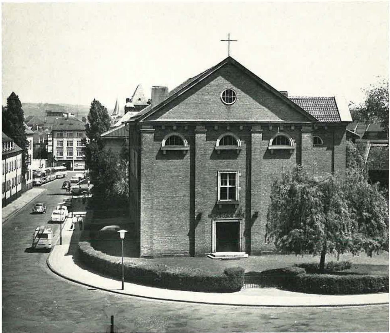
Neuapostolische Kirche, Friedrich-Engels-Straße — Haagstraße