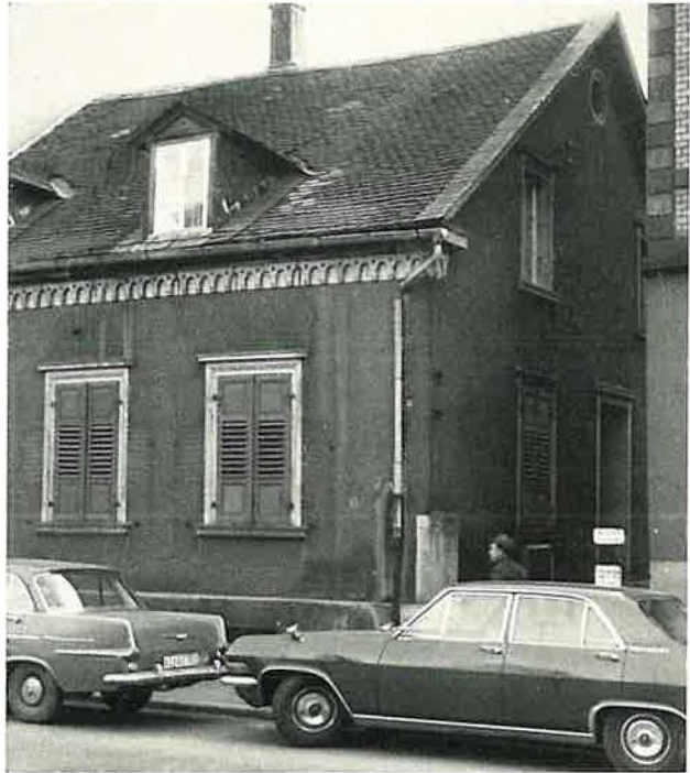
Dachstübchen Bismarckstraße 8