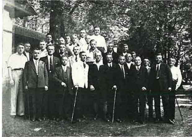
Amtsbrüder aus dem jungen Bezirk Kaiserslautern