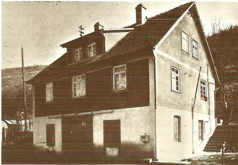
Haus in der Mühlenstraße 57, in dem unsere Gottesdienste stattfanden