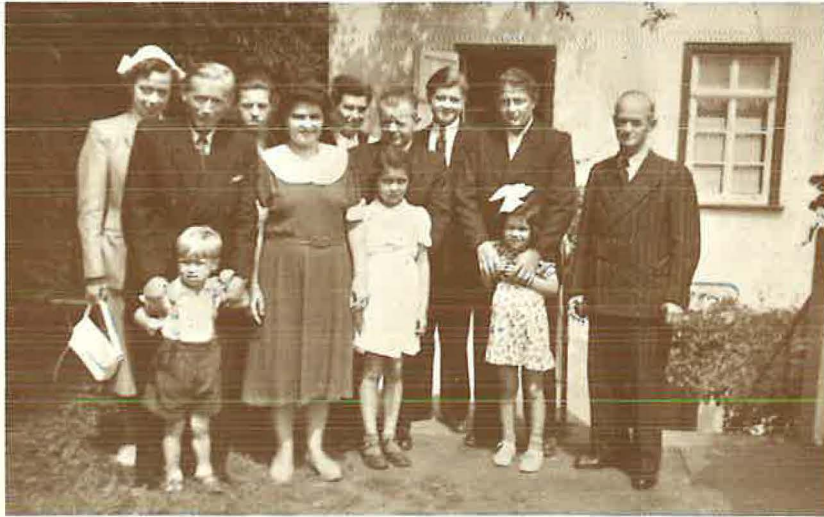
Die kleine Gemeinde Wertheim

Von dieser Zeit an fanden die Gottesdienste im Gasthof „Zum Waldhaus“ statt. Dort gab es Ausweichmöglichkeiten, wenn der Saal einmal anderweitig besetzt war. Im Winter versammelten sich die Geschwister in der mit einem Sägemehlofen beheizten Kegelbahn. Diese Wärmequelle hatte nicht nur Vorteile. Zuweilen hob sich der Ofendeckel (begleitet von einem explosionsartigem Geräusch); die entstandene Rauchwolke hüllte den Dienenden so ein, daß man ihn zwar