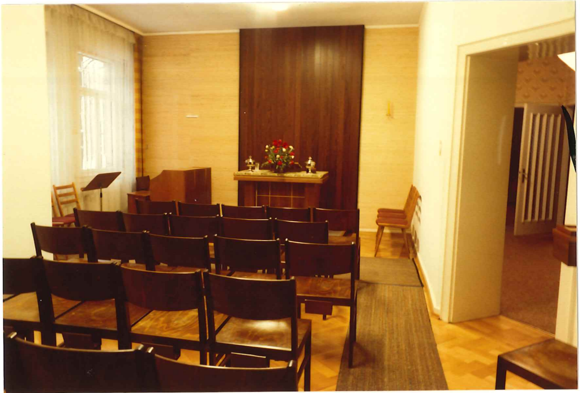
Blick zum Altar