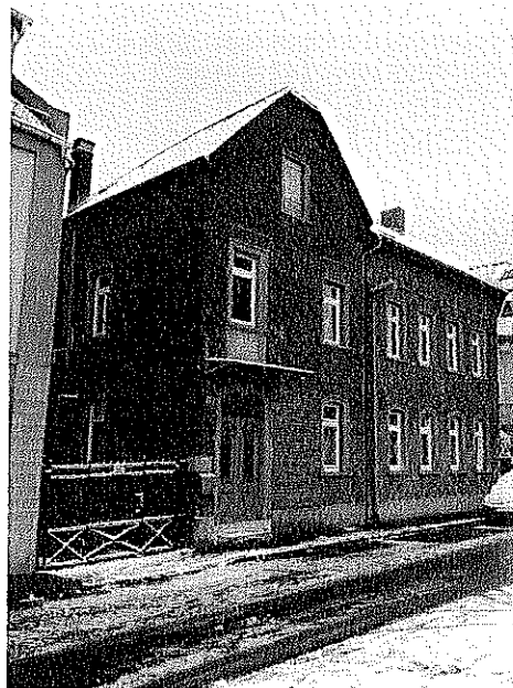
Im hinteren Teil dieses Grundstückes fand die erste Gemeinde ihren Versammlungsraum.

Tatsächlich bot sich nach einiger Zeit die Möglichkeit, das Anwesen Berliner Straße 22 zu erwerben und dort einen Versammlungsraum einzurichten.