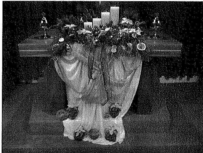
Altarschmuck zum Advent