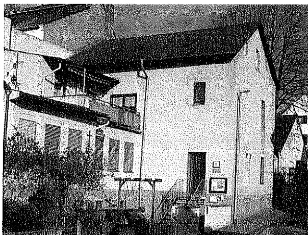
Wilhelmstraße 3, Außenansicht März 2007