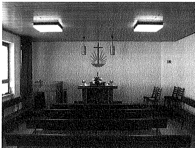
Vorderer Teil des Gottesdienstraums