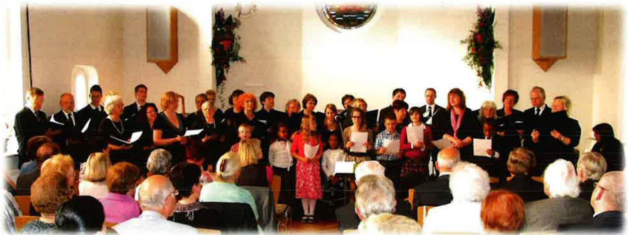
Gemischterchor mit Kinder- und Senioren-Chor beim Benefizkonzert im Mai 2012

So wächst die Gemeinde weiter als eine lebendigen Gemeinde mit einem gemeinsamen Ziel: Bereit zu sein auf die Wiederkunft Christi!