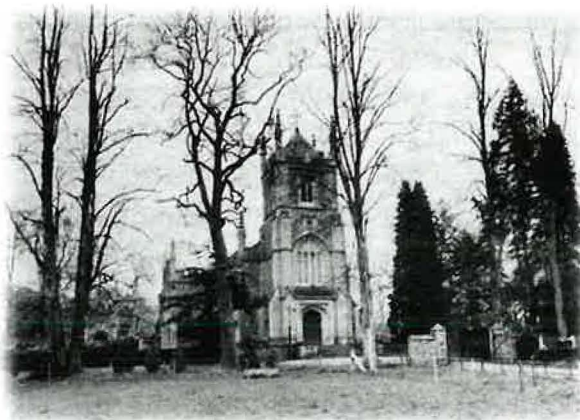
Apostelkirche in Albury

Auf Grund von Meinungsverschiedenheiten über einzelne Auslegungen der Heiligen Schrift und die Berufung neuer Apostel kam es 1863 zum Hamburger Schisma, aus dem die damals so bezeichnete Allgemeine christlich apostolische Mission entstand. Dieses Schisma ist die Geburtsstunde der Neuapostolischen Kirche.