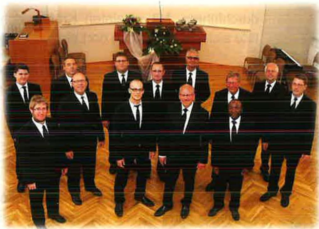
Amtsträger der Gemeinde im Jahr 2012