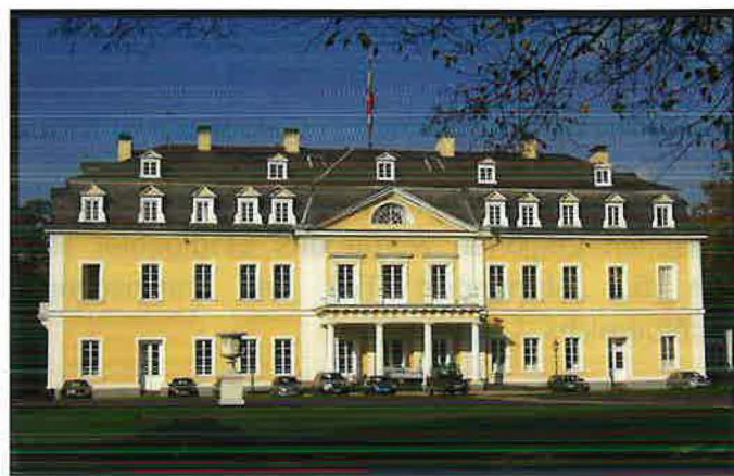
Residenzschloss der Fürsten zu Wied