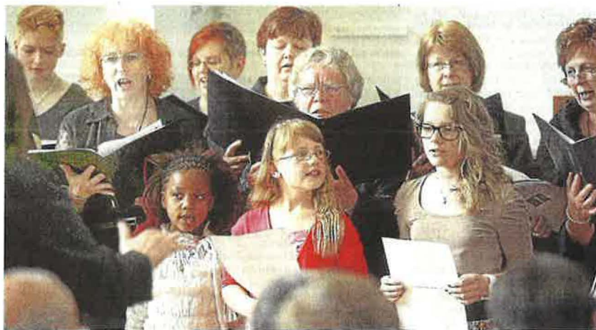
Sie überzeugten mit einem gemeinsamen Auftritt die zahlreich versammelten Gläubigen: der gemischte Chor und der Kinderchor.

Die Gemeinde mit rund 250 Mitgliedern verfügt gleich über mehrere Ensembles: Neben dem gemischten Chor beteiligten sich der Kinderchor, der Seniorenchor und der Männerchor sowie ein Block-