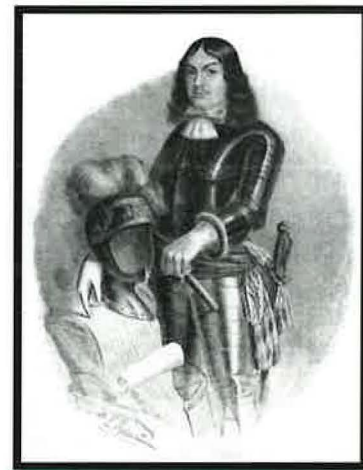
Graf Friedrich zu Wied, Stadtgründer

Die Grafschaft war im Dreißigjährigen Krieg weitgehend verarmt. Von der Teilhabe am Rheinhandel versprach sich Graf Friedrich III. zu