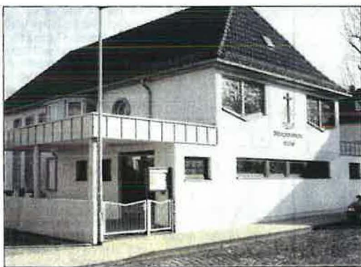
Seit 1953 ist die NAK Neuwied in der Eduard-Verhülsdonk-Straße zuhause.

Zahlreiche Festveranstaltungen im Jubiläumsjahr