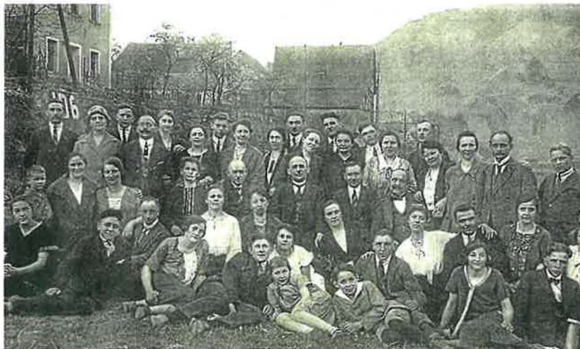
Die Gemeindeglieder der neupostolischen Kirche in Neuwied unternehmen gemeinsam sehr viele Fahrten. Im Jahr 1930 reisten sie unter anderem nach Traben-Trarbach.

Für den Gemeindevangelisten ist das Jubiläumsjahr vor allem ein Grund, um Danke zu sagen. „Wir