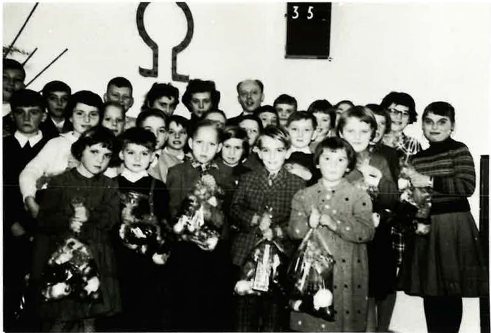
Sonntagsschule um 1956