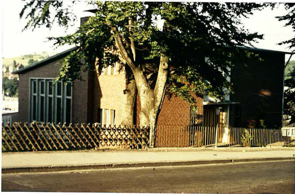
Kirche im Schellerweg

Der Mietvertrag für den "Kranensterz" lief planmäßig bis 1959. So gab Bezirksapostel Schmidt frühzeitig den Auftrag, nach einem Grundstück Ausschau zu halten, auf dem eine eigene Kirche errichtet werden sollte. Das Liegenschaftsamt der Stadt Stolberg wies ein schlecht zu bebauendes Grundstück in Hanglage im Schellerweg aus. Ein großer Vorteil dieses Grundstücks war jedoch seine zentrale und verkehrsgünstige Lage. Das Grundstück wurde zwar 1958 erworben, jedoch verzögerte sich die Bebauung und erst 1961 wurde die Planung des Architekten, des Hirten Rauch aus Düsseldorf bewilligt. Im Frühjahr 1961 konnte mit den Bauarbeiten begonnen werden. So manche Arbeit war in diesem Zusammenhang auch von den Geschwistern zu tun, aber immer fanden sich Hände, die gerne zur Mithilfe bereit waren.