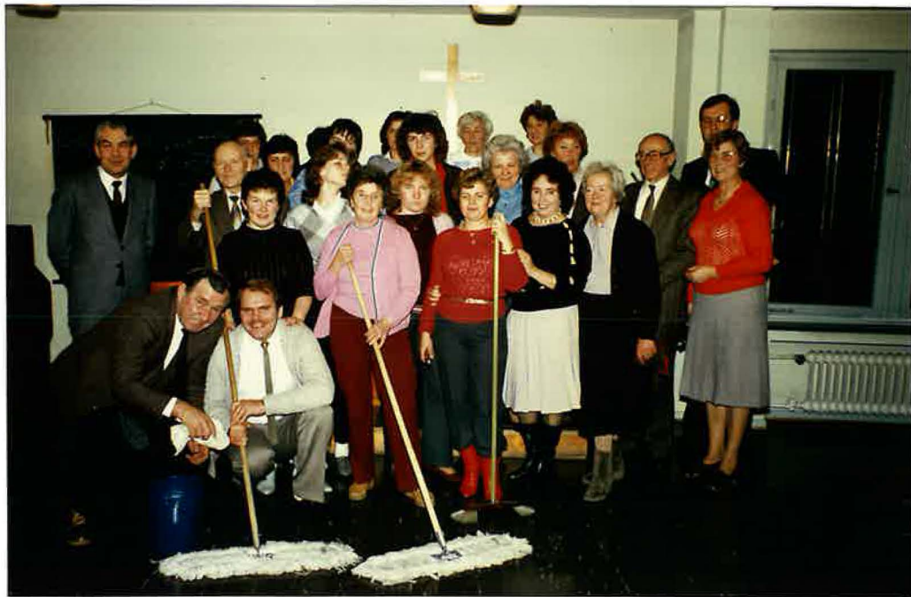
Helfende Hände 1985

Am 13.02.1986 durfte die Gemeinde den Bezirksapostel in der Gemeinde Aachen-Mitte erleben.