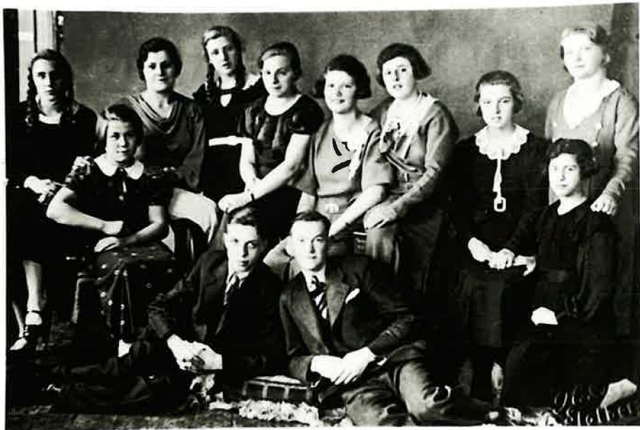
Stolberger Jugend 1937/1938

Diese Verse zeigen die schöne und segensreiche Arbeit der Jugend in der Gemeinde. Aber natürlich gab es auch gemütliche Kaffeerunden oder ausgedehnte Fahrradausflüge im Kreis der jungen Geschwister. Wenn es auch keine überörtlichen Jugendstunden gab, so fand man sich doch das ein und andere mal zu gemeinsamen Singen mit den Jugendlichen der anderen Gemeinden zusammen. Wenn es dann auf dem Heimweg, der wegen fehlender Fahrgelegenheiten bzw. knapper Finanzen zumeist zu Fuß gemacht werden mußte, schon einmal durch dunkle Waldstücke ging, haben sich die Jugendlichen dann auch schon mal "Mut angesungen".