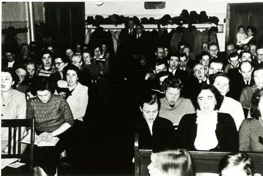
Die Gemeinde in der "Schauburg"

Diese Versammlungstätte diente der Gemeinde Stolberg über 25 Jahre als Ort des Segens, des Friedens und der Ruhe. 1954 mußte sich nach einem neuen Raum umgesehen werden, da die im Hause befindliche Druckerei die Räumlichkeiten selber benötigte, und der Mietvertrag daher gekündigt wurde.