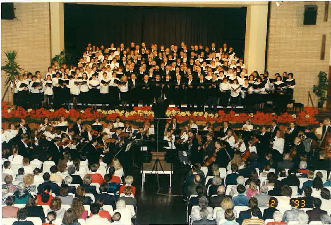
Festliches Adventsingen in der Stolberger Stadthalle

Das Jahr 1993 brachte aber auch noch einen besonderen Höhepunkt in der Öffentlichkeitsarbeit. Am 12.12.1993 fand in der Stolberger Stadthalle ein festliches Adventsingen statt, das durch den Bezirkschor und durch das Orchester gestaltet wurde. Insgesamt nahmen hieran über 1200 Personen, davon fast 400 Gäste, teil.