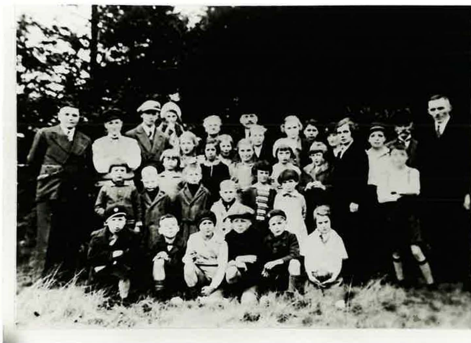
Sonntagsschule um 1935