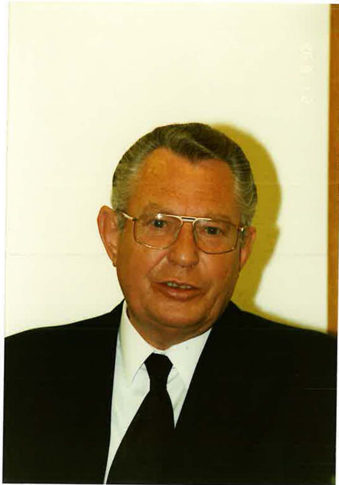
Bezirksapostel am Altar in Stolberg

Das Jahr 1996 war von einer besonderen Steigerung geprägt. Nachdem unser Bischof am 31.01. die Gemeinde besucht hatte, folgte am 16.05. der Besuch unseres Apostels. Den Höhepunkt des Jahres für die Gemeinde brachte aber der 21.08., da an diesem Tag der Bezirksapostel Ehlebracht zum erstenmal in Stolberg diente. Zu diesem Festgottesdienst, in dem uns die Bedeutung der Gottesfurcht und des Segens besonders vor Augen gestellt wurde, waren auch die Gemeinden Aachen-Walheim, Aachen-West und Stolberg-Mausbach eingeladen.