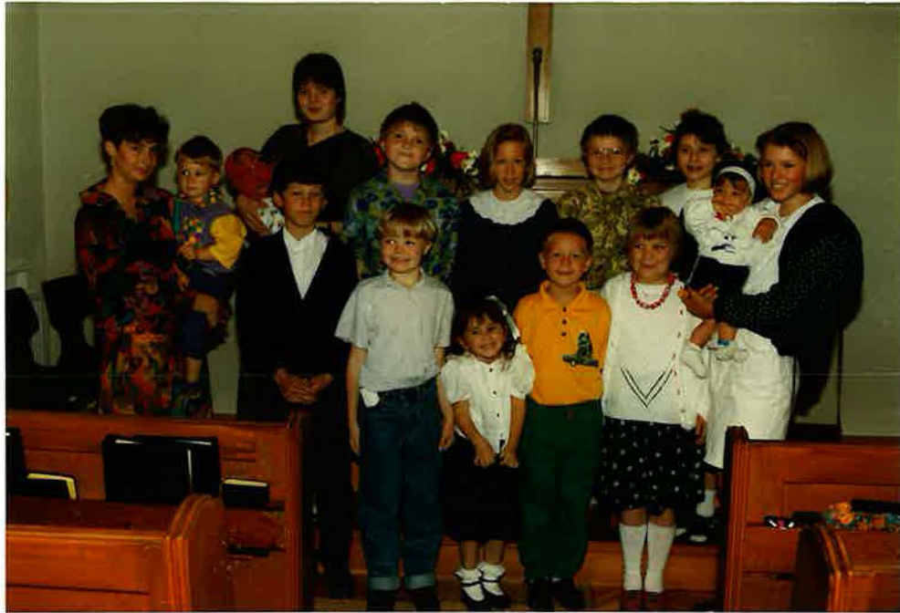
Die Kinder der Gemeinde 1992