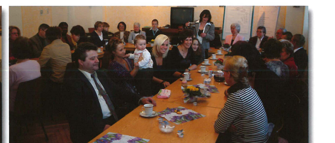
Gemütliches Beisammensein nach dem Gottesdienst