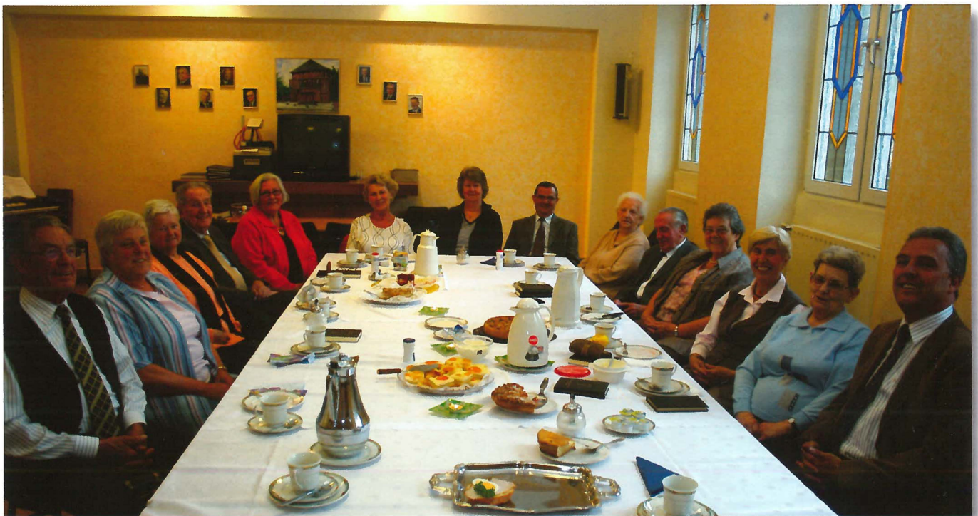
Gemeinschaft im Kreis der Senioren bei Kaffee und Kuchen