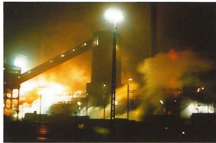
Die Zeche Anna in den neunziger Jahren