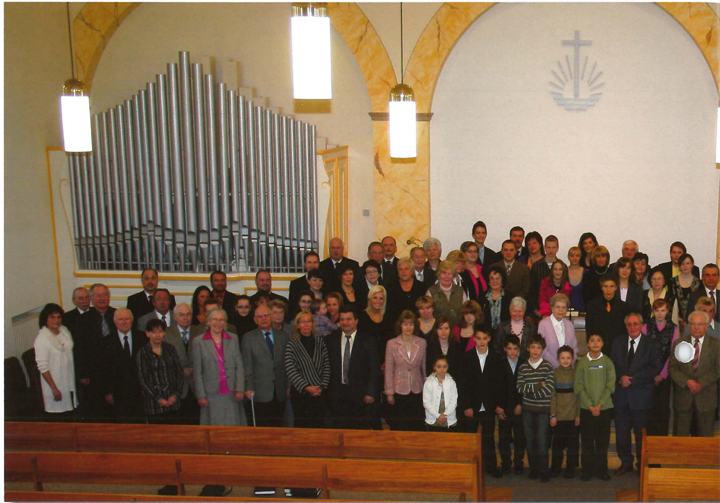
Mitglieder der Alsdorfer Gemeinde 2009