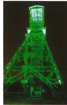
Der Förderer, eines der Alsdorfer Wahrzeichen