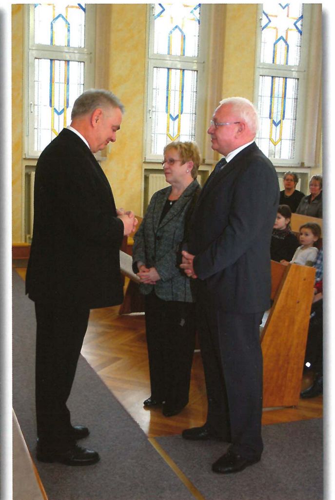
Amtshandlung durch den Bezirksältesten