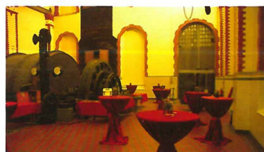
Das ehemalige Fördermaschinenhaus wird heute für kulturelle Veranstaltungen genutzt