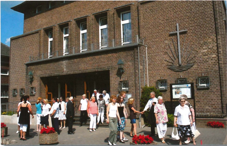
Nach dem Gottesdienst vor dem Kirchengebäude in der Alsdorfer Weinstraße