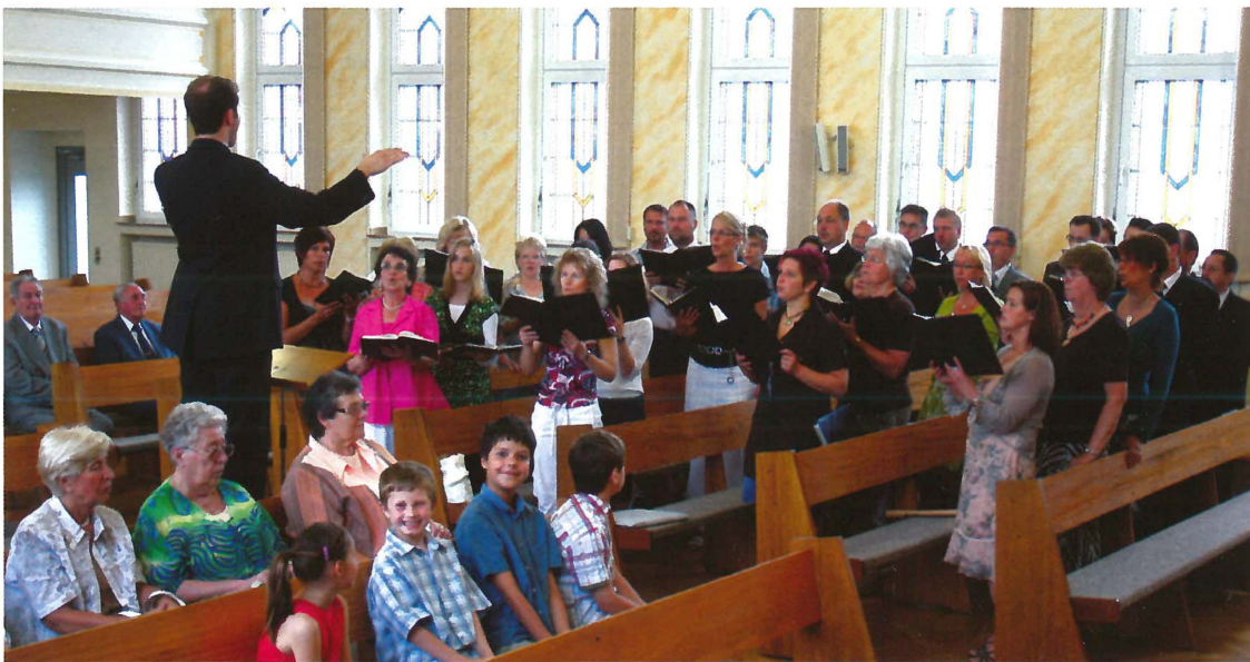
Der gemischte Gemeindechor

Ein besonderes Anliegen ist es unserem Vorsteher, dass sich alle Mitglieder, ob klein oder groß, und auch alle herzlich willkommenen Gäste, in der Neuapostolischen Kirche Gemeinde Alsdorf wohlfühlen.