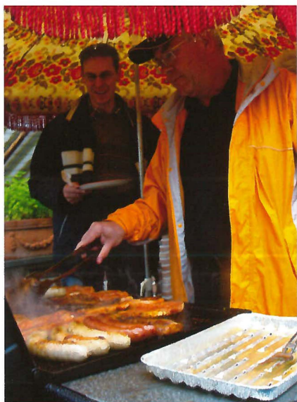
Beim Gemeindefest ist auch für das leibliche Wohl gesorgt