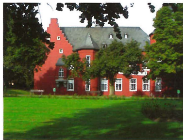
Die Alsdorfer Burg. Die Geschichte der Stadt Alsdorf reicht bis ins Mittelalter zurück. Der Ortsname wird erstmalig 1191 in einer kirchlichen Urkunde erwähnt.