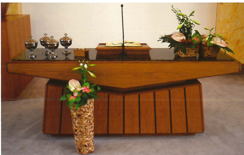
Blick auf den Altar

Vom 16.04.1996 bis zum 03.09.2003 diente Hirte Peter Mathebel der Gemeinde als Vorsteher. Er kam