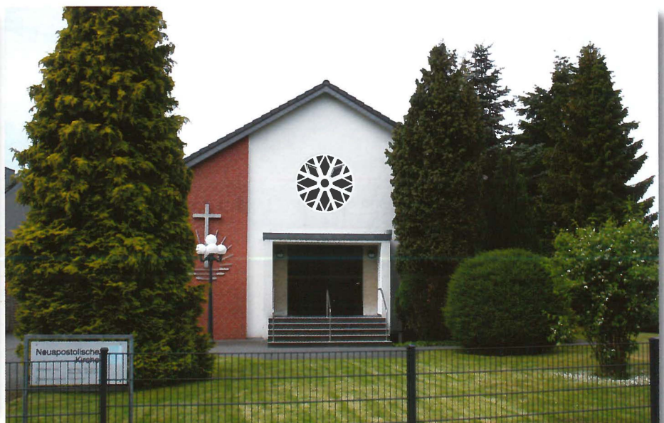
Die Kirche in Alsdorf-Hoengen, Pestalozzistraße