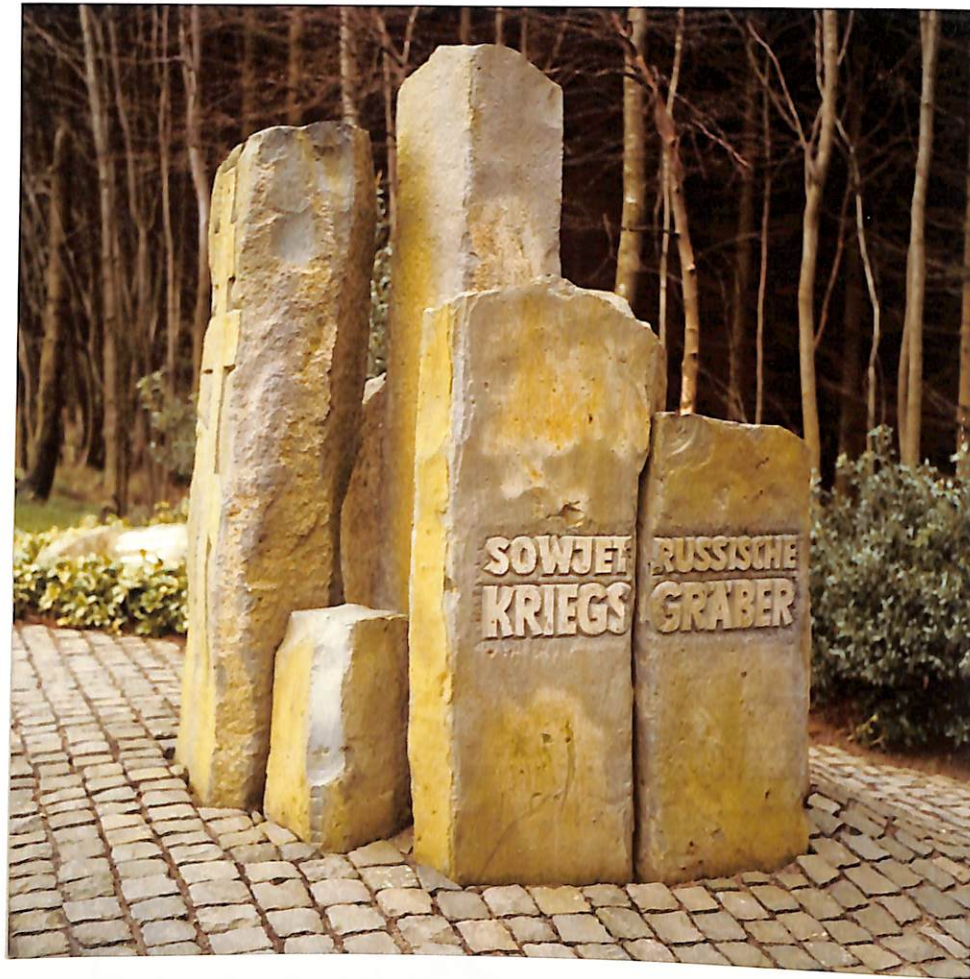
Russischer Friedhof Kesternich

Andere Seuchen forderten ebenfalls viele Menschenleben. 1481 starben in einem halben Jahr 6000 Menschen an Fleckfieber, Ende des 16. Jahrhunderts starben so viele an der Pest, daß es an Menschen fehlte, die Toten zu begraben. Sie wurden schichtweise in Massengräbern beigesetzt. Im 19. Jahrhundert wütete die Cholera in einem Ausmaß, daß ein besonderer Cholera-Friedhof angelegt wurde.