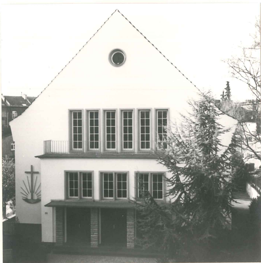
Neuapostolische Kirche in Aachen, Eifelstraße 30

Im Dezember 1952 konnte dann endlich der erste Kirchenneubau für das Stadtgebiet Aachen in der Eifelstraße bezogen werden, der für etwa 500 Gottesdienstteilnehmer Platz bietet.