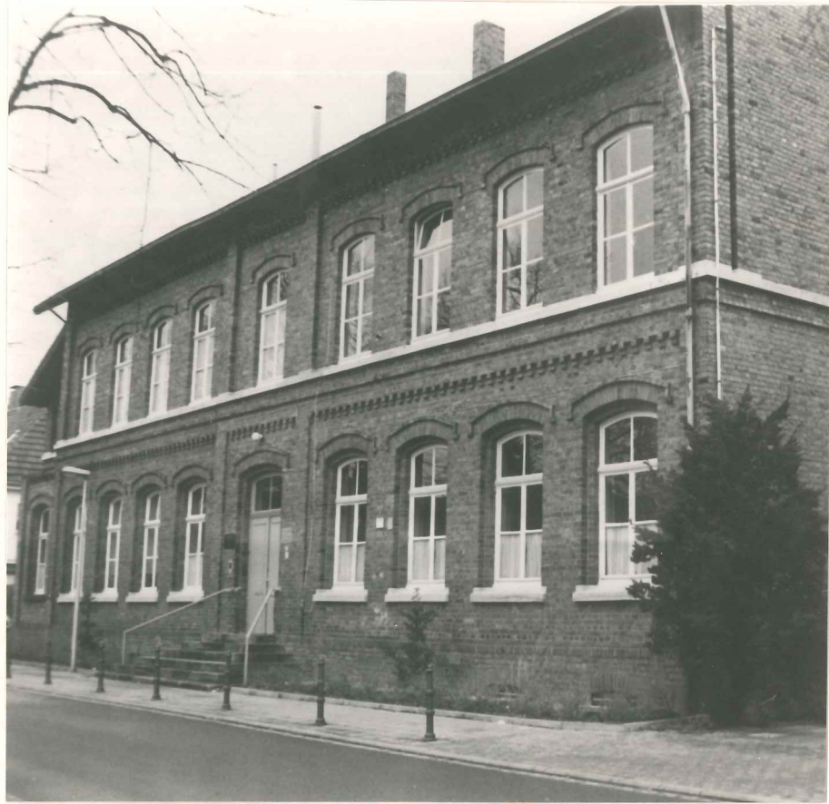
Alte Schule, Josefsallee 6-8

Am 28.10.1982 wurde der erste Gottesdienst in Aachen-Brand gehalten und zwar in einem Klassenzimmer der ehemaligen Volksschule in der Josefsallee. Dieser Raum war der Gemeinde von der Stadt zur Verfügung gestellt worden und diente ihr bis zur Einweihung der neuen Kirche als Versammlungsstätte. Hier erlebten die Geschwister - trotz der ungewöhnlichen äußeren Umstände - viel Freude und Segen und wuchsen zu einer schönen 'Gottesfamilie' zusammen. Wie alle neapostolischen Gemeinden zeichnet sie sich durch ein hohes Maß an Gemeinschaftsinn und Aktivität aus. Neben den Gottesdiensten, die für fremdsprachige Gäste und Gemeindemitglieder in die englische, französische und portugiesische Sprache übersetzt werden können, findet wöchentlich Vorsonntagschule (für 3 - 6 jährige Kinder), Sonntagschule (für 6 - 14 jährige), Religionsunterricht und Chorprobe für den gemischten Chor statt. Die Jugend der Gemeinde trifft sich dreimal im Monat zu einer besonderen Stunde, teilweise allerdings in einem größeren Rahmen. Alle diese Aktivitäten mußten bei der Planung des Kirchenneubaus berücksichtigt werden.