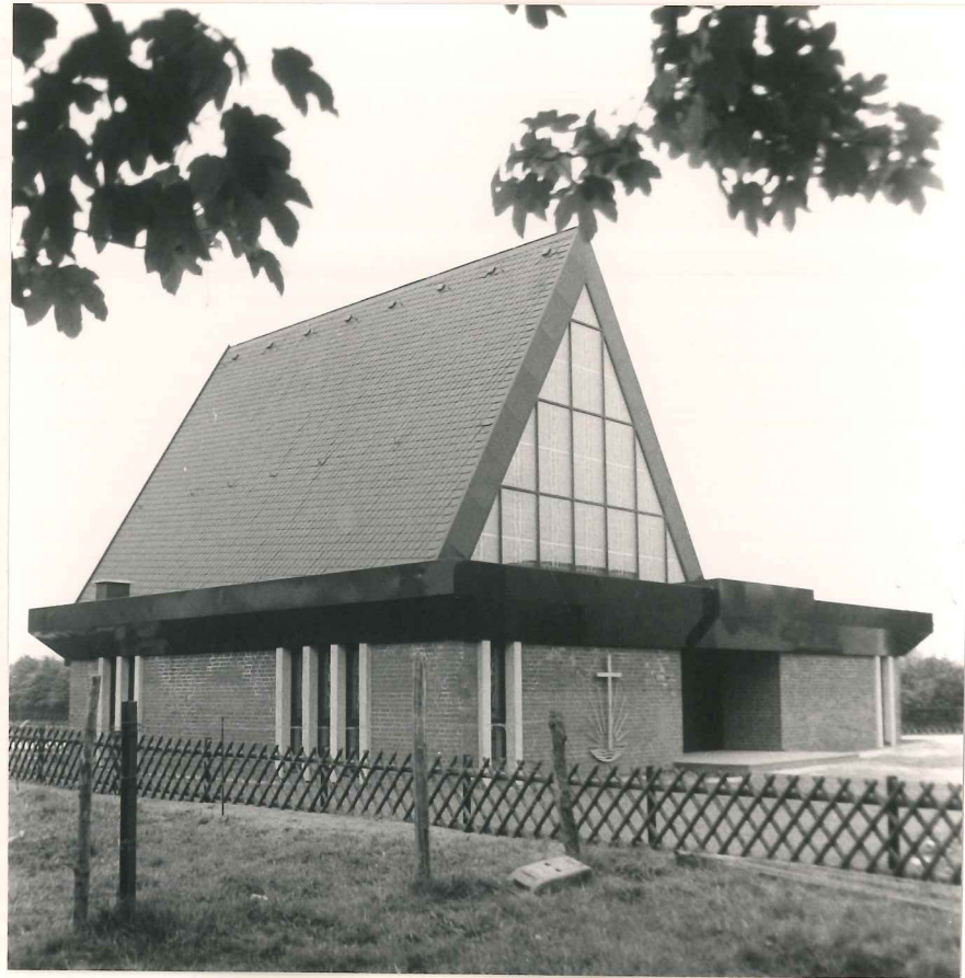
... und nach der Fertigstellung

Auch alle anderen Arbeiten und Aufgaben im Hause Gottes werden von Schwestern und Brüdern unentgeltlich ausgeführt, wie z.B. Chorleitung, Orgelspiel, Übersetzung, Religionsunterricht, Reinigung bzw. Instandhaltung von Kirchengebäuden und Grundstücken. Alles dient der Vollendung des Erlösungswerkes Gottes auf dieser Erde und erfolgt Gott zur Ehre und den Geschwistern zur Freude.