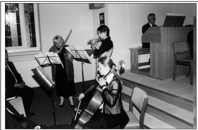
Musikalische Einlage vor dem Gottesdienst