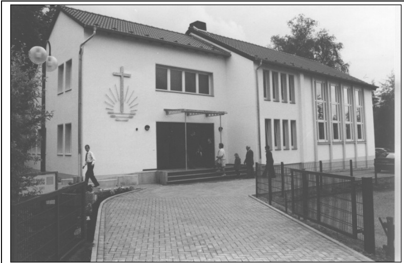
Das neue Kirchengebäude