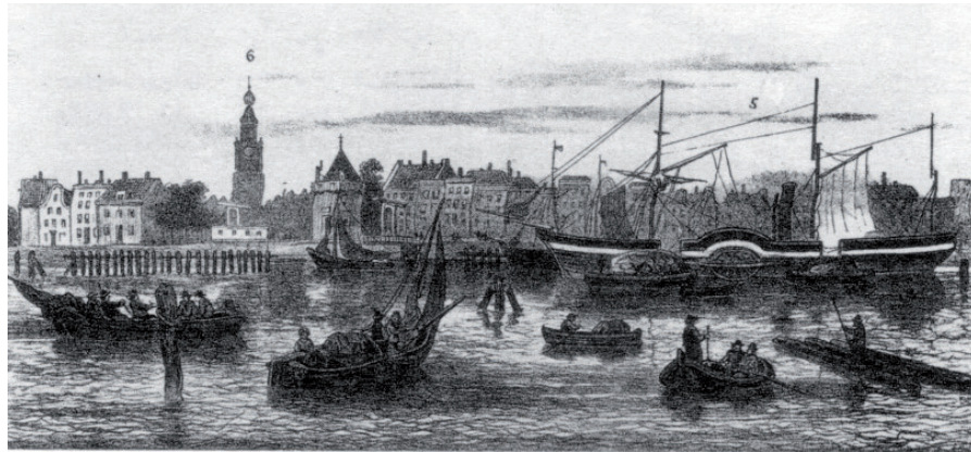
OBEN: Der Hamburger Dampfer in Amsterdam