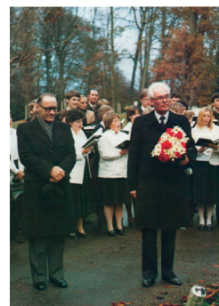
LINKS: Stammapostel Hans Urwyler und Bezirksapostel Gijsbert Pos am Grab von Apostel Schwartz MITTE: Versammlungsstätte Prinseneiland 89 RECHTS: Grabstein

Sechs Wochen darauf wurde der seitherige Bischof und Engel der Gemeinde Hamburg, Friedrich Wilhelm Schwartz, durch Prophet Heinrich Geyer zum Apostel berufen. Im September 1863 wurde ihm durch eine Weissagung das Arbeitsgebiet Niederlande, speziell Amsterdam, zugewiesen.