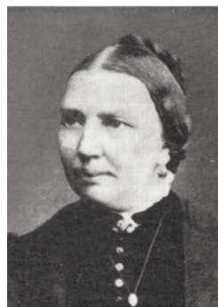
RECHTS: Ehefrau von Apostel Schwartz

Francis Valentine Woodhouse bestätigt und gleichzeitig zum Engel der Gemeinde Hamburg gesetzt wurde.