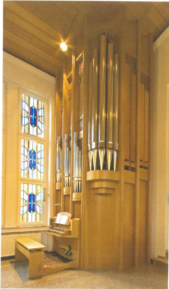
Pfeifenorgel in der Gemeinde Köln - Mülheim