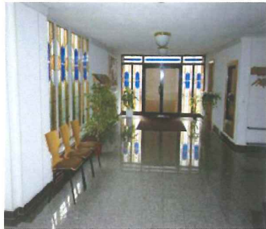
Flur Eingang 2006