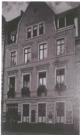
„Zum weißen Pferdchen“

Um vielen der ca. 750 Gläubigen der neuapostolischen Gemeinde Köln – Mülheim die langen Anmarschwege zu ersparen, wurde im August 1928 die Gemeinde Köln – Kalk gegründet und ca. 400 Mülheimer Gemeindemitglieder nach dort überwiesen.