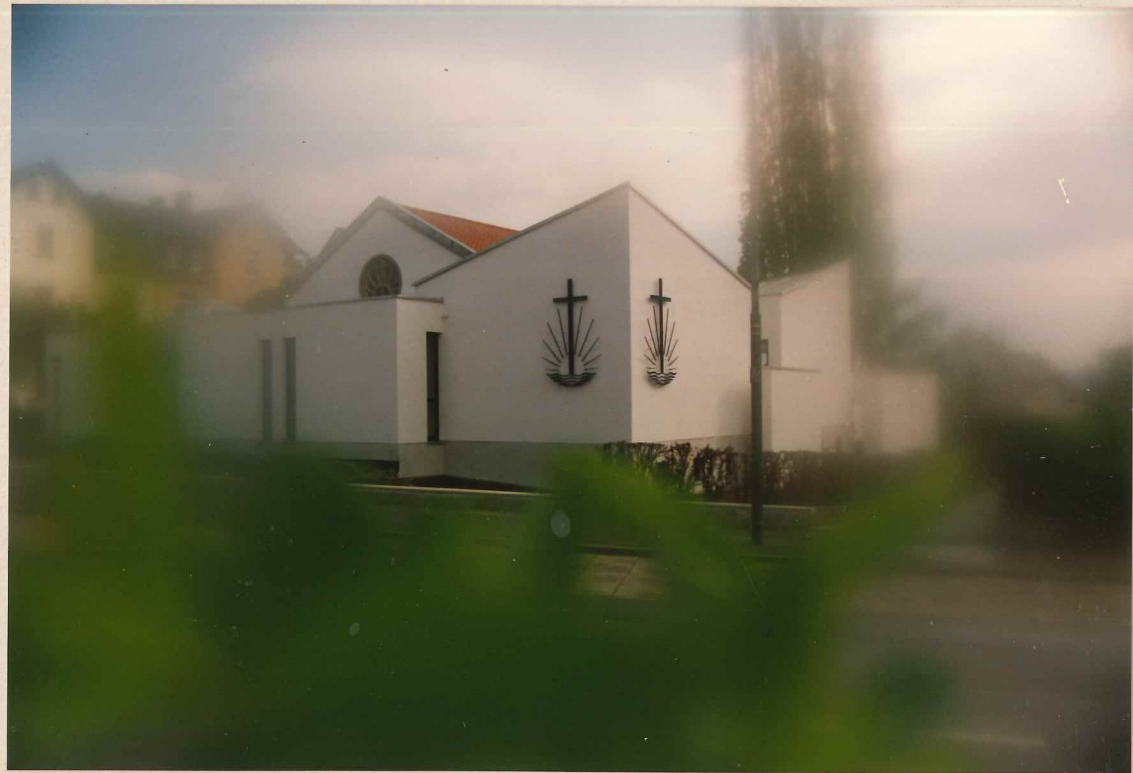
UNSER NEUES GOTTESHAUS