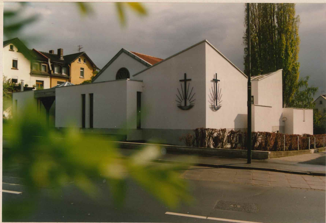
UNSER NEUES GOTTESHAUS