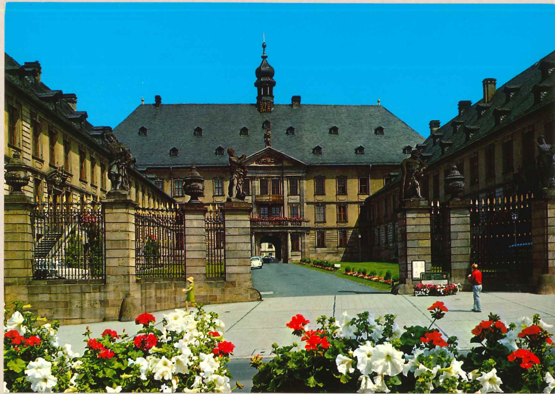
RESIDENZSCHLOSS ZU FULDA