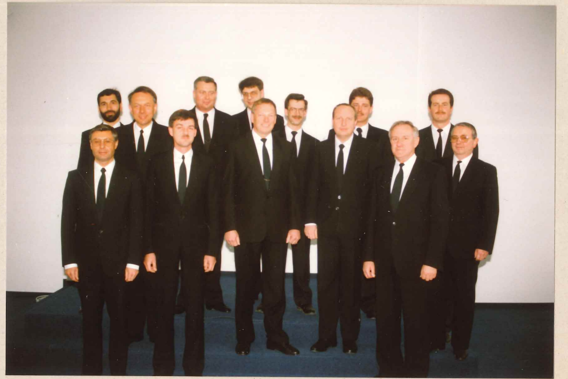
DIE AMTSTRÄGER DER GEMEINDE FULDA