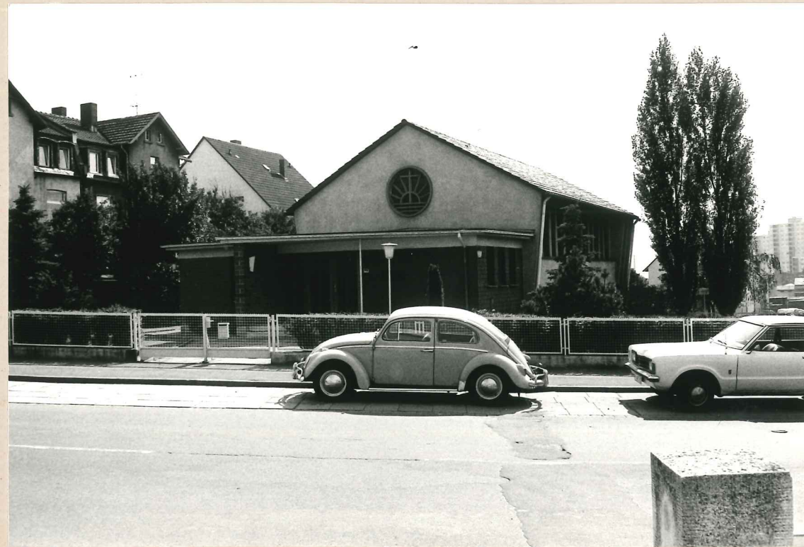
DIE EHEMALIGE KIRCHE