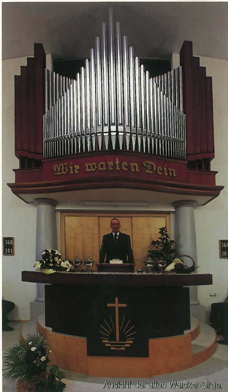
Ansicht der alten Walcker-Orgel