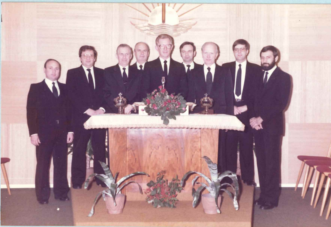
Amtsträger der Gemeinde Differdingen