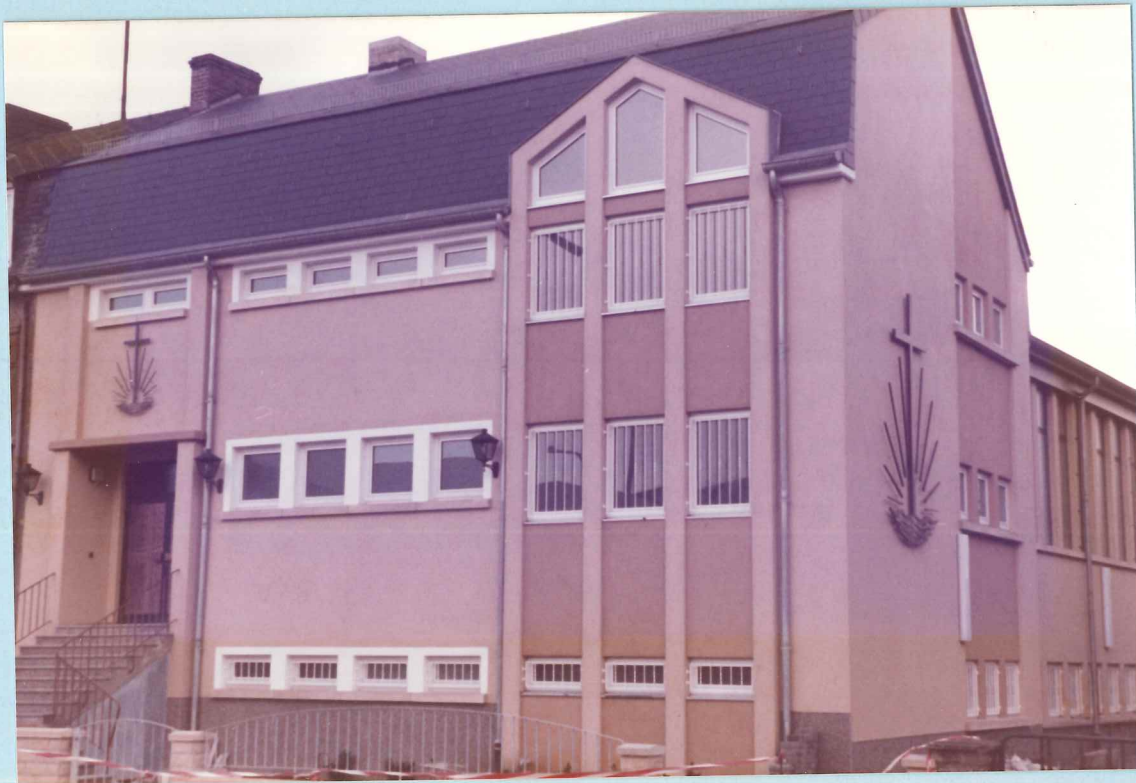
Aussenansicht der neuen Kirche in Esch/Alzette

Diesem großen und nahen Tag sehen die 258 Gotteskinder der Gemeinde Esch/Alzette mit ihren 13 Amtsträgern und freudig und gläubig entgegen.