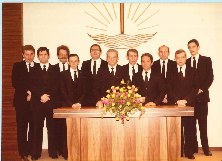
Amtsträger der Gemeinde Esch/Alzette