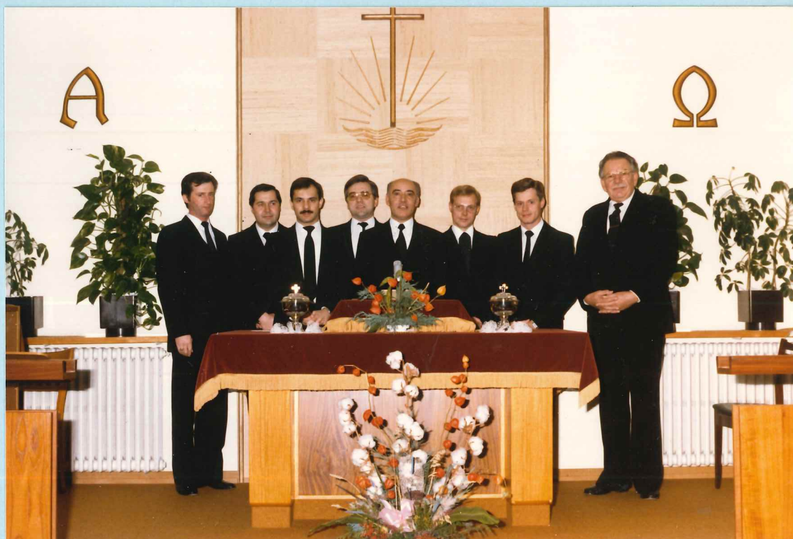
Amtsträger der Gemeinde Rodingen