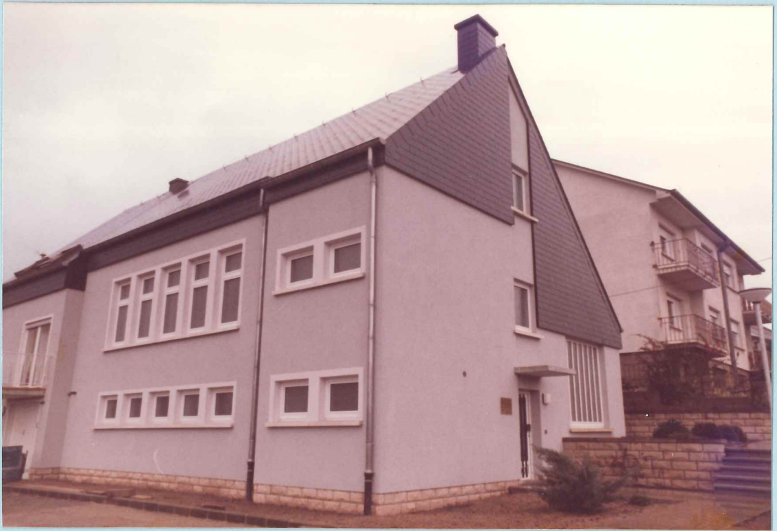
Aussenansicht unserer Kirche in Mersch