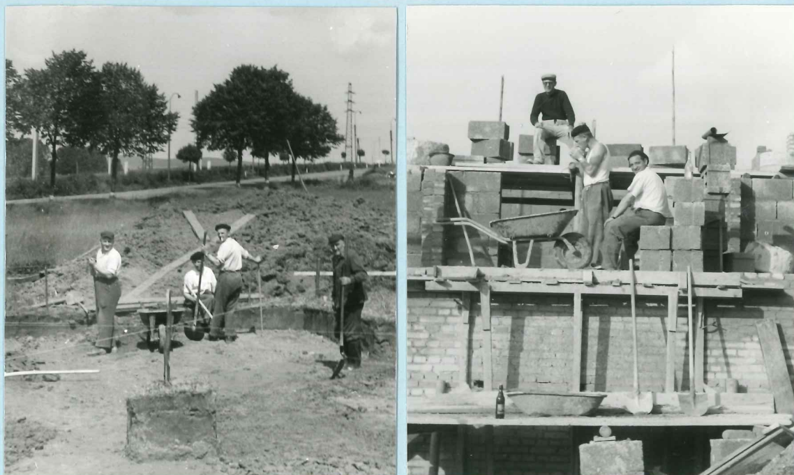
Brüder aus Rodingen errichten unter sachkundiger Anleitung die heutige Kirche (1959-1960)