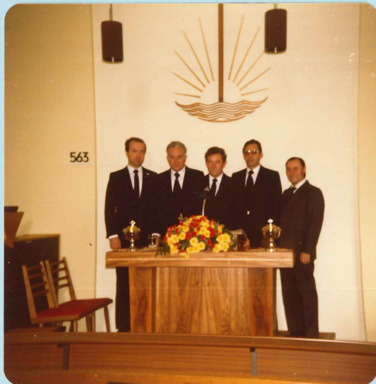
Amtsträger der Gemeinde Mersch