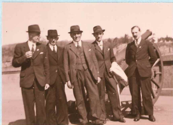
Bild links: Inzwischen heimgegangene Amtsbrüder der Gemeinde Differdingen - anno 1939