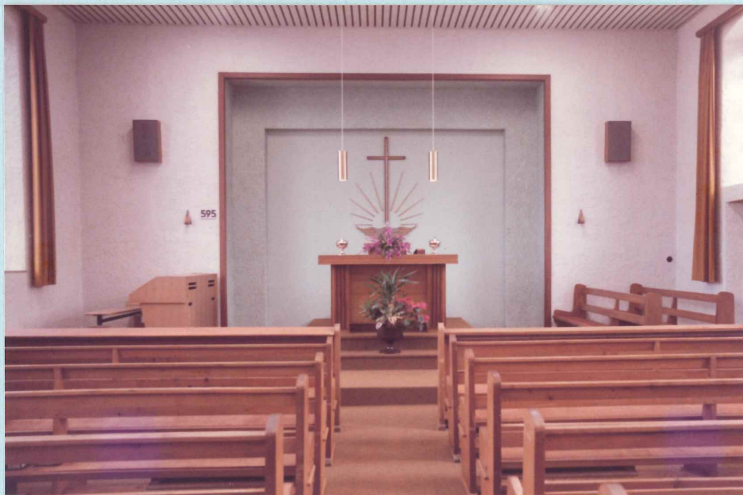
Innenansicht unserer Kirche in Düdelingen

Heute sind es 117 Seelen, die von 7 Amtsträgern gepflegt werden.