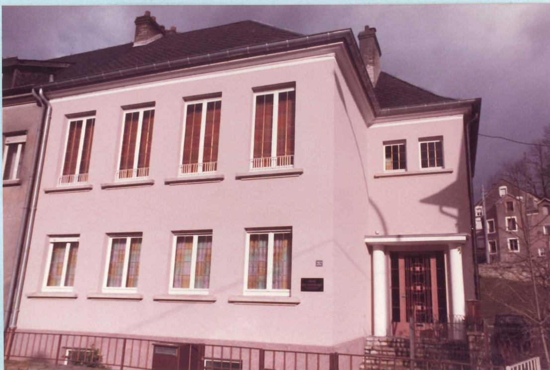
Aussenansicht unserer Kirche Luxemburg-Stadt

Die Gemeinde zählt heute 239 Seelen, die von 12 Amtsträgern umsorgt werden.