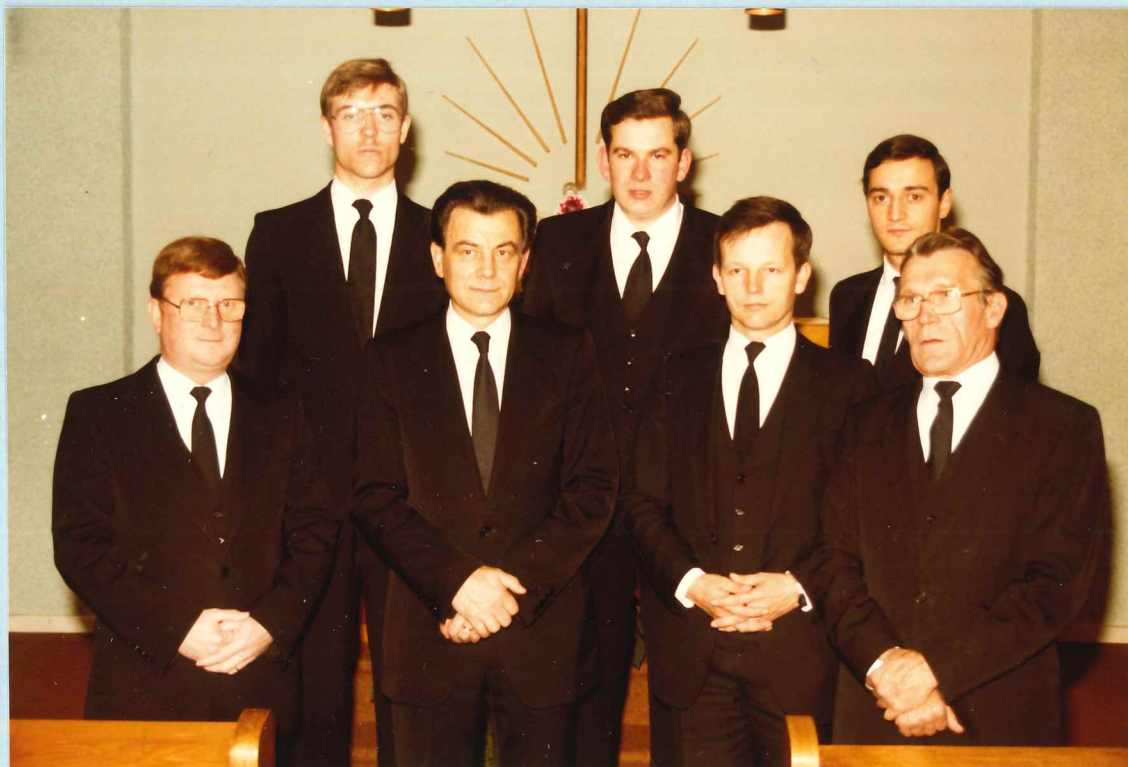
Amtsträger der Gemeinde Düdelingen