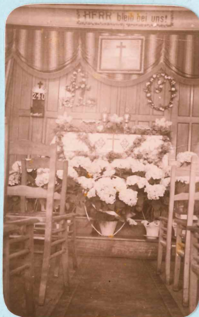
Bild oben: Altaransicht des ersten Kirchenlokals in der Dicks-Lentz-strasse, 22