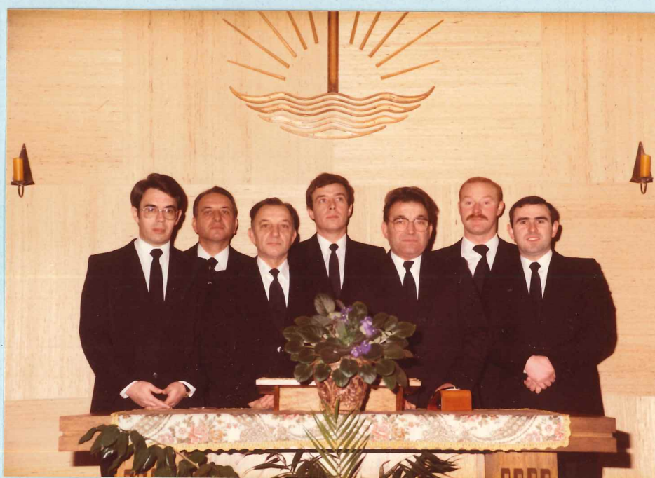
Amtsträger der Gemeinde Beles