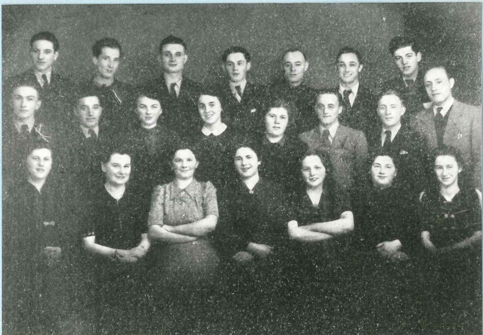
Die Jugend der Gemeinde Esch/Alzette im Jahr 1946

Aber auch in den folgenden Jahren wußte der liebe Gott die Opfertreue seiner Kinder zu segnen. In kurzer Zeit nahm die Gemeinde einen gewaltigen Aufschwung und umfaßte am 31. Dezember 1938 ungefähr 200 Seelen, von denen im Jahr 1938 allein 76 versiegelt wurden. Infolge der auftretenden Arbeitslosigkeit mußten jedoch viele Geschwister auswandern, so daß sich die Seelenzahl wieder beträchtlich verringerte.