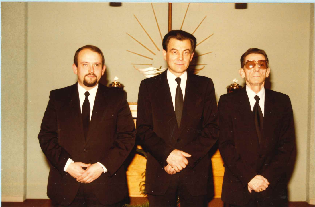
Amtsträger der Gemeinde Kayl

Die Gemeinde weist augenblicklich einen Bestand von 40 Seelen, davon 3 Amtsträger, auf.