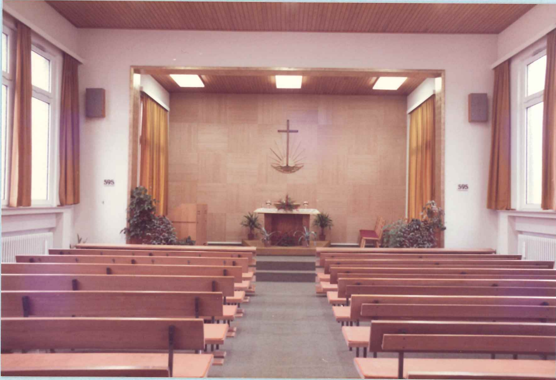
Innenansicht unserer Kirche in Differdingen