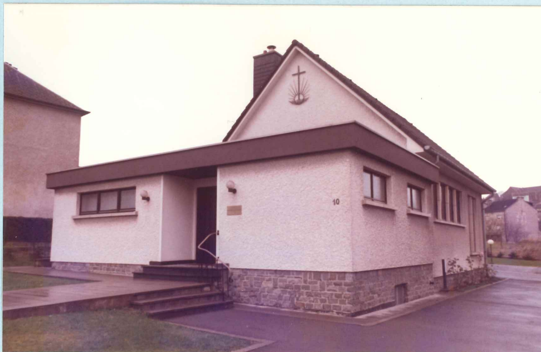
Unsere Kirche in Beles