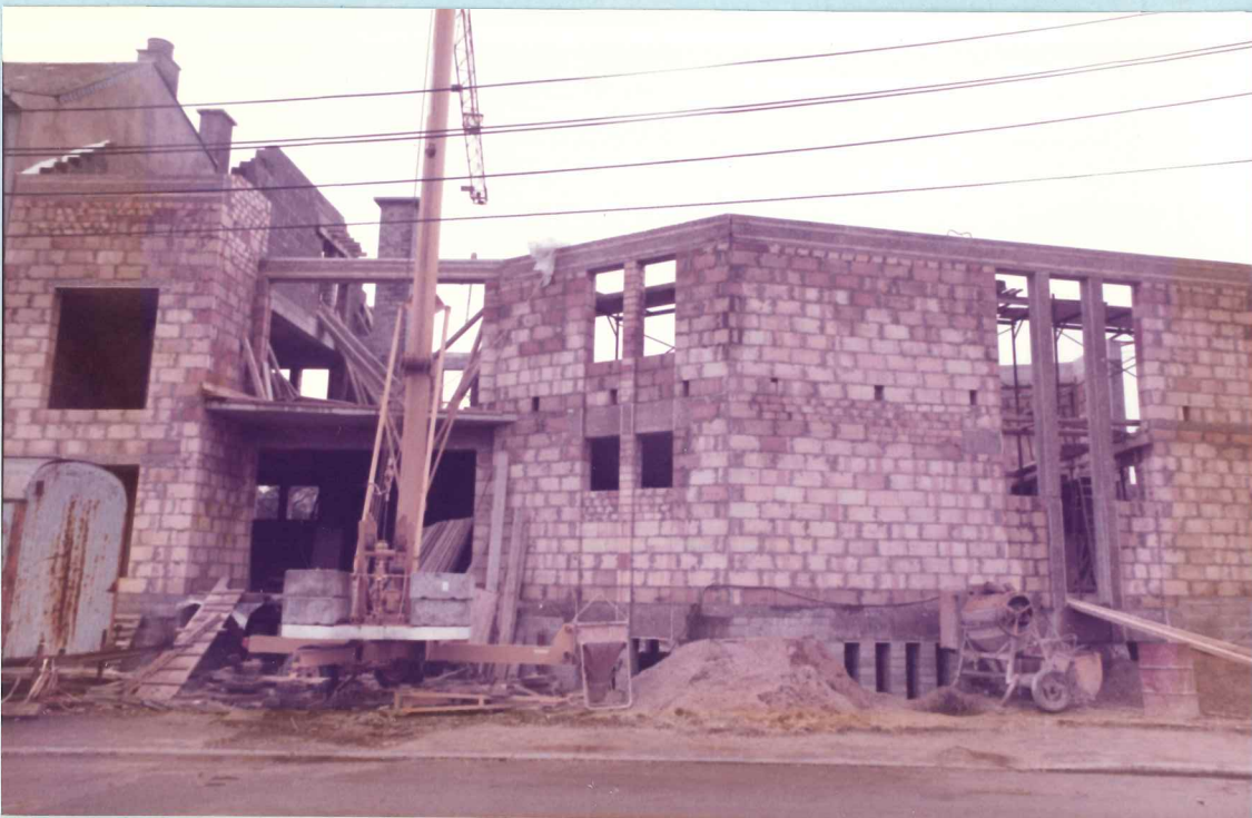
Die neue Kirche im Rohbau - Bildaufnahme vom 24.11.1984