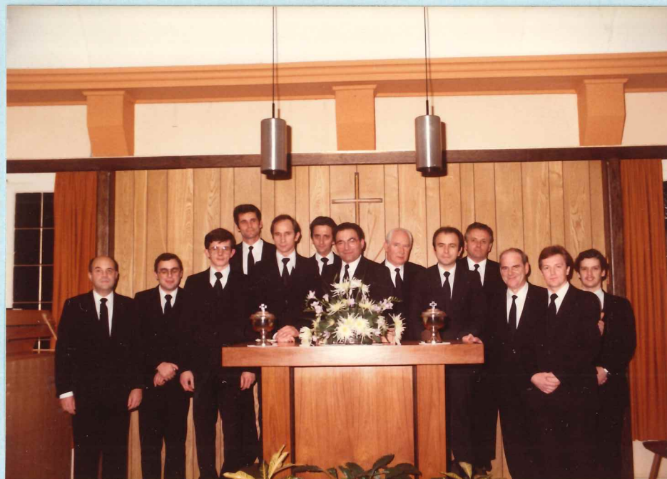
Amtsträger der Gemeinde Luxemburg-Stadt