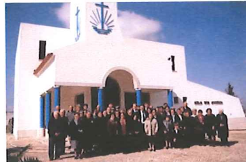
Aldeia dos Palheiros