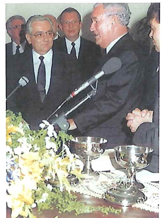
Hochliches Dank an das Stamm...

und dem Gebet las der Stammapostel das Textwort aus Hebräer 10, 37 und 38 vor: