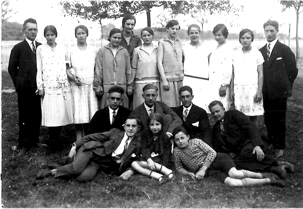
links Br. R. Pieper