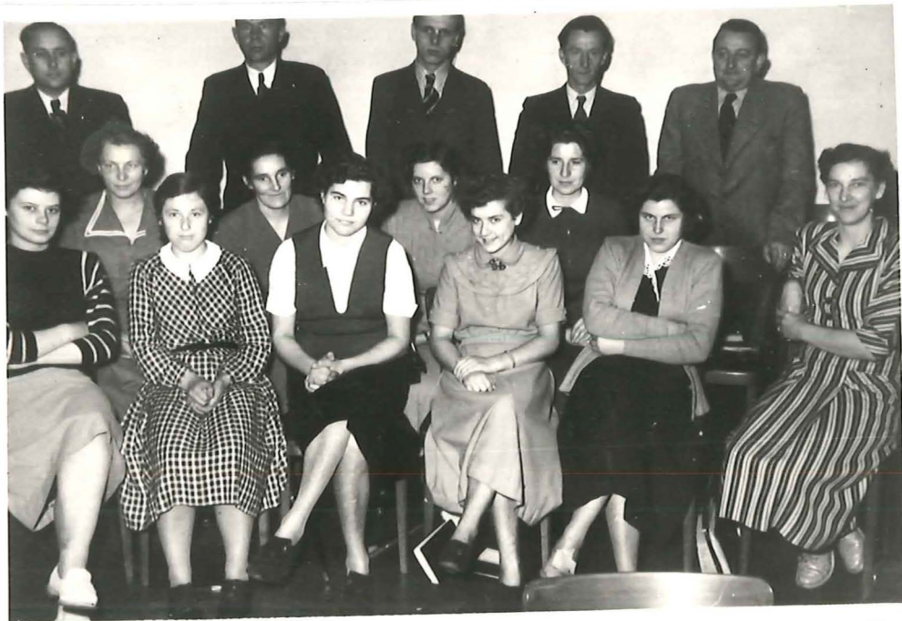
Gemischter-Chor der Gemeinde Münster in der Martinischule