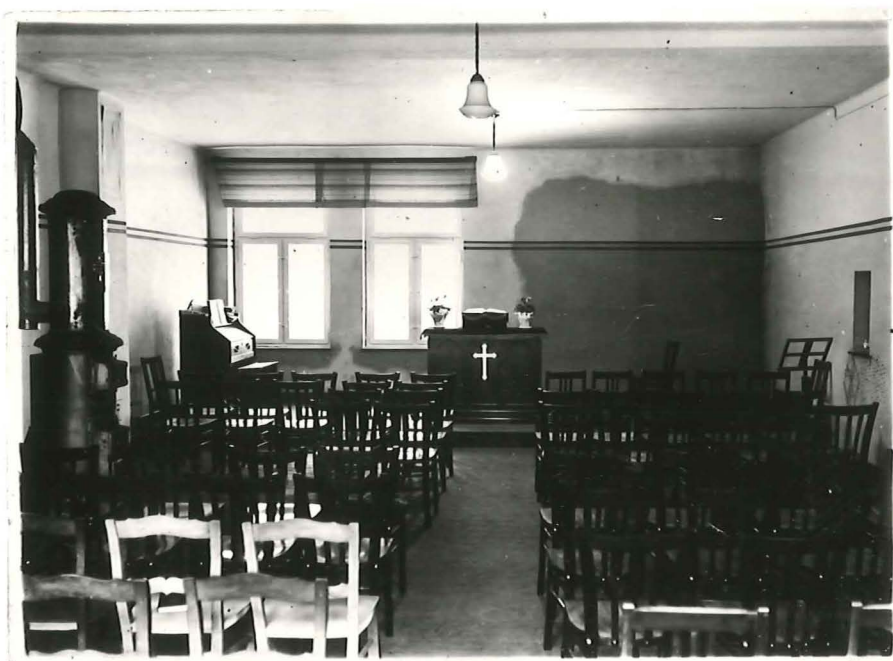
Versammlungsstätte am Hansaring