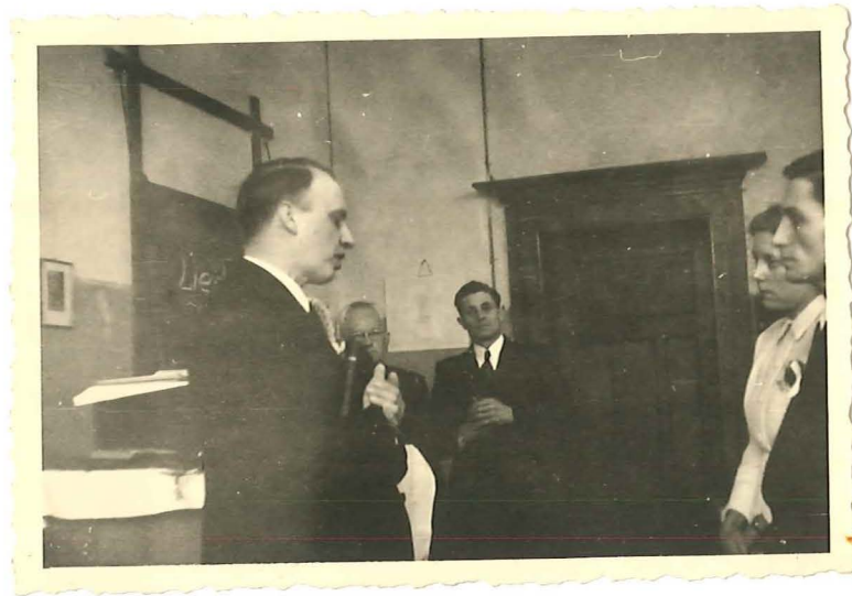
Hochzeit der Geschwister Lich in der Martinischule