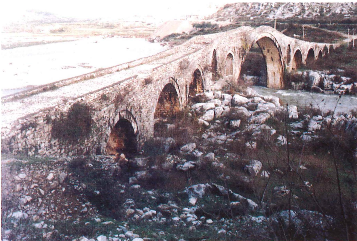
Brücke von Mesi über den Kiri bei Shkodra (18. Jh.)