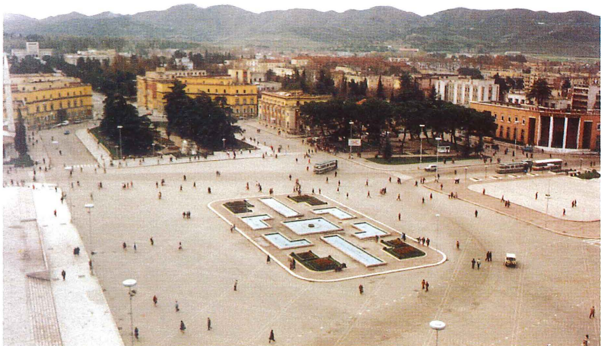
Der Skanderbeg-Platz im Zentrum Tiranas, November 1990

Im November 1990 war es den beiden Aposteln Klaus Dieter König und Bernd Klippert erstmals möglich, als Touristen in das Land einzureisen und sich einen ersten Eindruck zu verschaffen. In ihrem eigentlichen Auftrag konnten sie jedoch nicht tätig werden, denn damals war das Verbot religiöser Betätigung noch gültig.