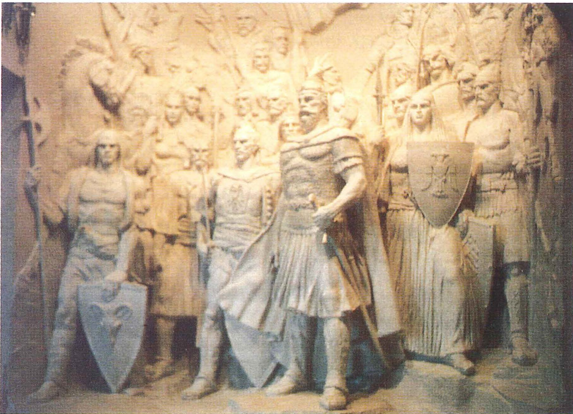
Skanderbeg einigt die albanischen Fürsten in der „Liga von Lezha“, 1444