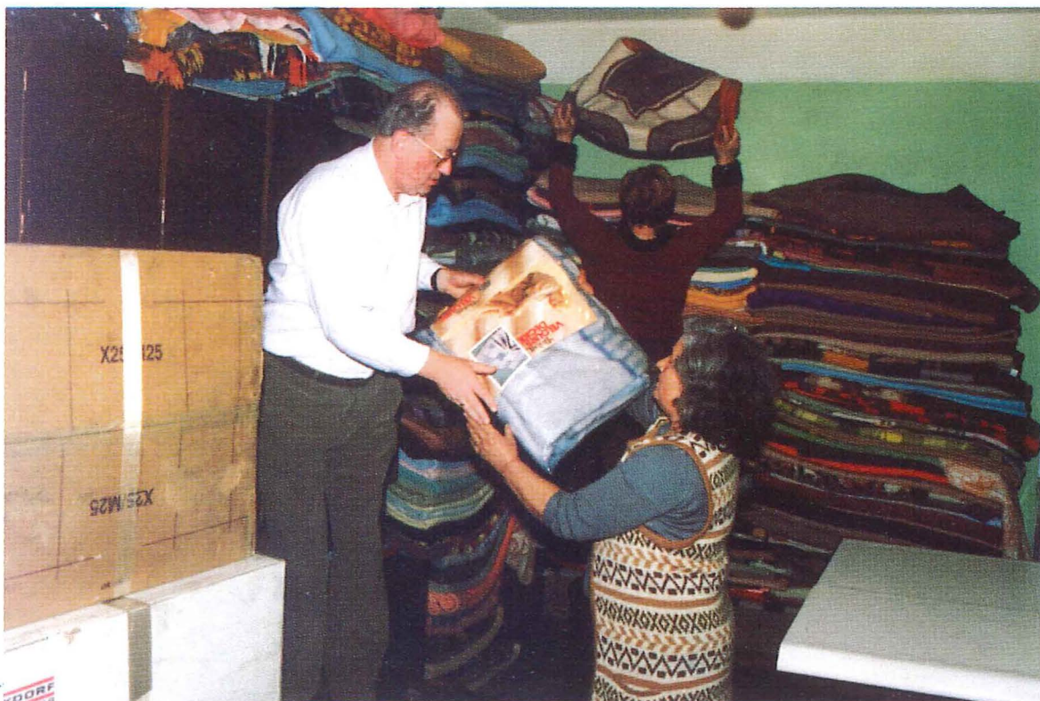
Hilfssendung von Wolldecken, Winter 1991/92