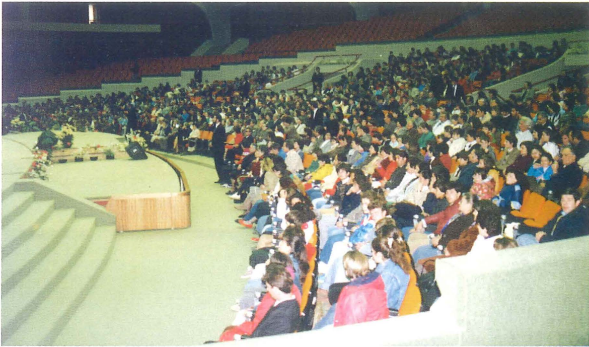
Gottesdienst am 21. November 1993 im Kongresszentrum in Tirana

In Tirana besteht schon seit der Anfangszeit ein gemischter Chor, während in den übrigen Gemeinden mit Keyboard-Begleitung Gemeindegesang stattfindet.