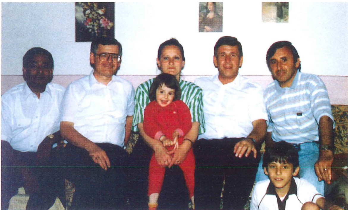
Familienbesuch in Tirana

Fast von Anfang an findet während des Gottesdienstes in Tirana Kindergottesdienst in einem separaten Raum statt. Mit Begeisterung sind die Kleinen bei der Sache, die Grundzüge der Biblischen Geschichte zu lernen und unsere Lieder zu singen.