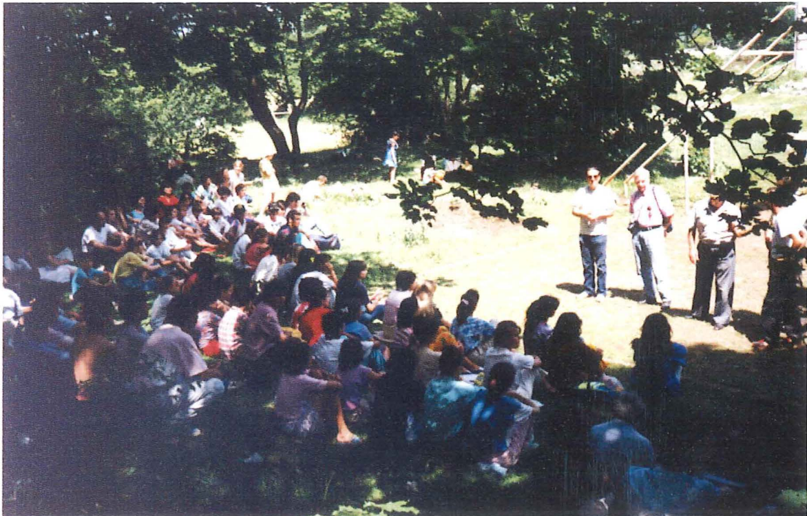
Jugendausflug ins Dajti-Gebirge, 11. Juli 1992

Am Samstag, dem 11. Juli 1992 fand zum ersten Mal in der erst zehn Monate alten Gemeinde Tirana ein Ausflug der Jugend statt. Mit drei Reisebussen machten sich die 122 Jugendlichen mit einigen Begleitern am frühen Morgen auf den Weg ins östlich von Tirana gelegene Dajti-Gebirge.