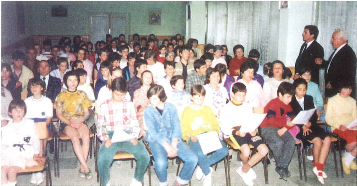
Gemeinde Berat Mai 1994

Im Frühjahr 1994 fanden in Shkodra, im Norden, und in Korça, im Südosten des Landes, Gäste- und Informationsstunden statt. Es gab viele interessierte Gäste, so daß ab Mai dort regelmäßig Gottesdienste abgehalten werden.