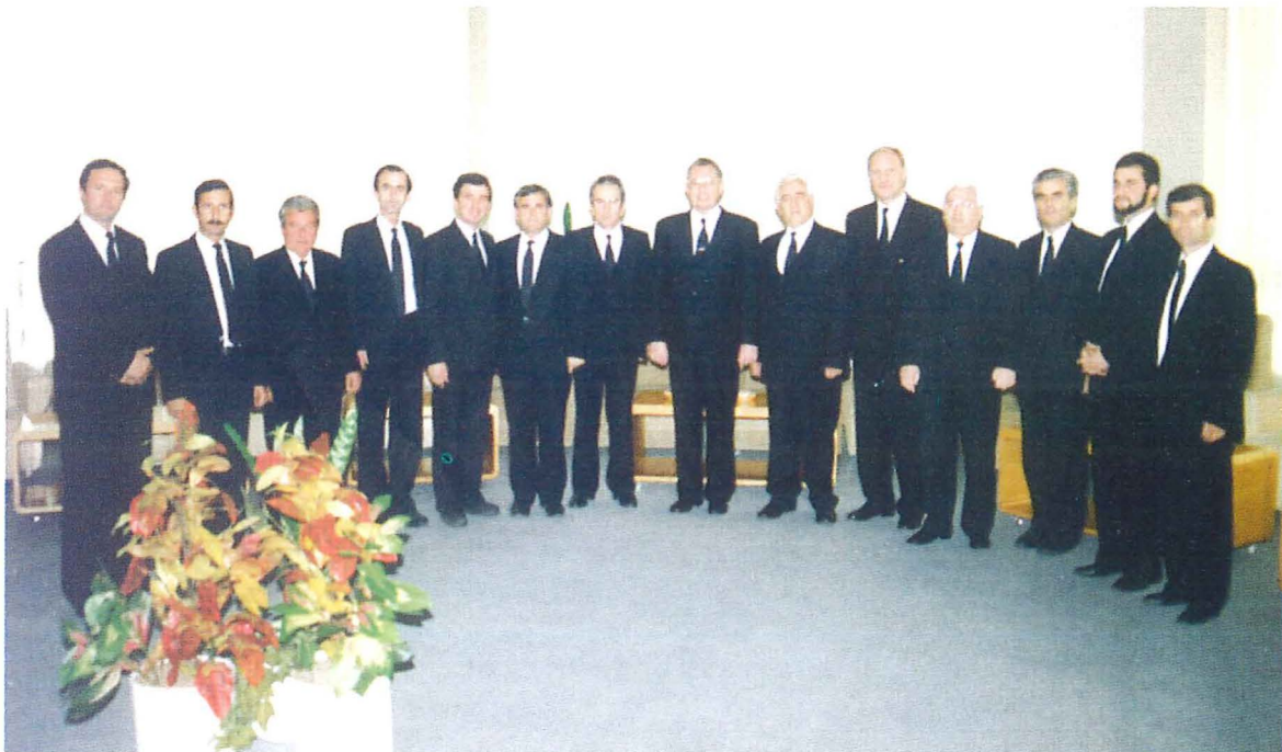
Im Kreise der priesterlichen Ämter

Seit geraumer Zeit versammeln sich die Jugendlichen - oft im größeren Kreis mehrerer Gemeinden - zu Jugendstunden, die sich als sehr segensreich erweisen.