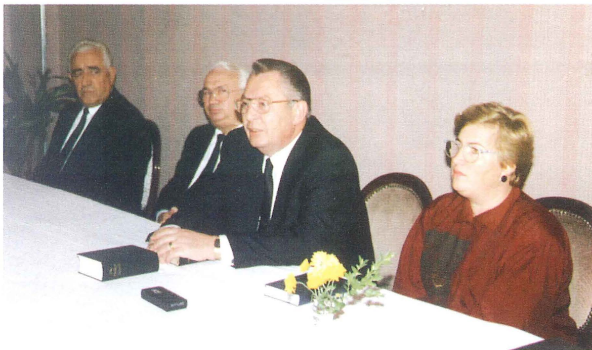
Ämterstunde im November 1993 in Tirana

Mit der zunehmenden Zahl von albanischen priesterlichen Ämtern werden diese mehr und mehr auch zur Durchführung der Gottesdienste herangezogen.