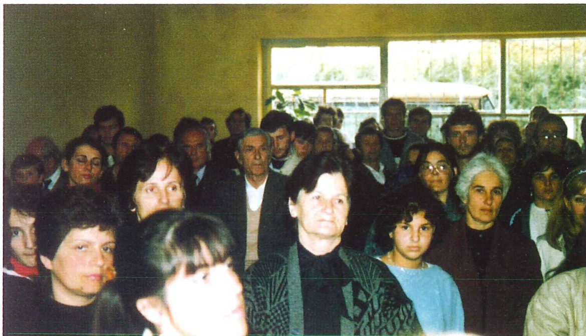
Einer der ersten Gottesdienste in Tirana, November 1991

Der Vater eines in Nordrhein-Westfalen lebenden albanischen Asylbewerbers, der in Dortmund Kontakt zur Neuapostolischen Kirche gefunden hatte, erklärte sich bereit, die Einladung und Unterbringung der deutschen Gäste zu übernehmen. Doch noch während der Reisevorbereitungen widerrief jener Mann seine Zusage. Sein Bruder sah in dieser Absage jedoch eine Verletzung der traditionellen albanischen Gastfreundschaft und erklärte sich bereit, statt dessen als Gastgeber einzuspringen und die ihm unbekanntem Männer aufzunehmen, obwohl er mit seiner fünfköpfigen Familie nur über eine Dreieinhalb-Zimmer-Wohnung verfügte.