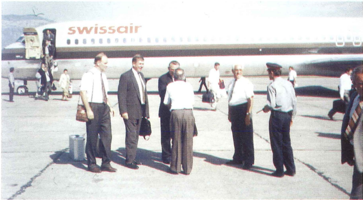
Ankunft des Bezirksapostels Ehlebracht in Tirana, 10. September 1992

ten 116 Seelen das Siegel der Gotteskindschaft empfangen; sieben Brüder waren als Amtsträger gesetzt worden.