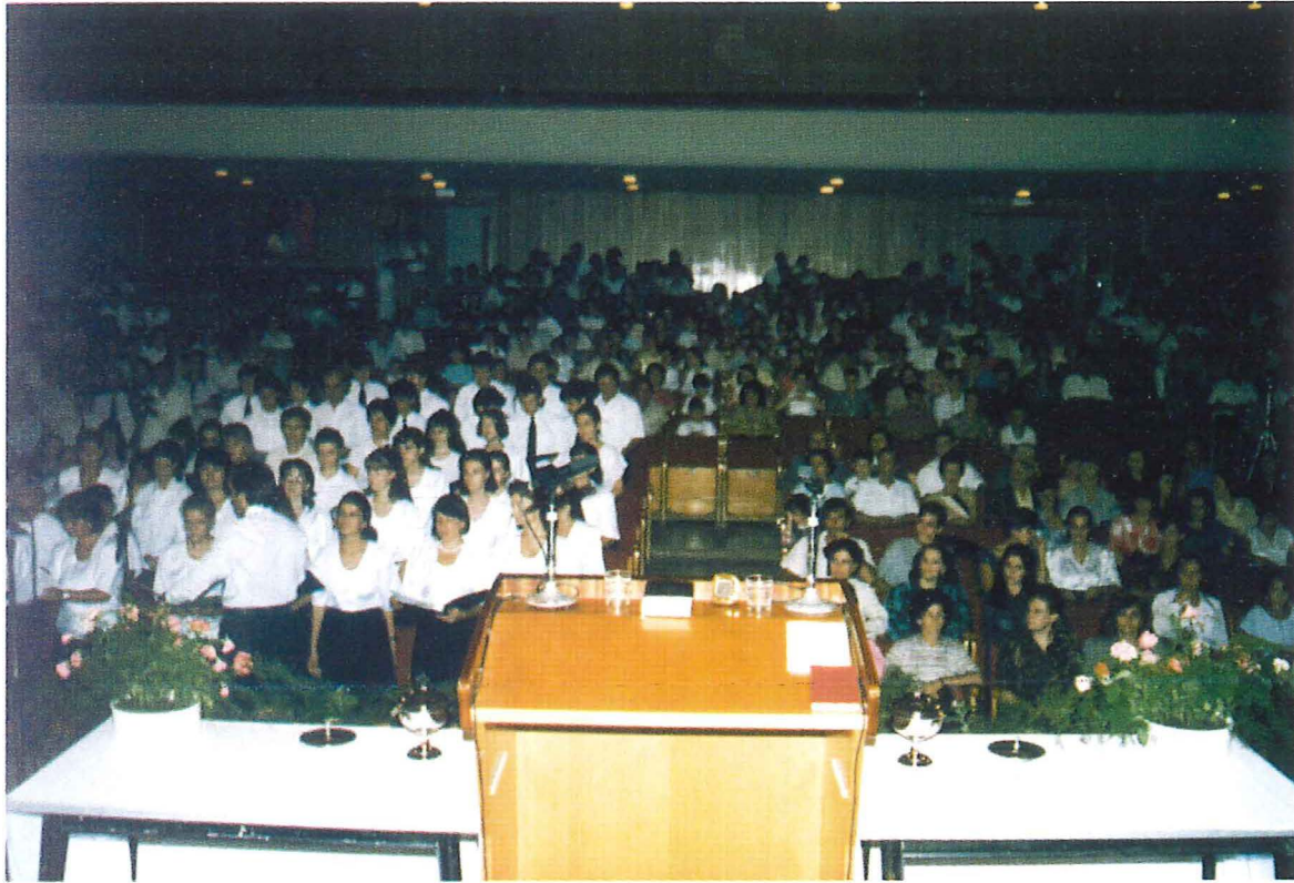
Festgottesdienst in Tirana, 13. September 1992

Für den Abend hatten sich alle Amtsträger Albaniens zu einem Gottesdienst mit dem Bezirksapostel eingefunden, den dieser unter das Wort aus 1. Korinther 12, 4-7 stellte: „Es sind mancherlei Gaben, aber es ist ein Geist ...“ Dankbar nahmen die Brüder die Einladung zum gemeinsamen Abendessen im Anschluß an die Segensstunde an. Bei lebhaftem Gedankenaustausch und anregenden Gesprächen klang der Tag aus.