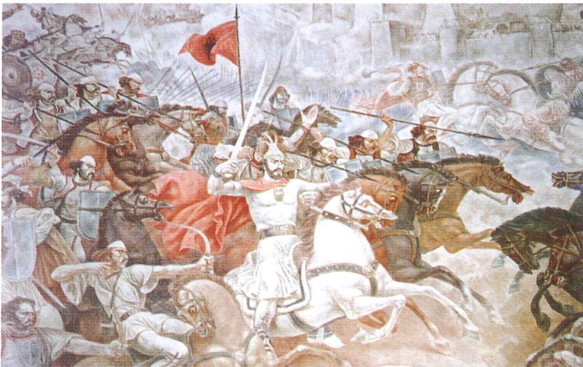
Der albanische Nationalheld Georg Castriota, genannt Skanderbeg, im Kampf gegen die Türken (Wandgemälde)