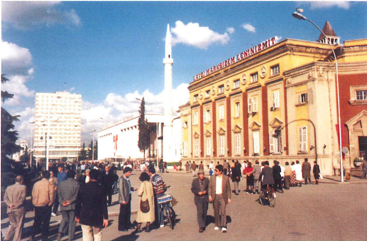
Im Zentrum Tiranas