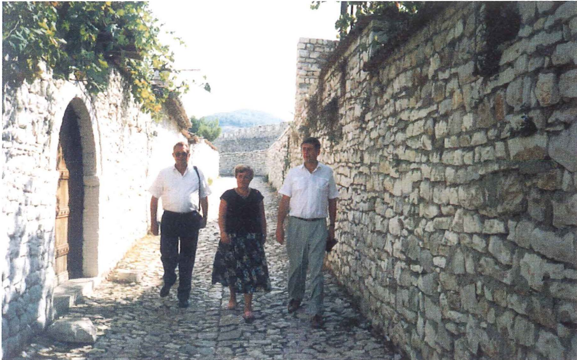
In der Festung Berat

Schon zur Tradition geworden ist der jährliche Jugendausflug, der im Juli 1992 das erste Mal stattfand und über 120 Jugendliche ins Dajti-Gebirge führte. In 1993 und 1994 wurde der Adria-Strand gewählt, im Juli dieses Jahres verbrachten 360 Jugendliche aus allen Gemeinden einen schönen Tag am Strand von Divjaka.