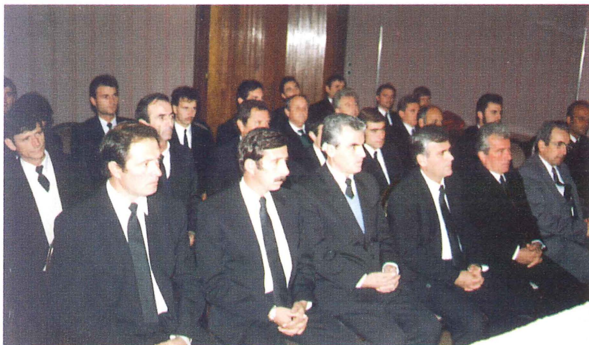
Ämterstunde im November 1993 in Tirana