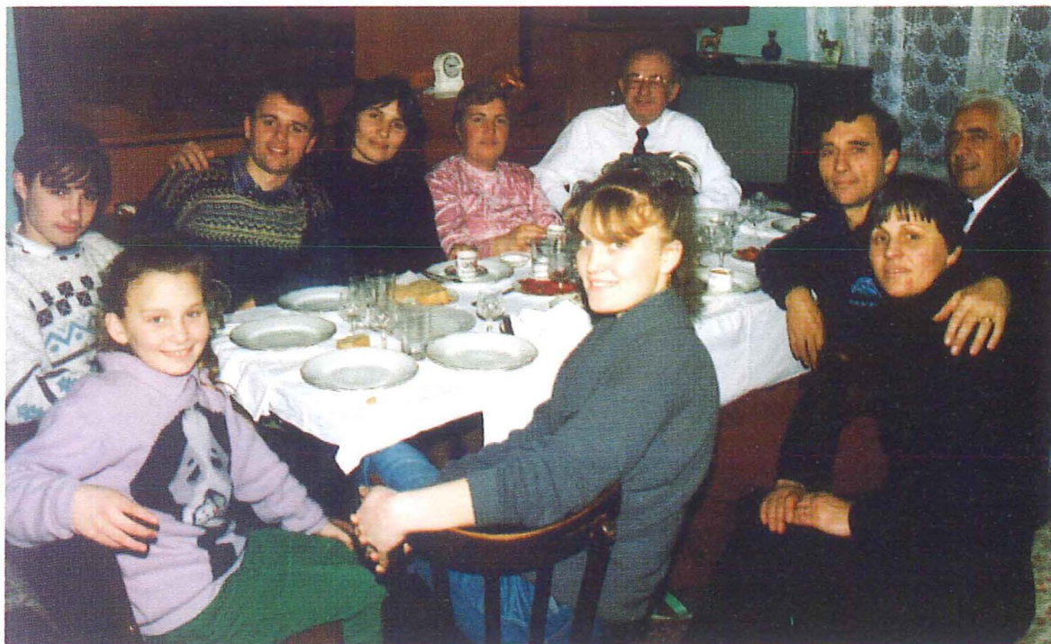
Familienbesuch in Durres