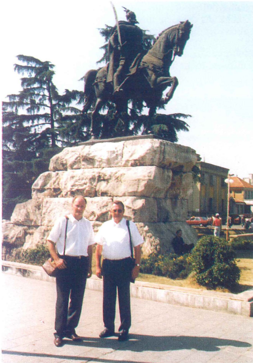
Am Skanderbeg-Denkmal in Tirana