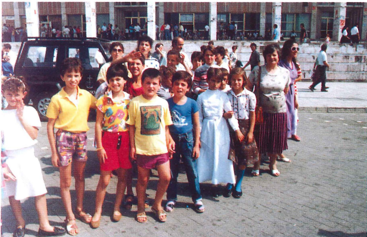
Nach einem Gottesdienst in Tirana