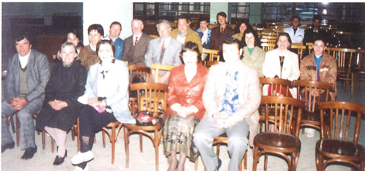
Erster Gottesdienst in Korça, 3. Mai 1994