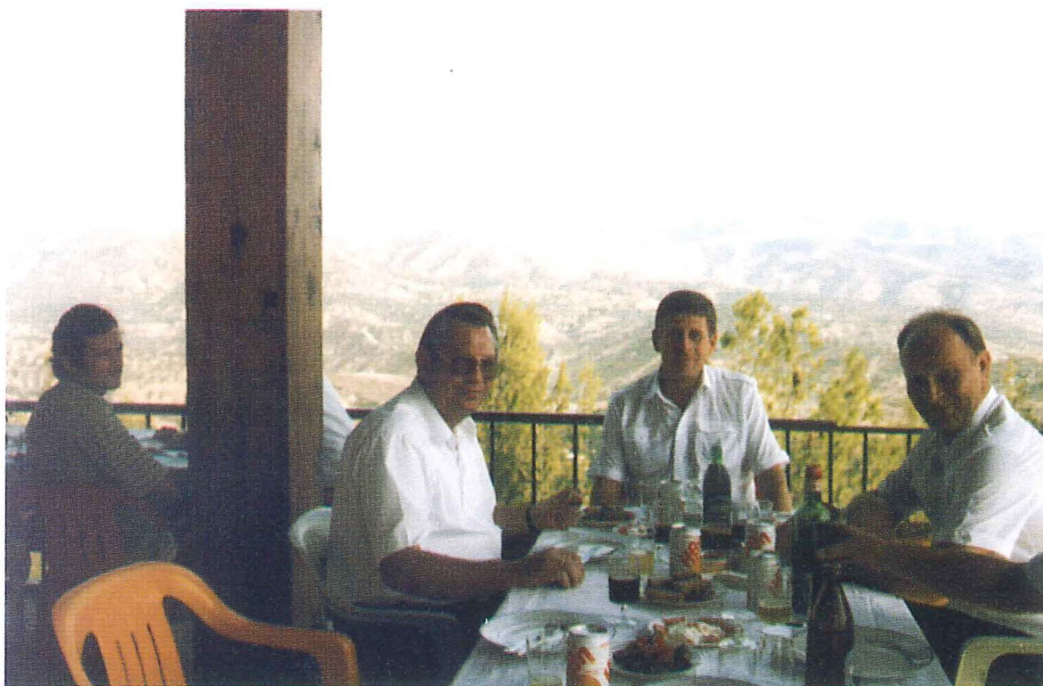
Mittagsrast oberhalb Berat