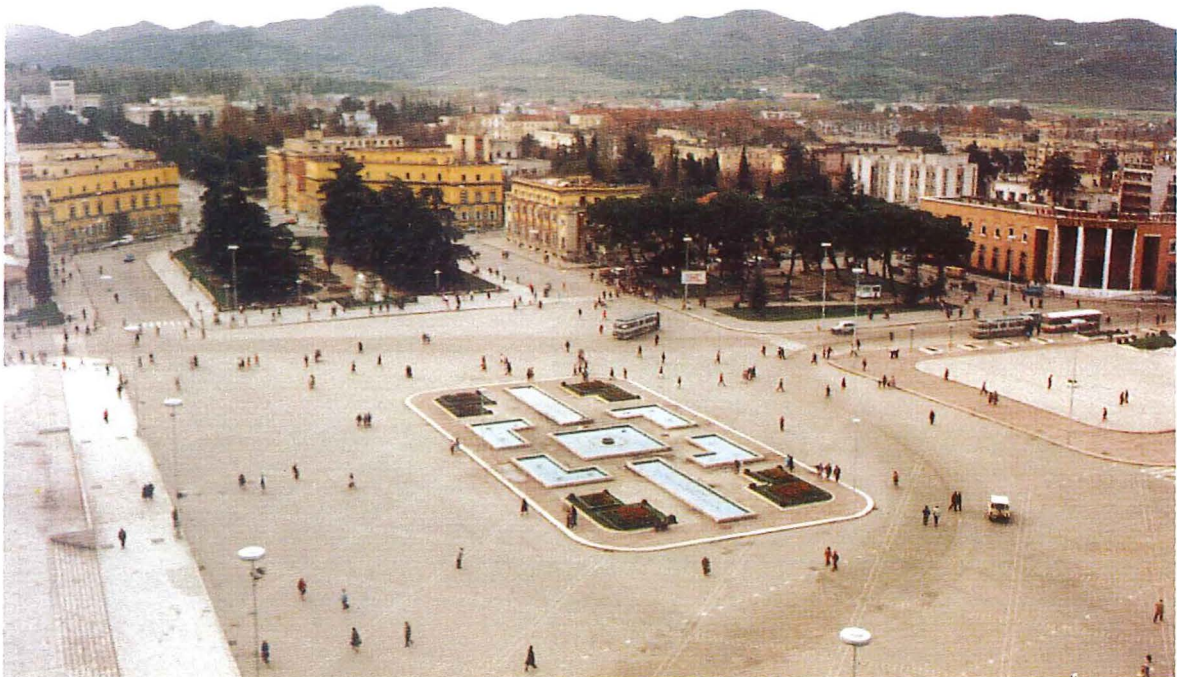
Der Skanderbeg-Platz im Zentrum Tiranas, November 1990

Im November 1990 war es den beiden Aposteln Klaus Dieter König und Bernd Klippert erstmals möglich, als Touristen in das Land einzureisen und sich einen ersten Eindruck zu verschaffen. In ihrem eigentlichen Auftrag konnten sie jedoch nicht tätig werden, denn damals war das Verbot religiöser Betätigung noch gültig.