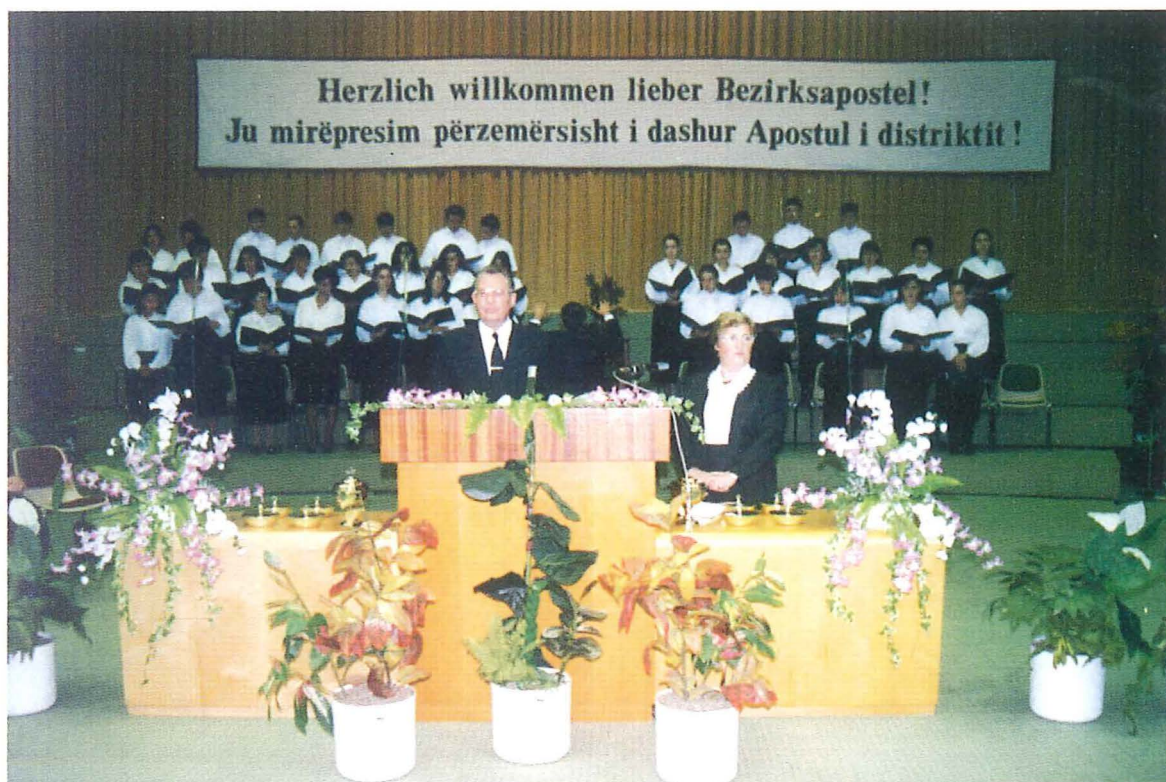
Gottesdienst am 21. November 1993 im Kongreßzentrum in Tirana

Das Dienen der deutschen Brüder wird durch geeignete albanische Dolmetscher ermöglicht, die sich große Mühe geben, so genau wie möglich, aber doch mit viel Herz zu übersetzen.