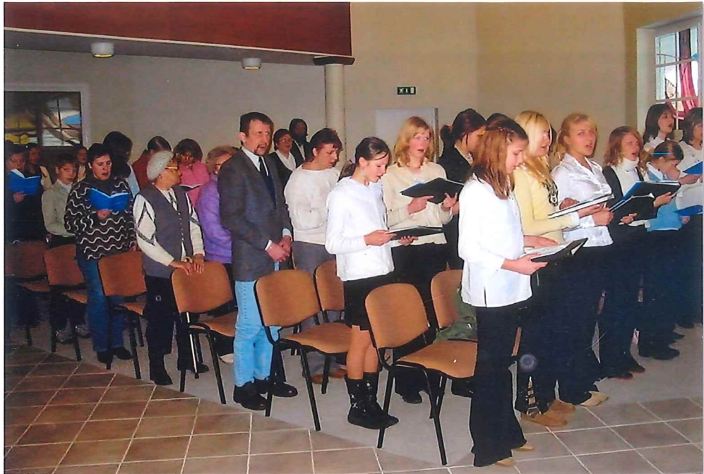
Blick in die Gemeinde