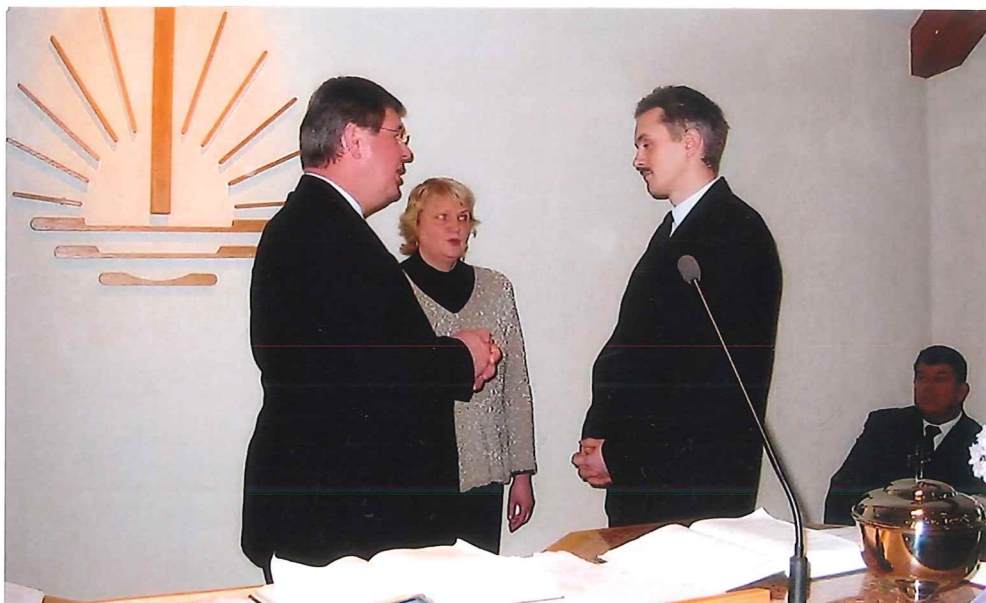
Bestätigung Priester Saarse