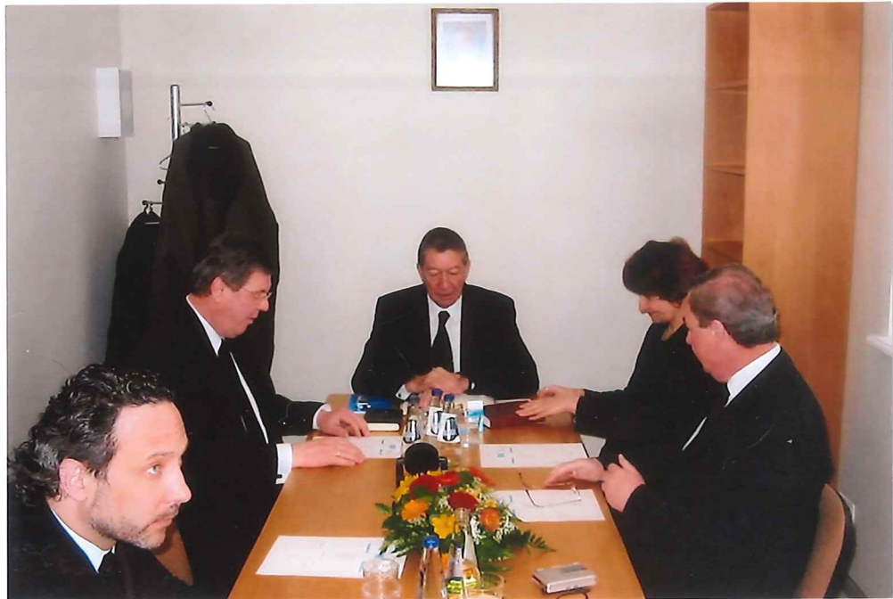
Vor dem Gottesdienst im Ämterzimmer