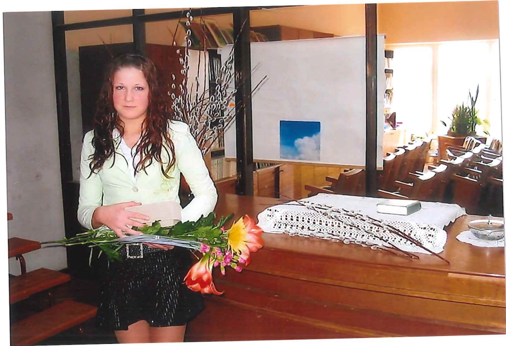
Die Konfirmandin aus der Gemeinde Sigulda

09.04.2006 Am 09.04.2006 (Palmsonntag) erlebten 3 junge neuapostolische Christen den Tag ihrer Konfirmation: Aus der Gemeinde Riga 2 Konfirmanden Aus der Gemeinde Sigulda 1 Konfirmandin