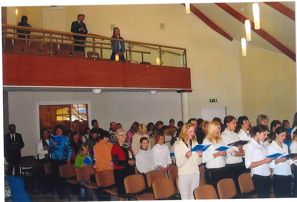
Blick in die Gemeinde