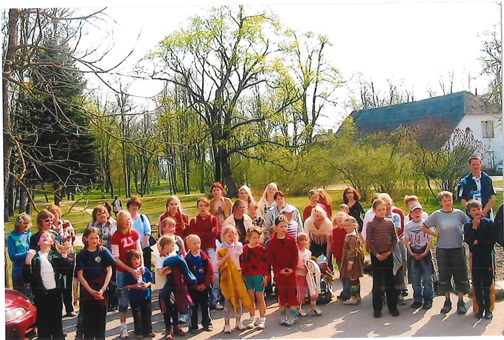
Verabschiedung am Schluss der Veranstaltung