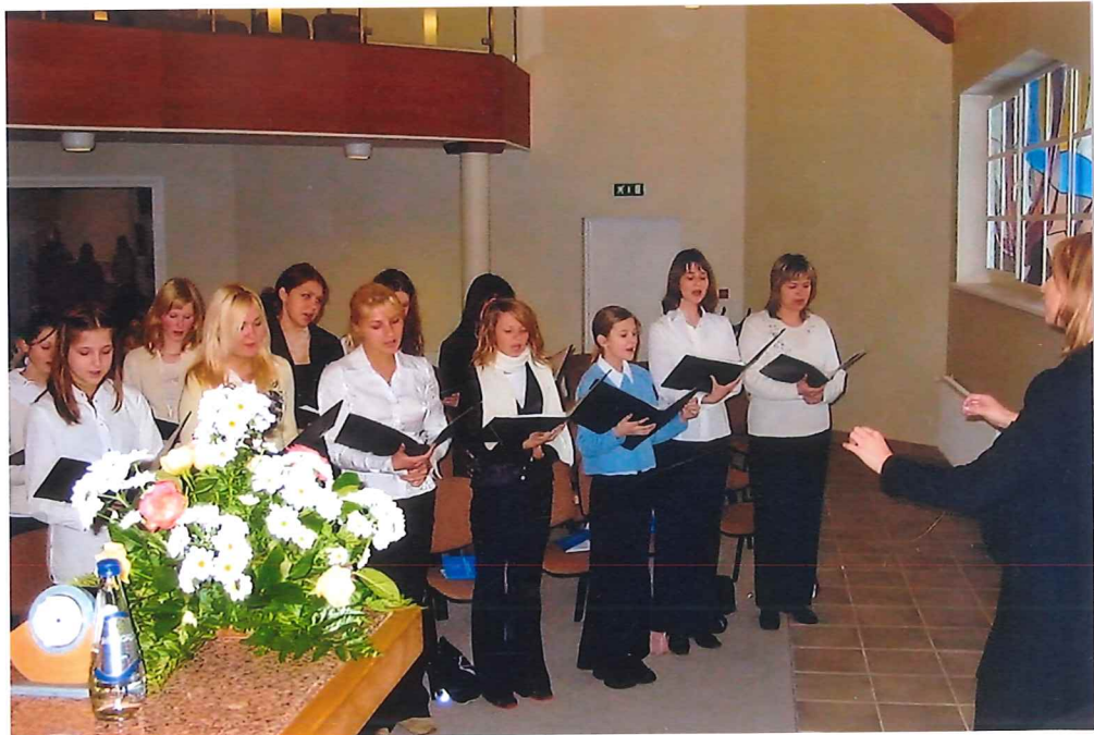
Ein Jugendchor erfreut die Geschwister