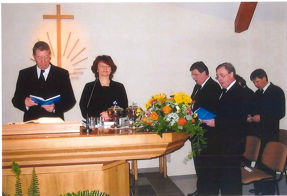
Der Bezirksapostel am Altar