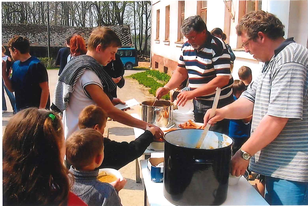
Auch für das leibliche Wohl ist gesorgt