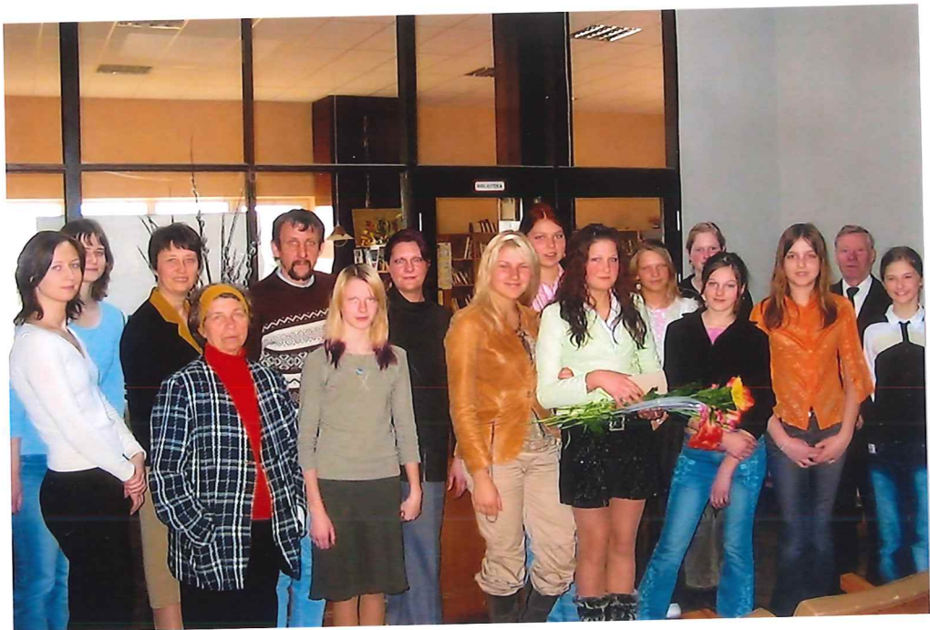
Die Konfirmandin mit Geschwistern der Gemeinde Sigulda