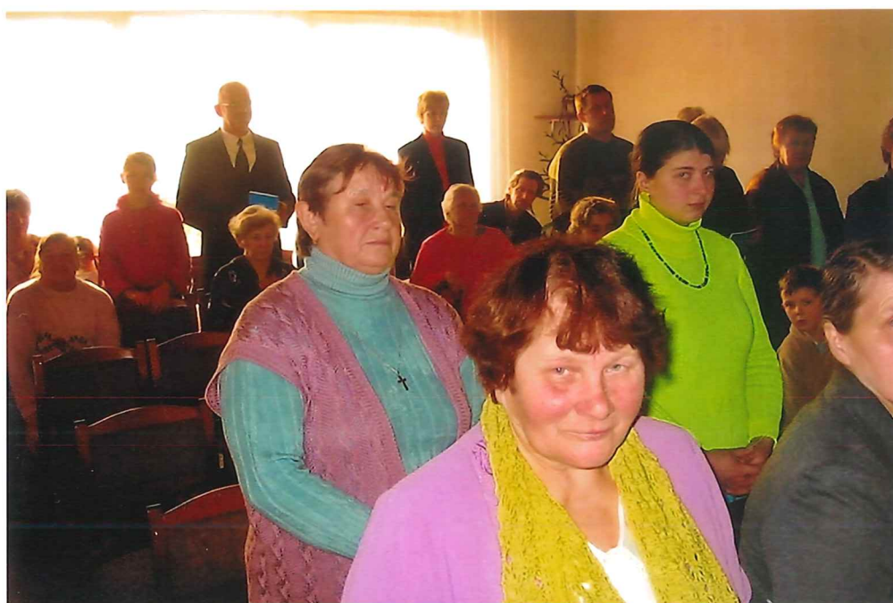
Blick in die Gemeinde