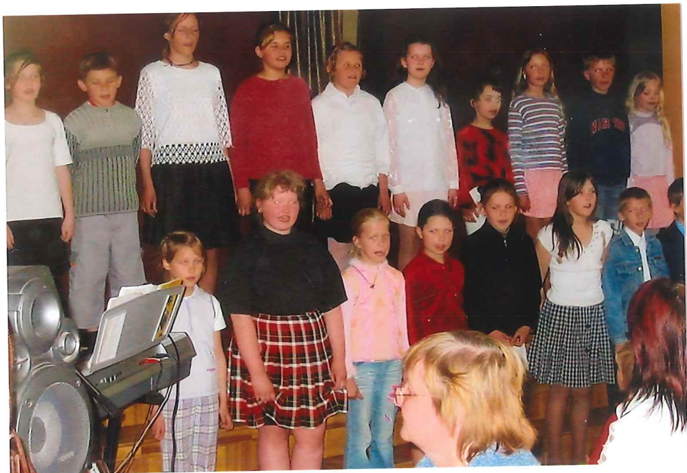
Kinderchor der Schule in Cere