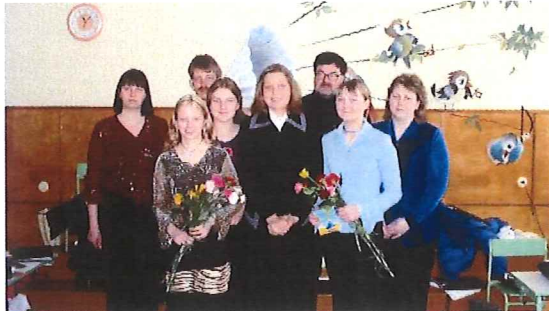
Konfirmandinnen aus Sigulda