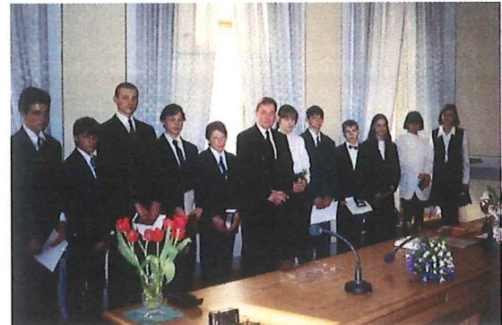
BÄ Karlisch hält Konfirmation für Jugendliche aus ganz Lettland

Den großen Tag ihrer Konfirmation erlebten 11 Konfirmanden/innen aus Lettland in Riga am Palmsonntag.