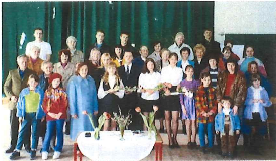
Gemeinde Kuldiga nach dem Konfirmationsgottesdienst am 08.04.2001