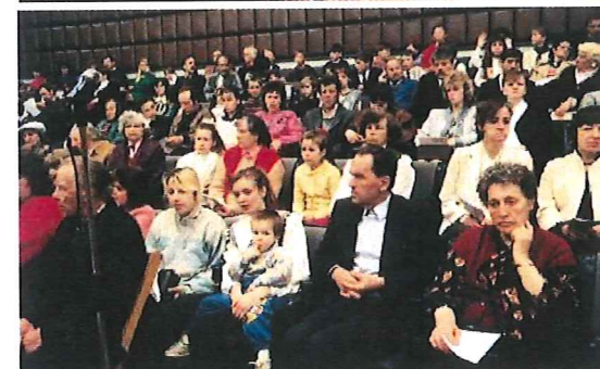
547 Gottesdienstteilnehmer erlebten den Gottesdienst im Wirtschaftszentrum von Riga.