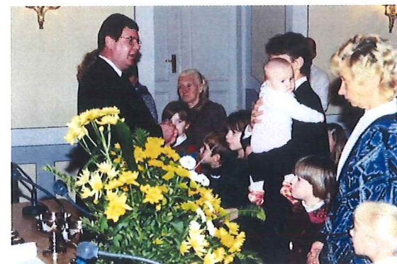
Hl. Versiegelung in Riga