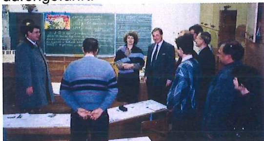
Seminar für Amtsbrüder in Sigulda

Von den missionsreisenden Brüdern werden auch Seminare mit Amtsträgern in regelmäßigen Abständen durchgeführt.