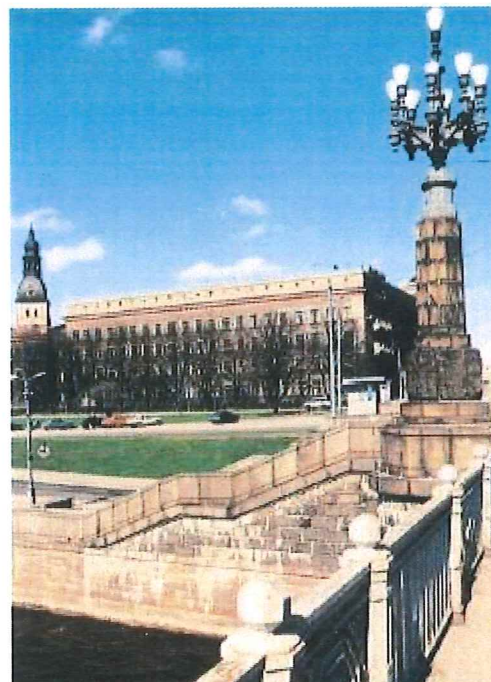
Drei Bilder: Die Stadt Riga präsentiert sich in typisch lettischer Gelassenheit. Viele Häuser und Straßen spiegeln den Einfluß der Hanse wider

Lettland hat ein typisch nordeuropäisches Klima mit nicht allzu warmen, nordisch-hellen Sommern und langen, schneereichen Wintern. Bis auf die weiten Sandstrände entlang der Ostsee und die fruchtbaren Ebenen ist das Land geprägt von einer lieblichen Hügellandschaft mit mehr als 2000 Seen.