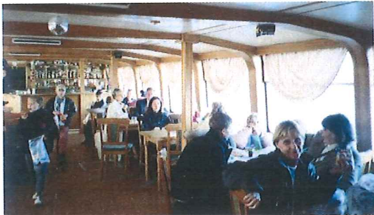
Schiffsfahrt auf der Daugava anlässlich des Kinder-/Jugendtages

Während in der Anfangszeit das Werk Gottes in Lettland eine sprunghafte Entwicklung zeigte, gab es in den letzten Jahren ein langsames Wachstum. Das hat seinen Grund. Ursprünglich stand die Missionsarbeit im Vordergrund aller Aktivitäten. Inzwischen wird der Schwerpunkt der Arbeit auf die Pflege und Betreuung der Gemeinden und Geschwister gelegt. Besondere Fürsorge gilt den Kindern und Jugendlichen. So finden seit 1994 regelmäßig Kinder-/ Jugendtage statt. Ein besonderes Erlebnis war eine Schiffsfahrt auf der Daugava, dem größten Fluss Lettlands.