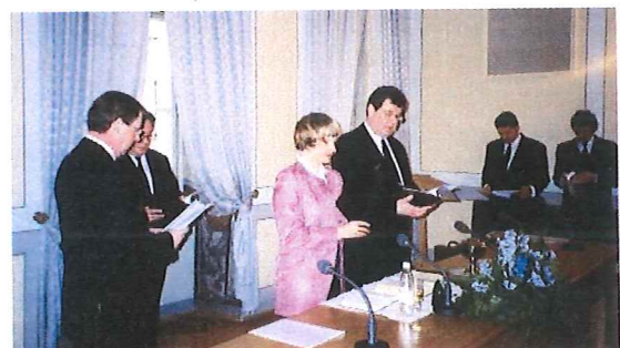
Gottesdienst in Riga am 26.04.1998