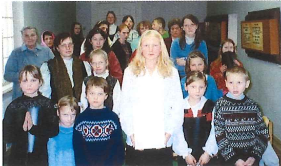
Gemeinde Jaunpils nach dem Konfirmationsgottesdienst am 08.04.2001