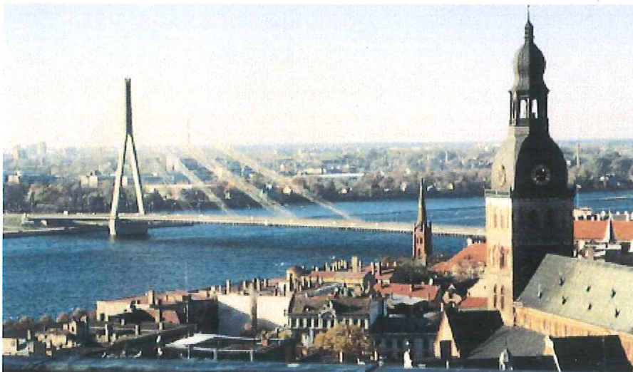
Blick über die Daugava auf Riga

Über Jahrhunderte bestimmte der Fluss Daugava die Geschichte Lettlands entscheidend mit. Schon vor über einem Jahrtausend nutzten Letten, Russen und Skandinavier die Daugava als Handelsstraße zwischen Nord, Ost und West. Im 13. Jahrhundert weckte sie das Interesse der deutschen Ordensritter. Heute bildet die Daugava die Grenze zwischen den beiden nördlichen Provinzen Lettlands, Vidzeme und Latgale, sowie den beiden südlichen, Kurzeme und Zemgale.