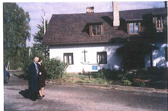
Unsere Kirche in Upesciems

In allen Gemeinden (außer Saldus) werden an jedem Sonntag Gottesdienste gehalten. In Jelgava und Upesciems bestehen eigene Versammlungsstätten. An allen anderen Orten finden die Gottesdienste in angemieteten Räumen statt.