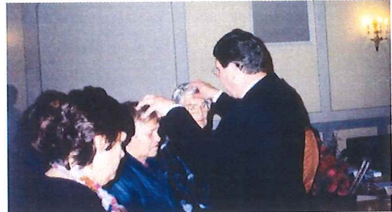
HI. Versiegelung im September 1997 durch Apostel Schorr im Reuternhaus in Riga

Auf Grund gesegneter Arbeit konnten 31 Seelen versiegelt werden (21 Erwachsene und 10 Kinder)