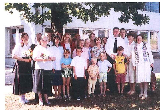
Geschwister aus der Gemeinde Kuldiga