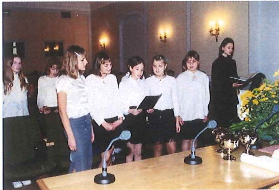
Der Jugendchor aus Sigulda umrahmt den Gottesdienst in Riga

In diesem Jahr besuchte Apostel Schorr die Geschwister in Lettland viermal. Er diente in den Gemeinden Riga, Kuldiga und Sigulda. Höhepunkte in diesen Gottesdiensten waren Hl. Versiegelungen an insgesamt 39 Seelen (25 Erwachsene und 14 Kinder).