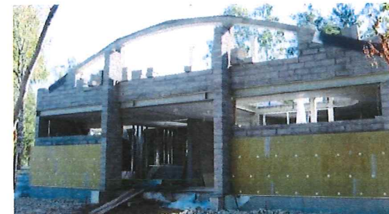
Zwei Bilder: Baufortschritt