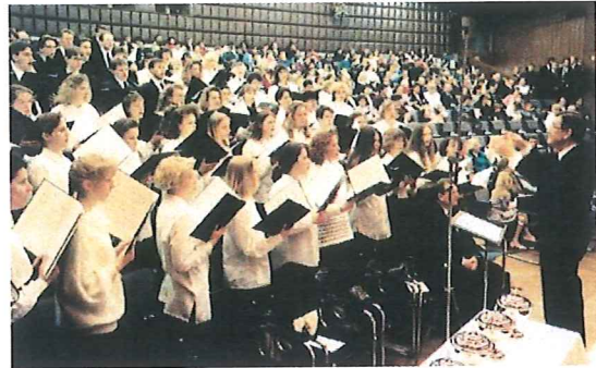
Jugendchor aus dem Bezirk Gelsenkirchen-Buer

„Und der Herr wird zu der Zeit zum andermal seine Hand ausstrecken, dass er das übrige seines Volkes erwerbe“