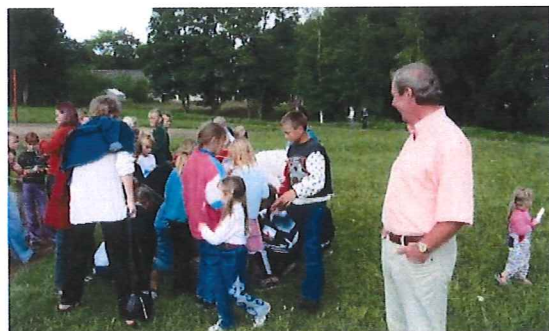
Kinder-/Jugendtag in Cere

Am 31. Mai 2003 war für die Geschwister in Lettland, besonders für die Gemeinde Riga, ein großes Ereignis angesagt. Nach jahrelanger Wartezeit wurde durch Apostel Schorr die Grundsteinlegung unserer Kirche in Riga vollzogen