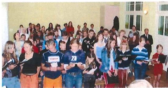
Kinder-/Jugendgottesdienst in Cere