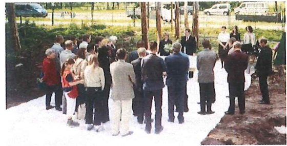
Grundsteinlegung für die neue Kirche in Riga. Apostel Schorr bei der Ansprache

Am 31. Mai 2003 war für die Geschwister in Lettland, besonders für die Gemeinde Riga, ein großes Ereignis angesagt. Nach jahrelanger Wartezeit wurde durch Apostel Schorr die Grundsteinlegung unserer Kirche in Riga vollzogen