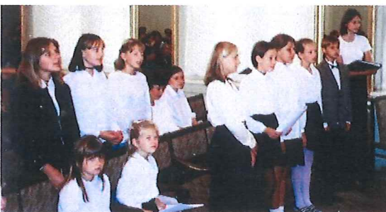
Der Kinder-/Jugendchor umrahmt den Gottesdienst

Apostel Schorr besuchte zweimal die Geschwister in Lettland. Beide Gottesdienste fanden mit HI. Versiegelung in Riga statt. Versiegelt wurden im Jahr 2000 insgesamt 28 Seelen. Im Gottesdienst am 09.04.2000 ordnete Apostel Schorr 3 Unterdiakone,