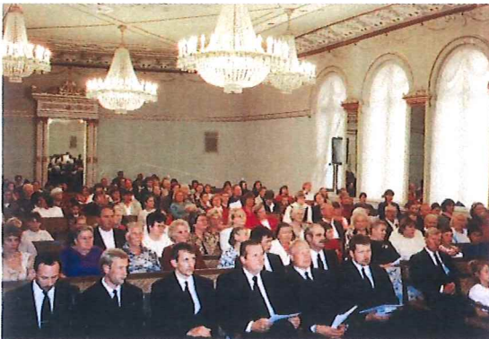
Blick in die Gemeinde