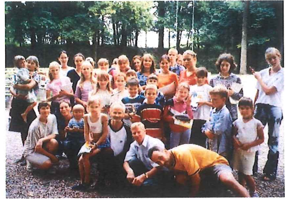
Zwei Bilder: Kinder-/Jugendtag in Jaunpils

Im Jahre 2002 ist es gelungen, ein Haus in Jelgava zu kaufen und es für gottesdienstliche Zwecke herzurichten. Damit besitzt die Gemeinde Jelgava eine eigene Versammlungsstätte.