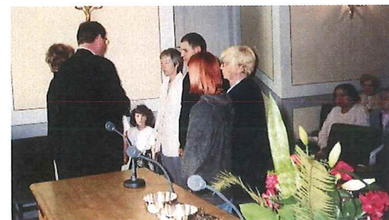
Hl. Versiegelung in Riga am 01.06.2003