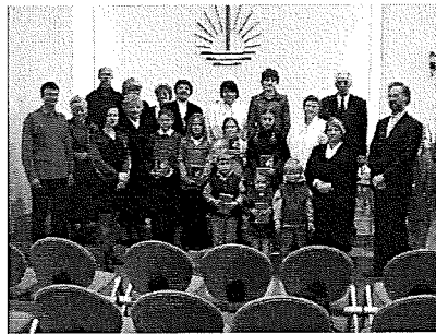
Kindergottesdienst Panevezys 04.05.2003