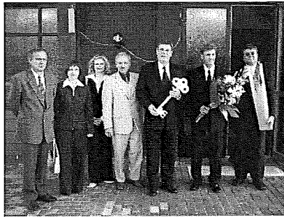
Schlüsselübergabe in Siauliai am 14.09.2003