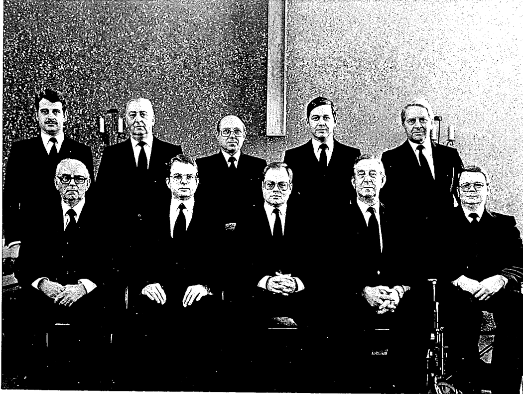
Amtsbrüder der Gemeinde Wetzlar II, Anfang 1984