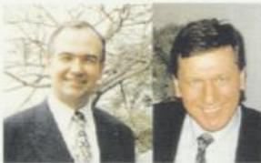
Arbeitsgebiete des Apostels Krause