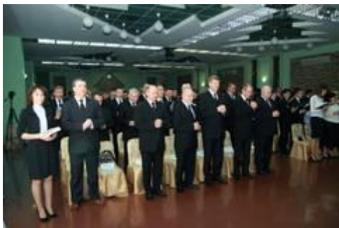
176 Besucher feiern mit...