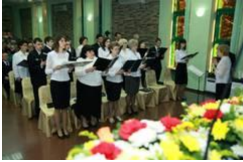
Der Chor umrahmte den Gottesdienst