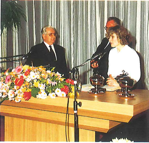
Am Altar in Salvador