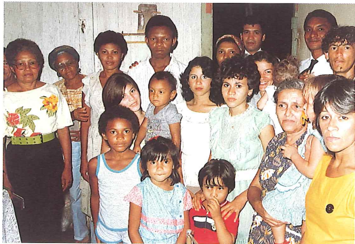
Gotteskinder am Amazonas

In Salvador war ein Bruder sehr krank und sollte wegen schwerer Durchblutungsstörungen und Venenzerfall beide Beine amputiert bekommen, doch auf Bitten seiner Frau wurde die Operation zunächst noch zurückgestellt. Es war für ihn in jener Zeit sehr schwer, die Gemeinden zu pflegen. Auch wurde Ersatz gebraucht, ein Amtsträger, der die Seelen pflegen konnte, wenn jenem Bruder die Beine versagten.