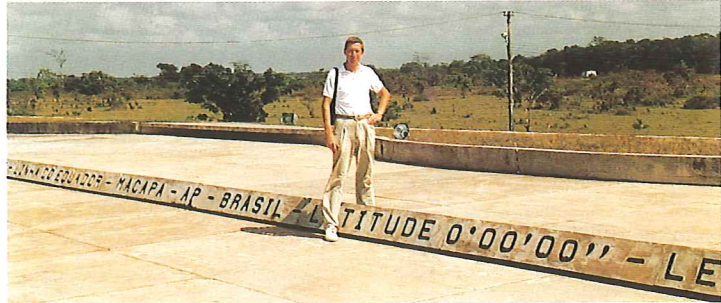
Am Äquator in Macapa, Nordbrasilien

Brüder in jeweils einer anderen Kirche tätig ist, fehlt es an gegenseitiger Hochachtung in der Familie nicht. Sein Vater hat einmal gesagt: „Es gibt keine andere Lehre als die Apostellehre!“