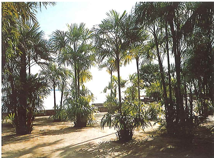
Tropische brasilianische Landschaft

Nachdem dieser Brief mir ein deutlicher Hinweis dafür war, nicht wie vorgesehen in Recife, sondern in der rund 600 Kilometer südöstlich davon liegenden Küstenstadt Salvador mit der Missionstätigkeit zu beginnen, brachte ein weiterer Brief einer jungen Glaubensschwester, der ebenfalls