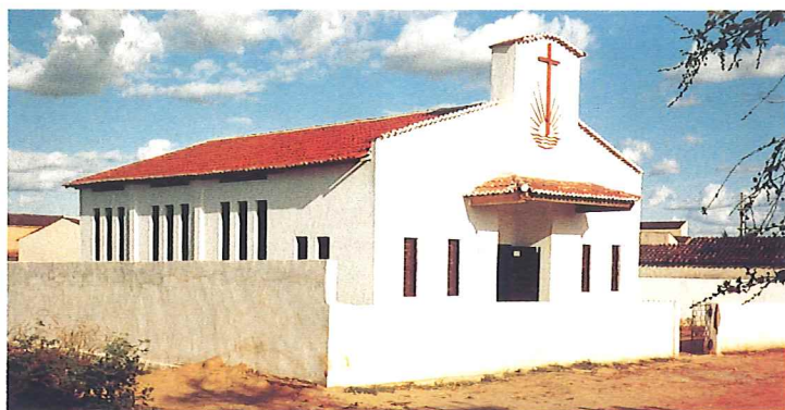
Das Gotteshaus in Grateus

Bei meinem zweiten Besuch in Brasilien war die Kirche fertig und konnte eingeweiht werden. Das Gelände und der Ortsteil waren nicht sehr ideal, das Grundwasser salzig und versumpfte die Gegend immer