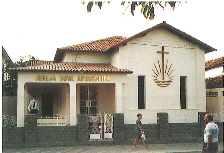
Unsere Kirche in Natal

Im Oktober 1983 hat mir Bezirksapostel Engelauf das Bundesland Ceará in Brasilien – mit einer Ost-West-Ausdehnung von 420 km und einer Nord-Süd-Ausdehnung von 540 km – zur Betreuung anvertraut. Es ist ein sehr dünn besiedeltes Land, das Verkehrsnetz kaum ausgebaut, Industrie findet man in Ceará selten. Die Fläche wird landwirtschaftlich genutzt, große Gebiete liegen als Buschland brach. Die Bevölkerung ist arm, und die einzige wirkliche Stadt ist die Haupt-