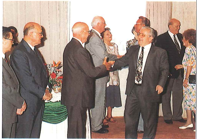
Der Stammapostel besucht Brasilien

bin ich in den Gebieten, für die vorher die Apostel Ehlebracht, Kusserow, Skielka und Wömpner zuständig waren, tätig. Für administrative Angelegenheiten stehe ich allen in Brasilien Nord tätigen Aposteln zur Seite.