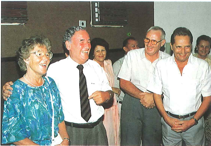
Vorstellung der Reiseteilnehmer

Als wir erneut den Ort aufsuchten, waren von den Nebendörfern noch einige Menschen mehr gekommen als erwartet. Der erste Gottesdienst war ein heiliger Augenblick; die Versammelten hörten aufmerksam zu, auch traten einige mit dem Begehren vor, die Wassertaufe zu empfangen. Christliche Glaubensvoraussetzungen waren nach unserer Feststellung vorhanden.