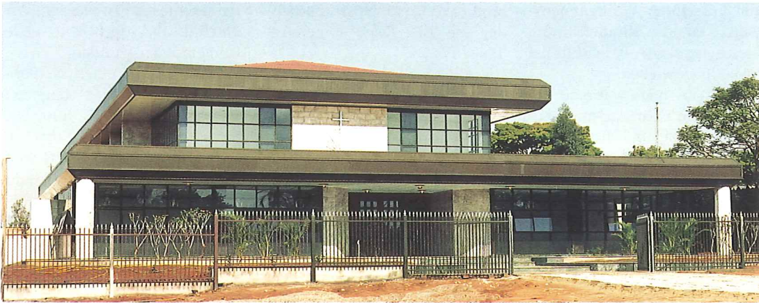
Unsere Kirche in der Hauptstadt Brasilia

mehr, so daß unsere erste Kirche langsam im Schlamm versank. Wir konnten aber rechtzeitig ein gutes Grundstück an der Hauptdurchgangsstraße erwerben. Apostel Augello hat da als Baumeister eine sehr schöne, ansprechende Kirche erstellt, heute das Schmuckstück jenes Ortsteils.