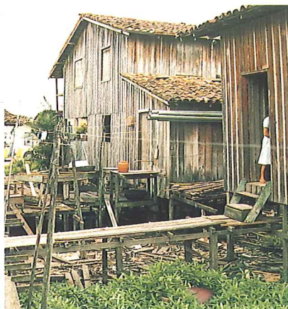
In einem Vorort von Belem

Es bleibt der Wunsch, daß auch dieses Beginnen sich weitergestalte und auch diese Seelen vollendet werden.