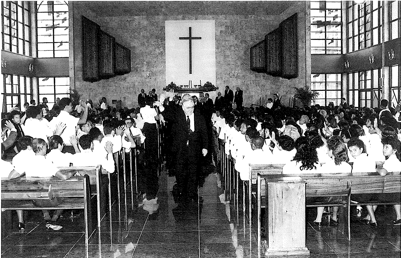
„Auf Wiedersehen“/„Até à vista“, Brasília 01.10.1989