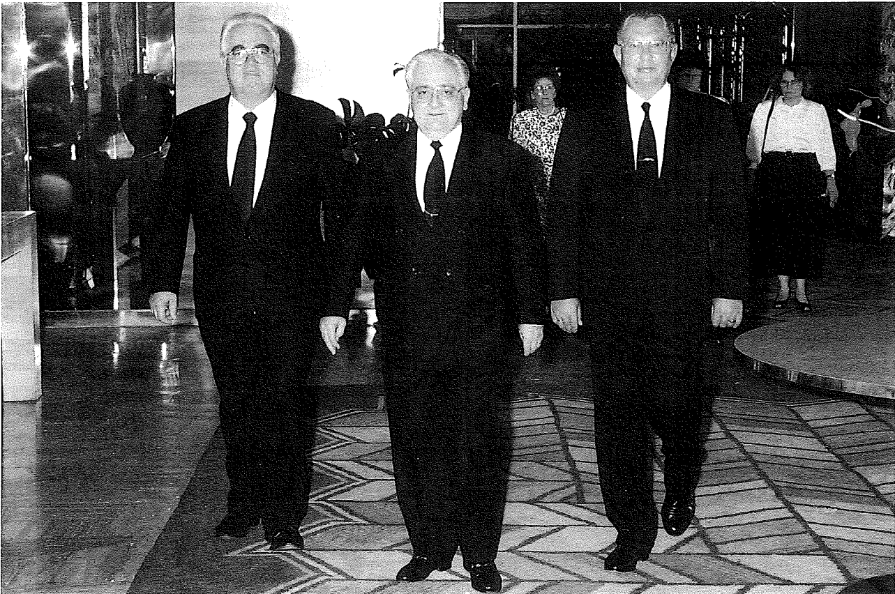
Rio de Janeiro 21.04.1994

A presença das religiões encontradas no Brasil, é muito ampla. De acordo com uma avaliação de 1997, 75% da população são católicos, 10% são protestantes e de outras comunidades cristãs. Além disto há uma minoria de budistas, muçulmanos, grupo de Bahá e judeus. Também as religiões naturais dos índios e a cultura afro-brasileira devem ser citadas.