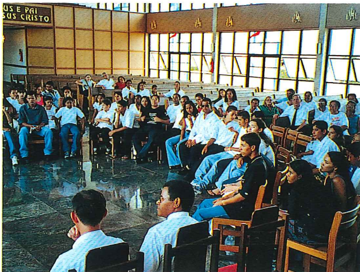
Jugendtag in Brasília/Asa Norte Dia da Juventude em Brasília/Asa Norte