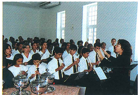
Chor mit Flötenensemble in Salvador/Amaralina Coro com elenco de flautas em Salvador/Amaralina