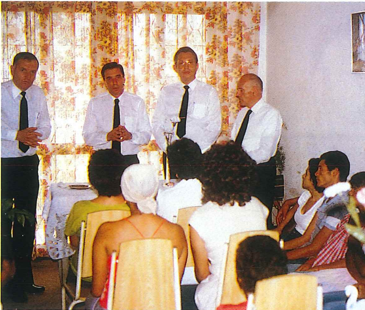
Erster Versiegelungsgottesdienst in Brasília am 05.02.1985 Primeiro Serviço Divino de selamento em Brasília no dia 05.02.1985