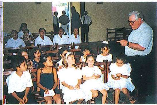
Sonntagsschule in Fortaleza/Maracanaú Escola Dominical em Fortaleza/Maracanaú