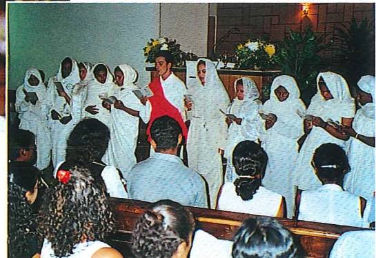
Jugendgottesdienst in Recife/Piedade Serviço Divino da Juventude em Recife/Piedade