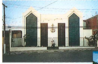
Salvador/Feira de Santana