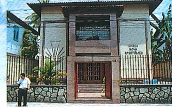
Rio de Janeiro/Maracanã