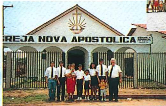
Rio Branco/Morada do Sol