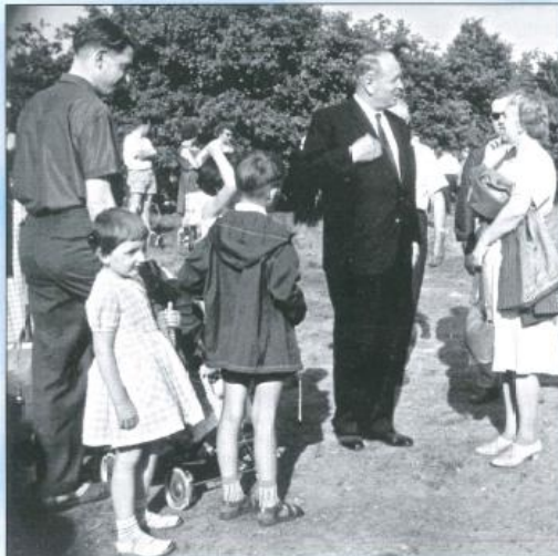
„Schäferberg 1956“ - Gedankenaustausch in freier Natur.

St.-Apostel Bischoff wirkte 1930 bis 1960