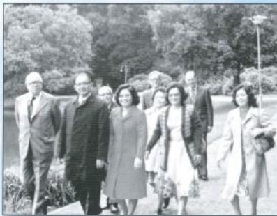
Besuch aus Übersee in Bremen, Juni 1977.