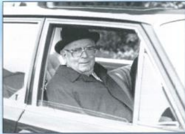
„Es geht nach Hause“, Ocholt, 1978.