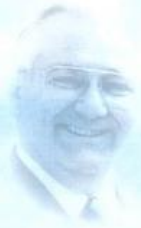
St.-Apostel Fehr wirkt seit 1988