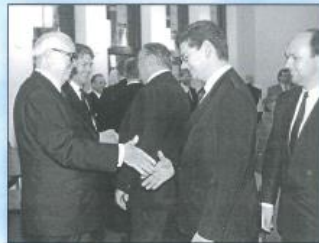
Einweihung Kirche Norderney 1990.