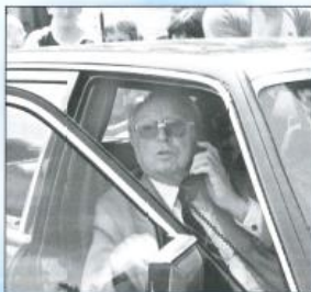
Pfingsten auf der „Große Höhe“ 1985 im Gespräch mit dem Stammapostel.