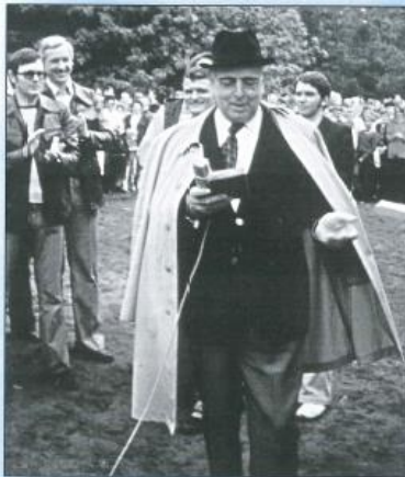
Gute Stimmung, „Schäferberg“ 1974.