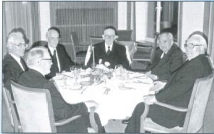
„Apostelrunde“, Parkhotel-Bremen, Oktober 1977.