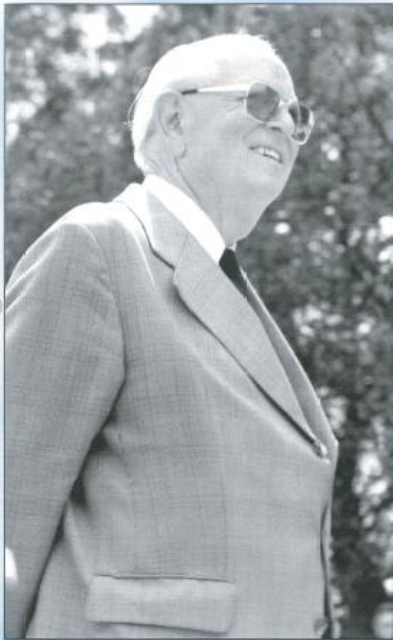
„Zufriedenheit“ - Mai 1986.