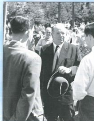
Pfingsttreffen in Varel, 1963.