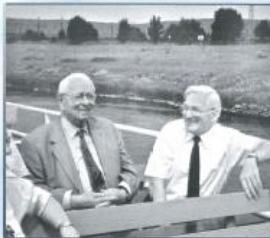
„Eine Seefahrt, die ist lustig..“ Juni 1998.