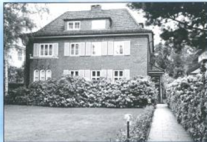
Verwaltung ab 1968, vor der Umgestaltung des Vorplatzes.