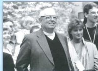
Fröhliche Gesichter am 2. Pfingsttag 1984.