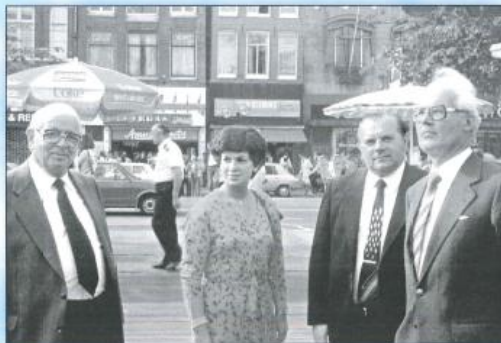
Holland, August 1979.