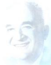
St.-Apostel Streckelsen wirkte 1975 bis 1978