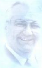
St-Apostel Fehr wirkt seit 1988