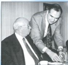
Weihnachtsfeier in der Verwaltung 1996.