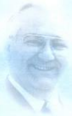
St.-Apostel Fehr wirkt seit 1988