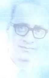
St.-Apostel Urwyler wirkte 1978 bis 1988