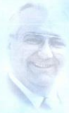
St.-Apostel Fehr wirkt seit 1988