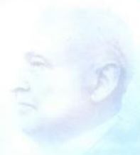
St.-Apostel Schmidt: wirkte 1960 bis 1975