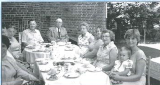
Im Geschwisterkreis läßt es sich gut leben - Gemeinde Bremen-Schwachhausen.