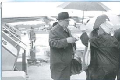
Ankunft in Montevideo April 1966.