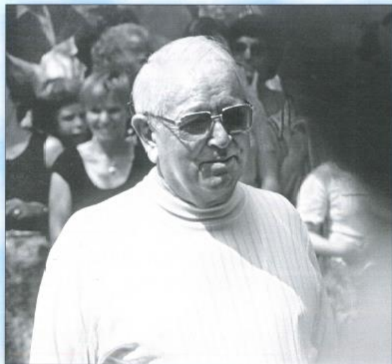
2. Pfingstag 1979 „Streeker Moor“.