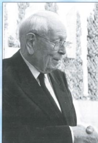
Seniorentag Oldenburg 1999.