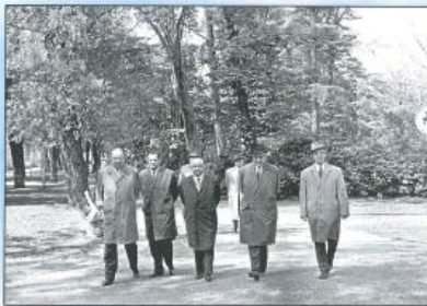
Begegnung mit Stammapostel Schmidt in Rotterdam - Mai 1963.