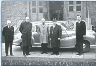
Stammapostel Schmidt in Bremen-Findorff, März 1961.