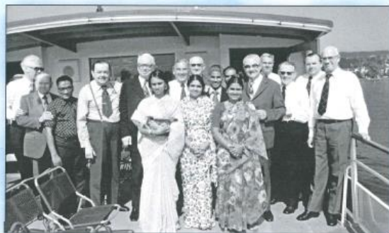
Eine harmonische Gemeinschaft - Zürich im Juni 1975.