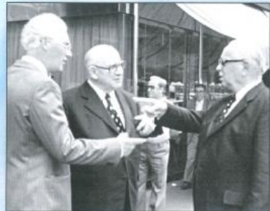
Angeregtes Gespräch in Straßburg, Juli 1976.