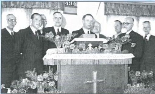
Bremen - Osterior 1951.