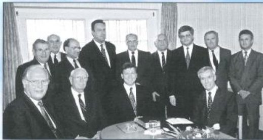
Senioren-Gottesdienst Bremerhaven-Geestemünde, April 1995.