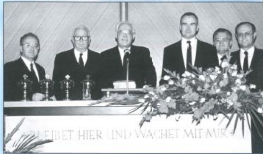
In Bremen- Sebaldsbrück, 1991.