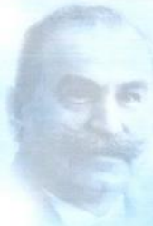
St.-Apostel Bischoff wirkte 1930 bis 1950