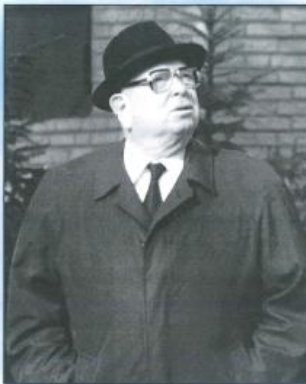
Ein prüfender Blick nach oben, Westerstede Mai 1983.