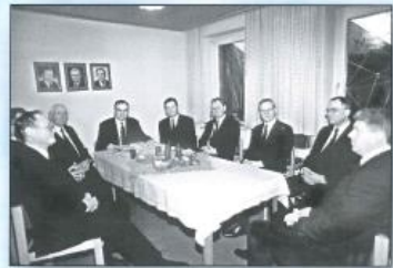
Zentralgottesdienst in Achim, Dezember 1997.