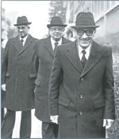
Der Stammapostel geht voran - Bern, 1979.