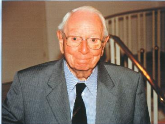
Bezeichnend bis heute, sein weiser und klarer Blick.