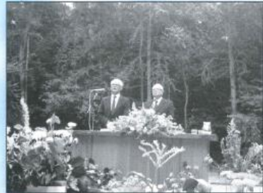
Jugendtag Holland, August: 1979.