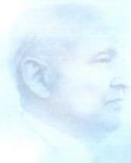
St.-Apostel Schmidt wirkte 1960 bis 1975