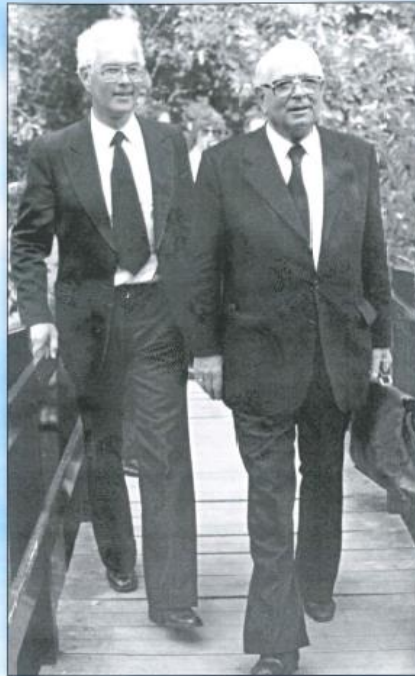
Jugendtag 1978 in Den Haag.