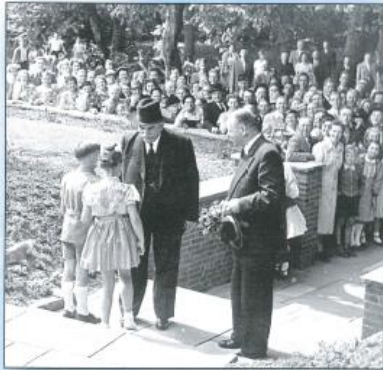
Bremen - Gröpelingen Juli 1955.