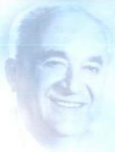
St.-Apostel Streckelson wirkte 1975 bis 1976