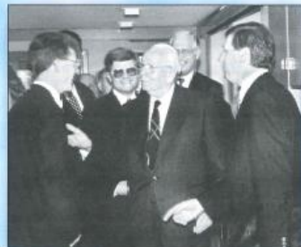
Bremerhaven-Geestemünde, April 1995.