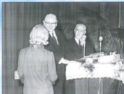
Gottesdienst in Montevideo 1966.