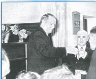
Verabschiedung beim Großen Kindergottesdienst, Delmenhorst-Neikenstraße 1956.

St.-Apostel Bischoff wirkte 1930 bis 1960