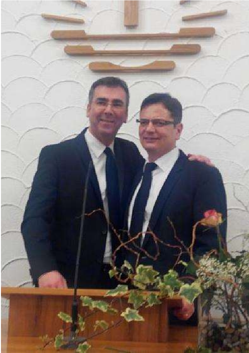
"Alter" und "neuer" Vorsteher 21.3.2015