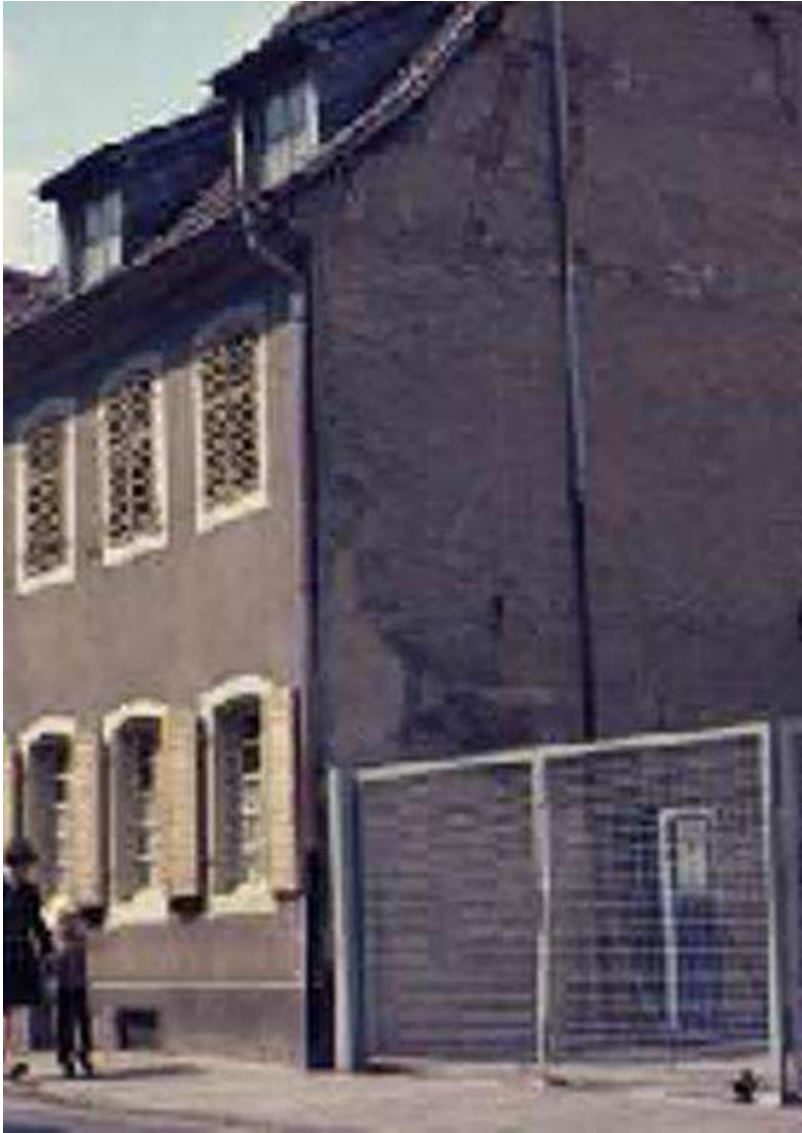
Anwesen Kirchenstr. 20