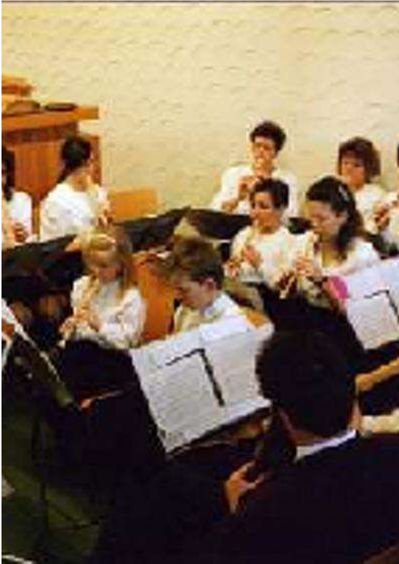
Flötengruppe am 13.03.1993