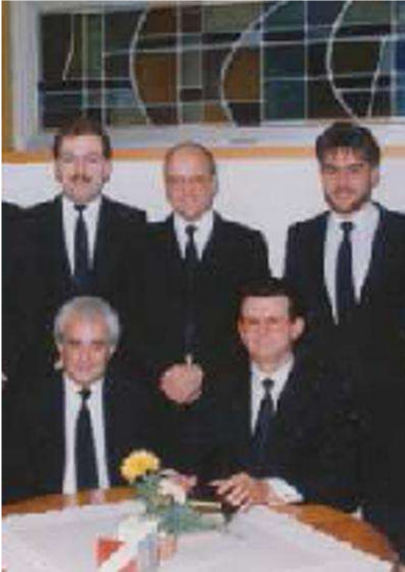
1986: Amtsträger der Gemeinde