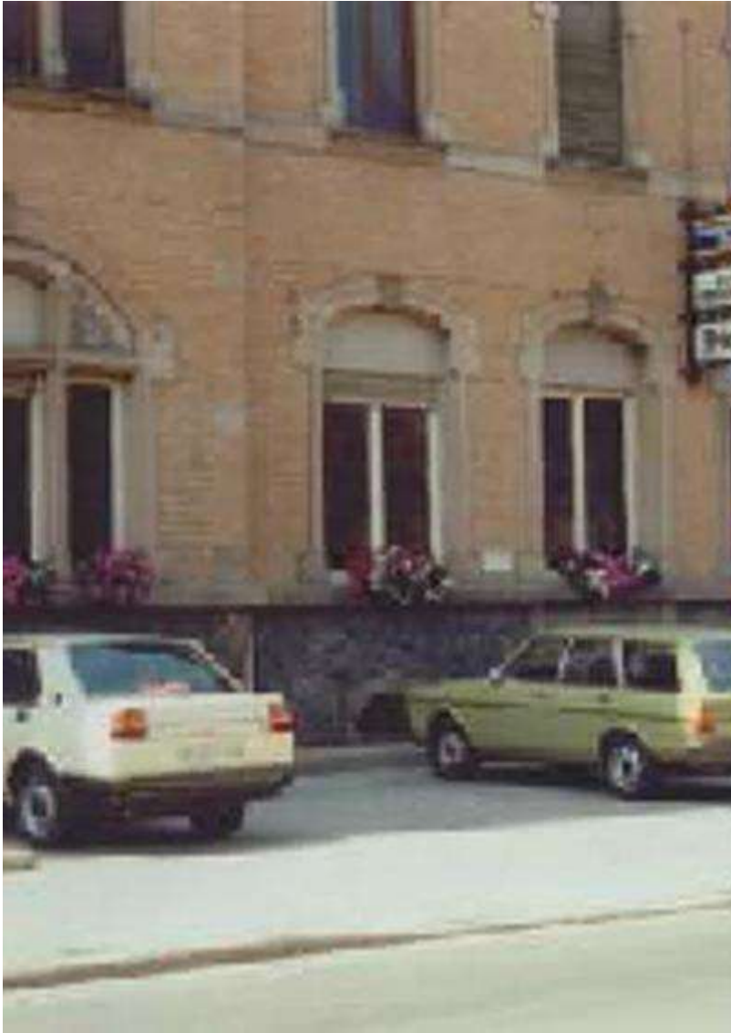
Zum Bayrischen Hiesl