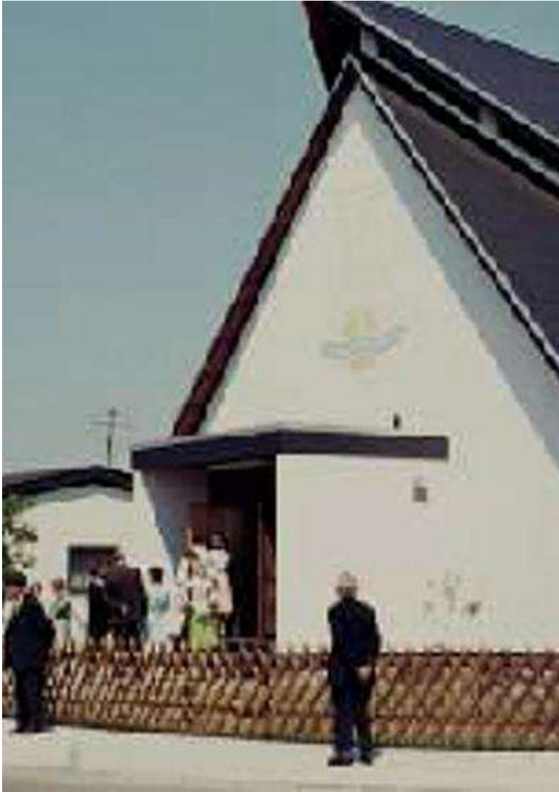
8. Juni 1975: Tag der Einweihung