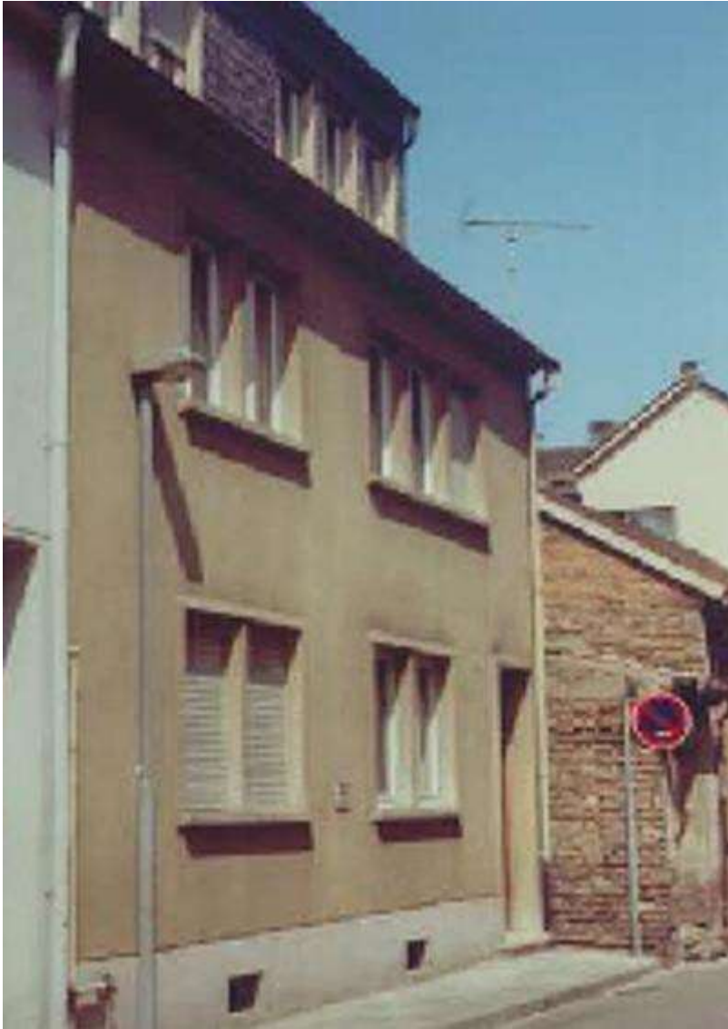
Sternegasse Nr. 6