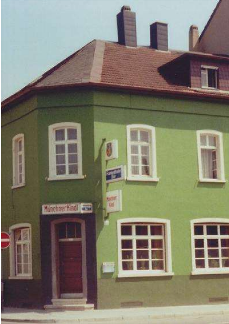
Gastwirtschaft Münchner Kindl