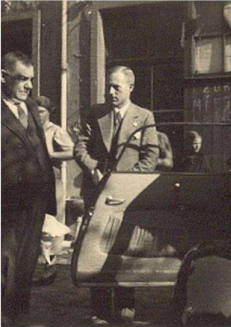
Historische Aufnahme 1935