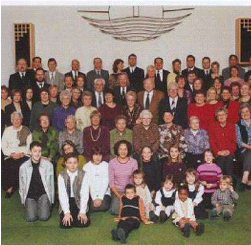
ie Gemeinde Frankenthal im November 2